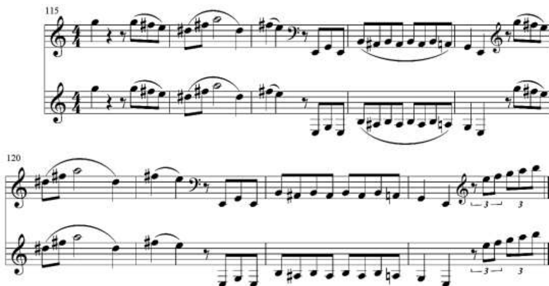
fig. 14 tomado de partituras para clarinete del concierto para clarinete y orquesta en La Mayor KV622 de Wolfgang Amadeus Mozart, edición Barënreiter.

En la anacrusa del compás 124 se debe separar de forma muy delicada utilizando una articulación similar al portato y con un pequeño crescendo hacia el do del compás 124, en este mismo compás se debe repetir la intención de los tresillos tocados anteriormente del compás 123. En el pasaje de las semicorcheas se sugiere apoyarse en los primeros y los terceros tiempos y hacer un leve crescendo para llegar a la cadencia del compás 127. Además es importante realizar un crescendo desde las semicorcheas del compás 125. Fig. 15.