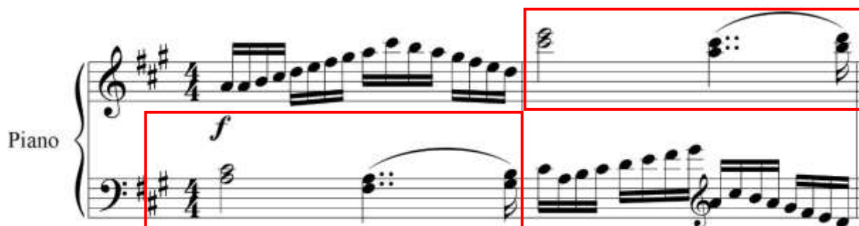
fig. 5 tomado de partituras para piano del concierto para clarinete y orquesta en La Mayor KV622 de Wolfgang Amadeus Mozart, edición Barënreiter.

Finalmente hay una coda del compás 53 al 56. Fig. 6