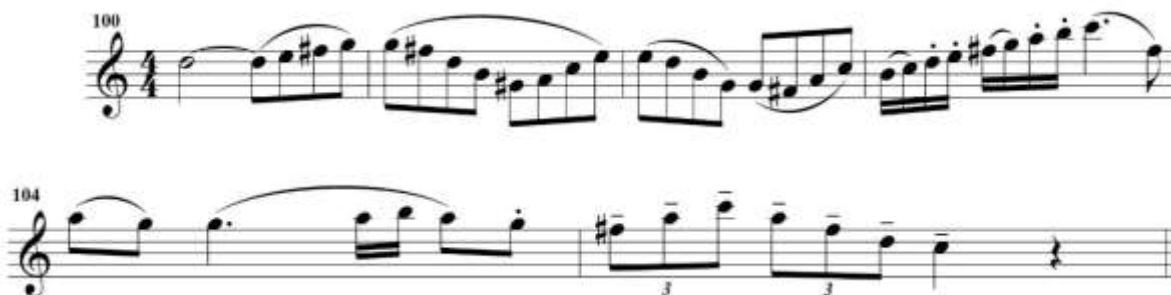
fig. 12 tomado de partituras para clarinete del concierto para clarinete y orquesta en La Mayor KV622 de Wolfgang Amadeus Mozart, edición Barënreiter.

Para esta sección del concierto es importante que se resalte el nuevo tema y el nuevo ambiente que este genera, por lo tanto es importante que todas las corcheas duren exactamente lo mismo, haciéndolas lo más largas posible. En el compás 103 se recomienda articular de la siguiente forma: dos semicorcheas ligadas y dos semicorcheas separadas. Finalmente es importante que en el compás 105 se haga énfasis en la separación de los tresillos, sin embargo no es necesario tocarlos estrictamente cortos, sino por el contrario, se debe usar una articulación un poco más larga, casi una articulación portato 3 .