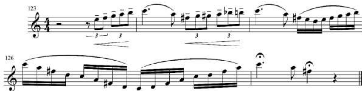
fig. 15 tomado de partituras para clarinete del concierto para clarinete y orquesta en La Mayor KV622 de Wolfgang Amadeus Mozart, edición Barënreiter.

En la anacrusa del compás 124 se debe separar de forma muy delicada utilizando una articulación similar al portato y con un pequeño crescendo hacia el do del compás 124, en este mismo compás se debe repetir la intención de los tresillos tocados anteriormente del compás 123. En el pasaje de las semicorcheas se sugiere apoyarse en los primeros y los terceros tiempos y hacer un leve crescendo para llegar a la cadencia del compás 127. Además es importante realizar un crescendo desde las semicorcheas del compás 125. Fig. 15.