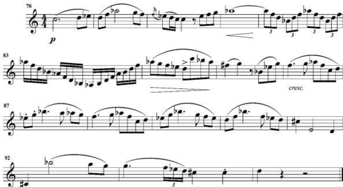
fig. 10 tomado de partituras para clarinete del concierto para clarinete y orquesta en La Mayor KV622 de Wolfgang Amadeus Mozart, edición Barärenreiter.

En este pasaje el cambio de tonalidad sugiere un cambio de ambiente, por lo que se sugiere tocar con un color diferente, como si fuese más lejano el sonido. Desde la anacrusa del compás 81 se debe iniciar un crescendo hasta el compás 84, en el cual debe hacerse un diminuendo para finalizar la semifrase, a continuación se debe ser muy cuidadoso con la dinámica en la que se inicia la siguiente frase, la cual debe ser exactamente la misma con la que se finalizó. La sección comprendida entre el compás 86 y el compás 94 debe tocarse en crescendo todo el tiempo.