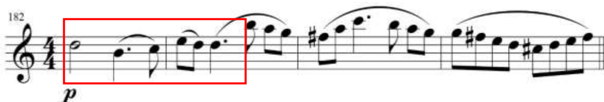
fig. 19 tomado de partituras para clarinete del concierto para clarinete y orquesta en La Mayor KV622 de Wolfgang Amadeus Mozart, edición Barënreiter.

A partir del compás 180, hasta el compás 192 donde el clarinete presenta sus virtudes melódicas a través de escalas. Los compases 188 y 189 se encuentran sincopados. Fig. 20.