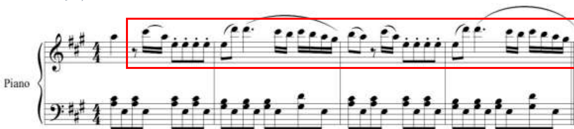
Fig. 5, variación del tema principal.

fig. 4 tomado de partituras para piano del concierto para clarinete y orquesta en La Mayor KV622 de Wolfgang Amadeus Mozart, edición Barënreiter.