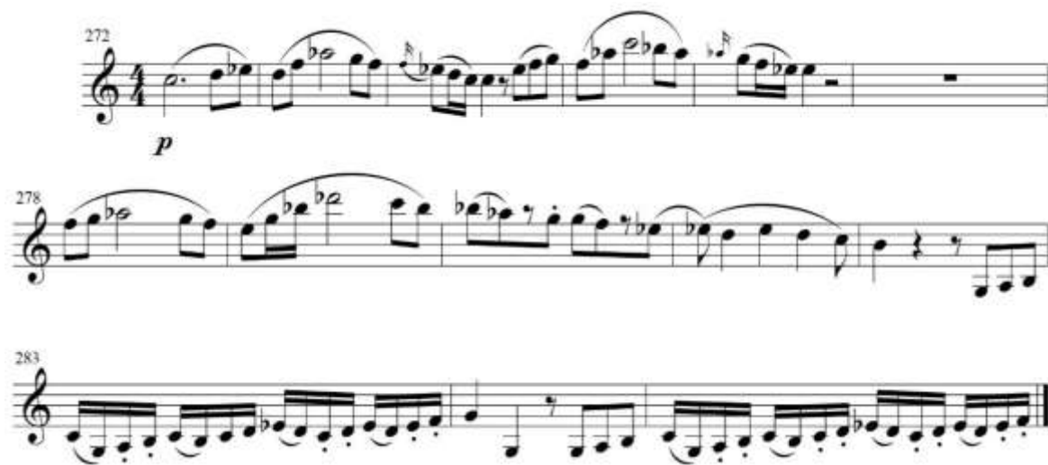
fig. 27 tomado de partituras para clarinete del concierto para clarinete y orquesta en La Mayor KV622 de Wolfgang Amadeus Mozart, edición Barënreiter.

En el compás 272 se presenta el tema B´ en la tonalidad de la menor, y en seguida se puede apreciar el uso del registro grave del instrumento. Fig. 27.