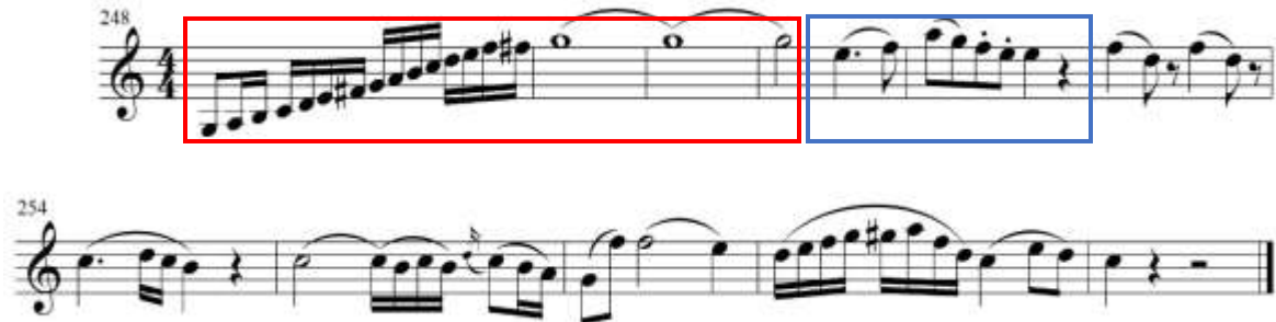
fig. 26 tomado de partituras para clarinete del concierto para clarinete y orquesta en La Mayor KV622 de Wolfgang Amadeus Mozart, edición Barënreiter.

Para la interpretación de la re-exposición se sugiere tocar teniendo en cuenta las sugerencias presentadas anteriormente debido a que las ideas se repiten y las intenciones de la música son las mismas.