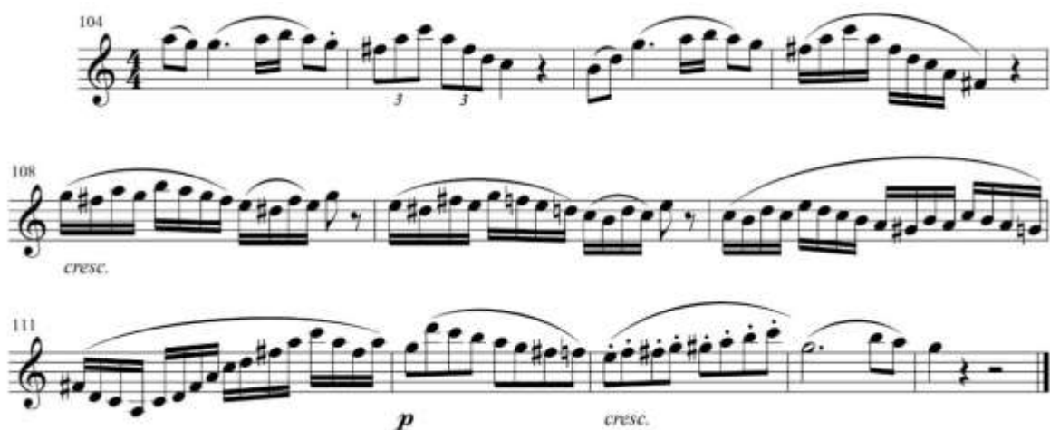
fig. 13 tomado de partituras para clarinete del concierto para clarinete y orquesta en La Mayor KV622 de Wolfgang Amadeus Mozart, edición Barënreiter.

Para los pasajes que incluyen semicorcheas, como el que se encuentra del compás 107 al 111, se recomienda tocarlas ligadas, apoyando la intención de la frase en los primeros y lo terceros tiempos de cada compás. De igual forma desde el compás 108 debe hacerse un crescendo progresivo hasta el compás 112, allí debe cuidarse el intervalo entre el sol y el re, los cuales deben interpretarse más piano que el resto de la frase y a partir del compás 113 realizar un pequeño crescendo de intención debido a que la música se encuentra en ascenso, en el compás 114 se debe hacer un diminuendo hasta el final de la frase. Fig. 13.