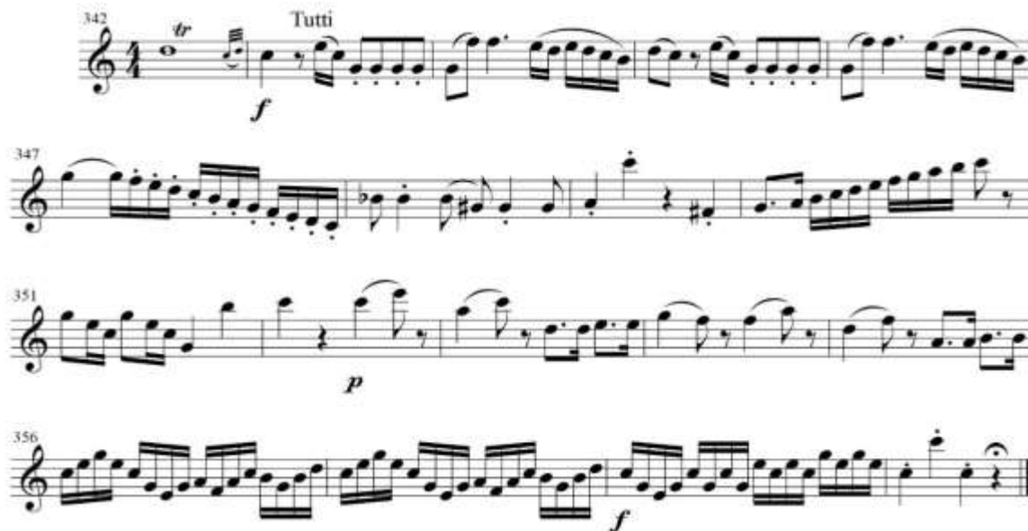
fig. 30 tomado de partituras para clarinete del concierto para clarinete y orquesta en La Mayor KV622 de Wolfgang Amadeus Mozart, edición Barënreiter.