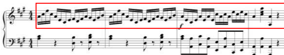
fig. 6 tomado de partituras para piano del concierto para clarinete y orquesta en La Mayor KV622 de Wolfgang Amadeus Mozart, edición Barënreiter.

Exposición: Inicia en el compás 57 con la entrada del solista en la tonalidad de la Mayor. El solista presenta una primera idea temática de ocho compases. (57-64) Fig. 7. Para el inicio del concierto es muy importante articular de forma muy clara y delicada los dos primeros compases de la frase, se recomienda tener especial cuidado con las separaciones entre el sol y el mi, y cuidar las notas que tienen indicada la articulación de staccato. En el compás 59 se