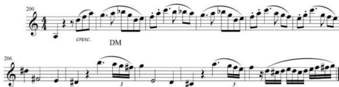
fig. 23 tomado de partituras para clarinete del concierto para clarinete y orquesta en La Mayor KV622 de Wolfgang Amadeus Mozart, edición Barënreiter.

En la anacrusa para el compás 201 se muestra de nuevo el tema B visto durante la exposición, esta vez en la tonalidad de Re mayor, este tema se extiende hasta el compás 208 y finaliza con una frase abierta con propósitos modulantes. Fig. 23. Por ser igual a la frase presentada anteriormente se sugiere la misma idea interpretativa. En esta sección la edición de la partitura sugiere que se puede articular de dos formas: ligado o staccato, esta decisión se deja a la libertad del intérprete, sin embargo se sugiere que se utilice el staccato.