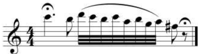
fig. 16 tomado de partituras para clarinete del concierto para clarinete y orquesta en La Mayor KV622 de Wolfgang Amadeus Mozart, edición Barärenreiter.

En el compás 128 aparece el motivo B2 en la tonalidad de Mi mayor, presentado primero por la orquesta y enseguida por el solista en forma de canon. Fig. 17.