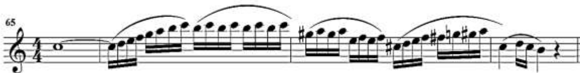
fig. 8 tomado de partituras para clarinete del concierto para clarinete y orquesta en La Mayor KV622 de Wolfgang Amadeus Mozart, edición Barënreiter.

En el compás 69 inicia una nueva frase, se sugiere que se hagan las dos primeras semicorcheas del compás ligadas y las demás separadas, además de un crescendo hacia el fa grave. Para el ataque del si agudo se sugiere que sea muy delicado y que la intención se dirija hacia el do, después de esto se deberá tener especial cuidado con las ligaduras hasta el compás 73, donde se deberían ligar las semicorcheas en grupos de ocho semicorcheas hasta llegar al final de la frase. Fig. 9