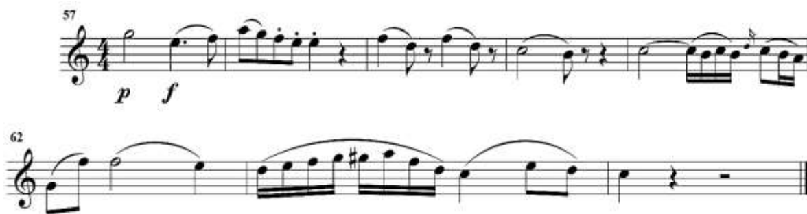
fig. 7 tomado de partituras para clarinete del concierto para clarinete y orquesta en La Mayor KV622 de Wolfgang Amadeus Mozart, edición Barënreiter.

En la frase que se observa en a fig. 8 se recomienda iniciar la redonda del compás 65 en la dinámica p y hacer un crescendo hasta el tercer tiempo del compás 66 y después realizar un pequeño disminuyendo en el tercer tiempo del compás 67 para finalmente resolver la frase. Es importante cuidar las separaciones entre cada ligadura.