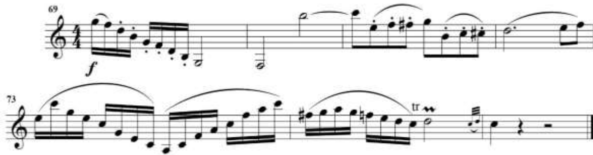
fig. 9 tomado de partituras para clarinete del concierto para clarinete y orquesta en La Mayor KV622 de Wolfgang Amadeus Mozart, edición Barärenreiter.

En el compás 78 el solista presenta un puente modulante desde la tonalidad de la menor, hasta llegar al inicio de la semicadencia en la tonalidad de mi menor en el compás 94. Fig 10.