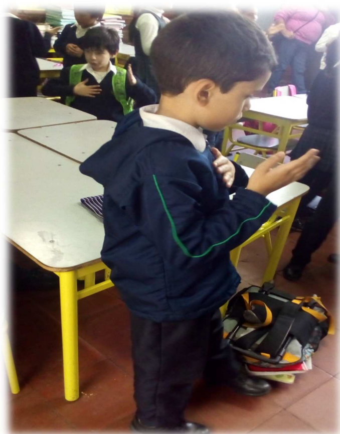
Ilustración No 5 Fase individual