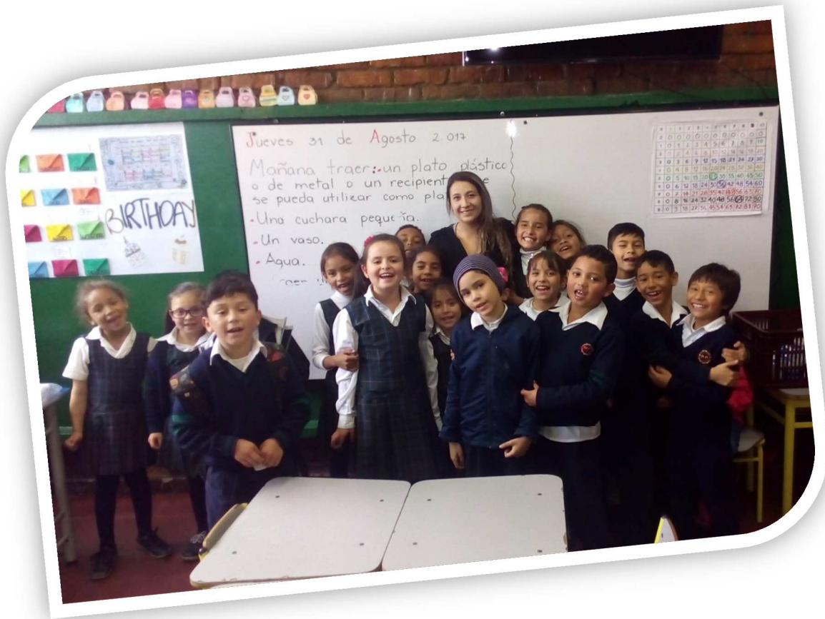
Ilustración No 3 Algunos estudiantes del Curso 202