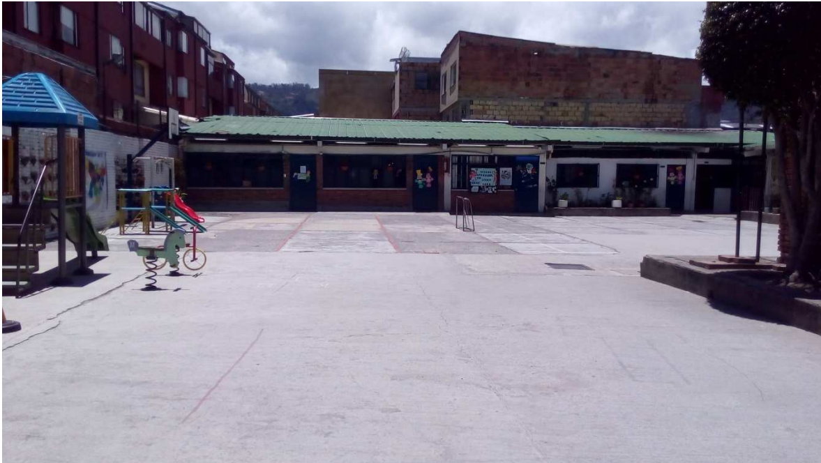
Ilustración No 2 patio sede C “orquídeas” IED Toberin

un pequeño espacio dentro de la coordinación para los instrumentos musicales y un patio relativamente amplio en donde se realizaron una buena parte de las actividades.