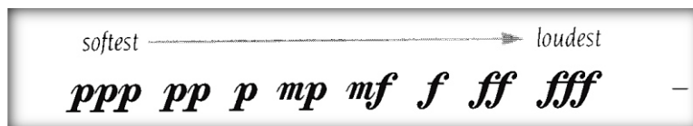
Ilustración 1 - Dinámicas comunes

Gerou & Lusk (1996) mencionan que las dinámicas más comunes de la más suave a la más fuerte con su forma de escritura son: