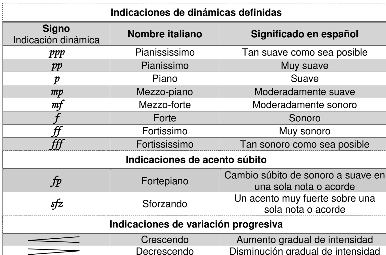
Tabla 2. Matices Dinámicos

Nota. Fuente: Adaptado de Crowter, D. (2003). Usted puede leer música . Pág. 40-41