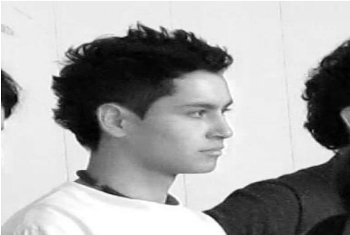
Clase 3 Cuerpo Fotograma_438