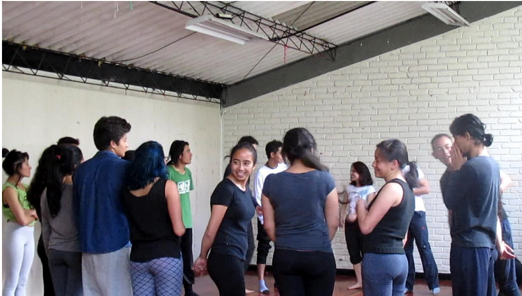
Clase Cuerpo Fotograma 0252