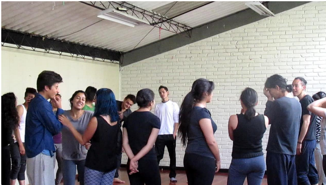
Clase Cuerpo Fotograma 0277

“[...] soy una mujer bastante, alegre, me gusta bromear mucho,... (Ríe) soy muy sensible, demasiado sensible, [...]” (8S:781).