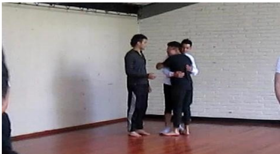
Clase 1 Cuerpo fotograma_0524