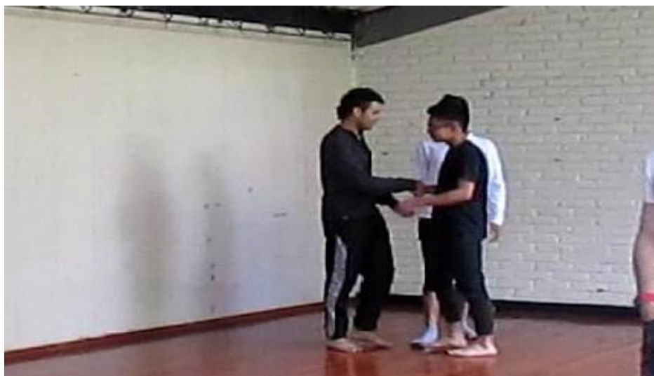
Clase 1 Cuerpo fotograma_0525