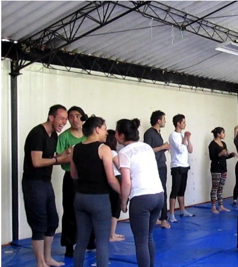
Cuerpo 1 Fotograma 1202