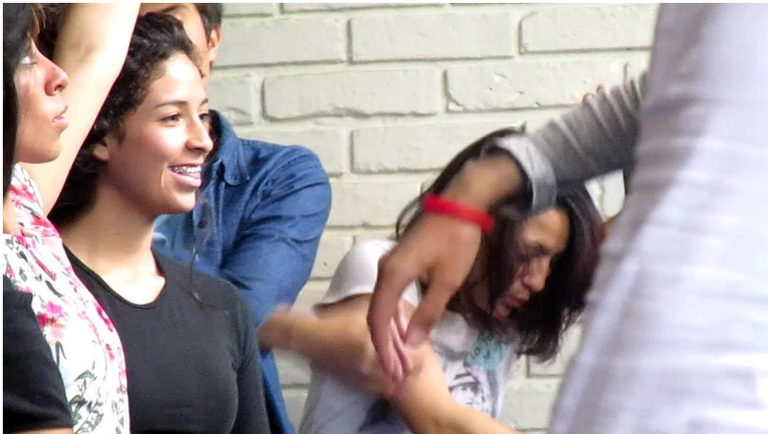
Clase 3 cuerpo Fotograma 0604