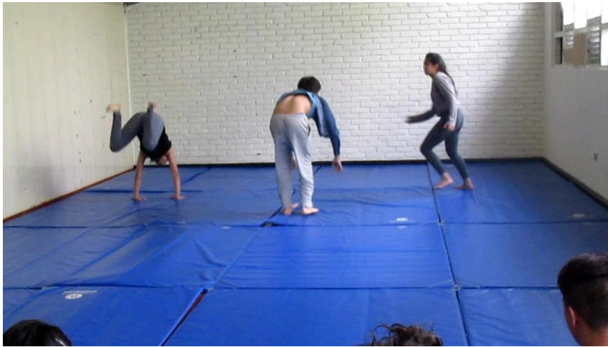
Clase 2 cuerpo Fotograma 0062