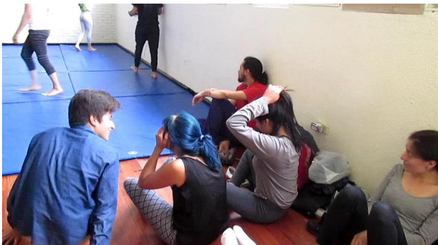
Clase 2 cuerpo Fotograma_0160