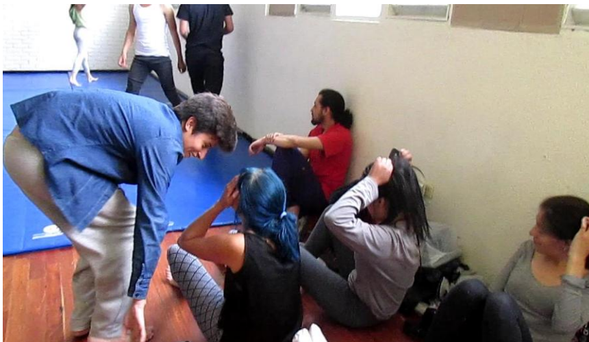
Clase 2 cuerpo Fotograma_0159