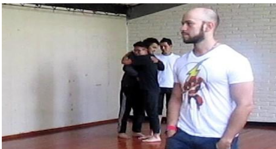
Clase 1 Cuerpo fotograma_0526