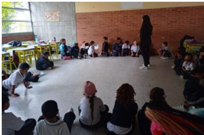
Fotografía 15. (29/04/2024) Momento de reflexión.

Al finalizar se realizan las preguntas: ¿Cómo consideran el hecho de decir mentiras?, ¿Será que por una mentira se puede crear un conflicto?, ¿Será mejor hablar directamente con las personas que tenemos problemas?, ¿Cómo se sentirán los amigos al escuchar los chismes? ¿Es importante ser respetuosos y cuidadosos cuando hablamos? Estas preguntas generan las siguientes intervenciones: 1 - “No podemos decir mentiras, ni chismes porque podemos hacer sentir mal a los demás y podemos pelear”. 2 - “Yo creo que los amigos de Nina se sienten mal porque es feo que digan esas cosas de nosotros”. 3 - “Es mejor que cuando tengamos problemas hablemos directamente con las personas”.