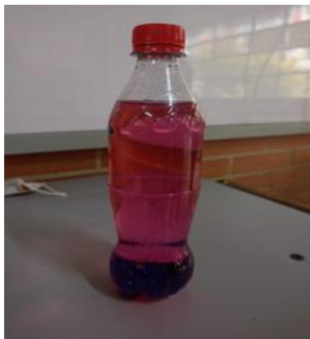
Fotografía 12. (26/04/2024) Botella de la calma.

Luego, se colocan dos canciones en diferentes momentos, una es “Música relajante” y la otra “Música fuerte o rápida”, ellos mueven las botellas al ritmo de la música y observan como la escarcha se mueve, cuando suena la música relajante lo hacen despacio y con la música fuerte las agitan rápidamente, ellos comienzan a notar que al agitarla mucho la escarcha se “enloquece” pero que si la dejan quieta se queda “tranquila” lo cual como lo mencionan brinda calma.