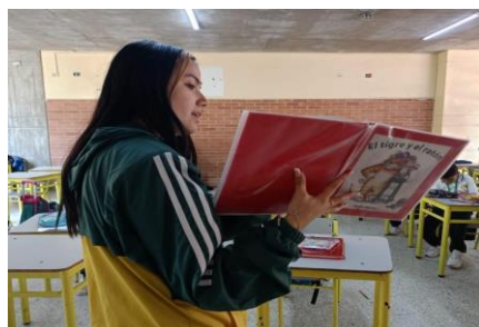
Fotografía 5. (15/04/2024) Lectura libro “El tigre y el ratón” de Keiko Kasza.

En la segunda parte de la sesión, las maestras en formación proceden a leer el cuento “El tigre y el ratón”