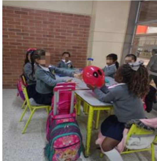
Fotografía 17. (09/05/2024) El grupo #2 interactuando con su globo enojo.

Además, procede a explicarles la dinámica: la cual se basa en escoger una tarjeta que contiene una situación cotidiana que desafía su empatía y 3 posibles opciones a escoger frente a dicha situación.