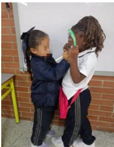
Fotografía 9. (22/04/2024) ¿Estás triste?