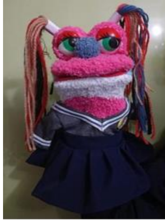
Fotografía 1. Imagen de Nina, personaje principal.

Vengo de un planeta muy lejano, “Conflictoslandia” ¿Su nombre dice algo? Pues sí, es un planeta lleno de conflictos y peleas, entonces para mí es muy normal insultar, golpear o lastimar a los demás, pues así se resuelven los conflictos en mi planeta, pero no sé si sea lo mismo en este lugar.