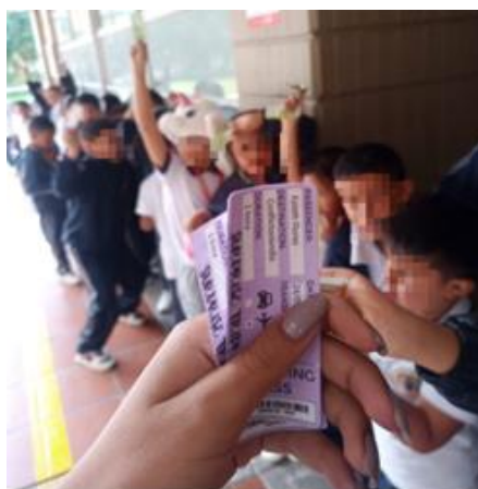
Fotografía 21. (24/05/2024) Ticket de recuerdo de la última sesión.

Se inicia la sesión a las 9:45 a.m. con la participación de 25 niños (13 niños y 12 niñas). El salón de clase está iluminado por los suaves rayos del sol que entran por la ventana, creando un ambiente cálido y acogedor. Emocionados, se agrupan en la puerta del salón a la expectativa de entrar y recibir un ticket que es el pase a sus asientos.