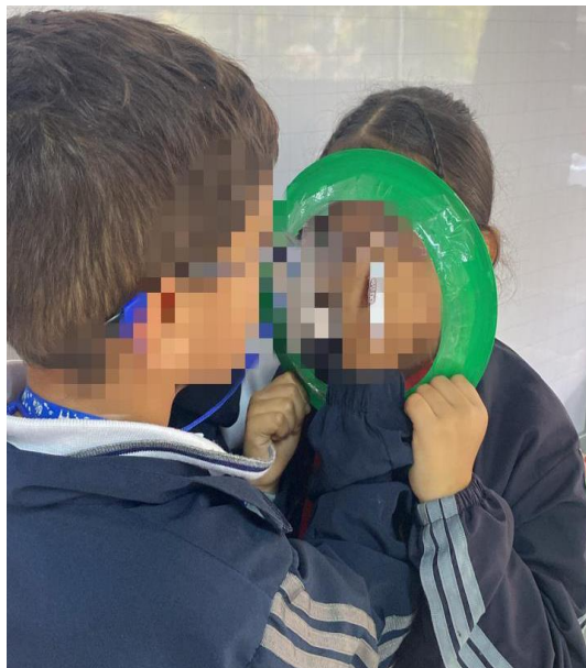
Fotografía 8. (22/04/2024) Dibujando la emoción.

presentan estas situaciones, debido al desorden o poco control que se tiene allí. Al principio se dificulta comprender lo que se está realizando, pero después de repetir las indicaciones comprenden la intención e identifican la emoción que está expresando su otro compañero, del mismo modo, comparten lo que observaban: “Profe, estoy viendo que mi compañera está enojada”