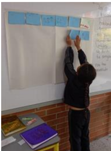
. Fotografía 24. (24/05/2024) Mural de despedida.

Los demás escuchan atentamente y aplauden al final de cada presentación.