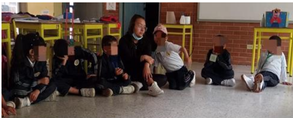
Fotografía 13. (29/04/2024) “Maestra, juega con nosotros”.

Luego de escuchar las reflexiones Nina menciona que tiene otro juego y que también quiere contar algunas cosas importantes de su planeta, para ello propone jugar “teléfono roto”, procede a mencionar el primer chisme y en algunos casos se pierde el mensaje porque algunos niños están distraídos, debido a esto las maestras en formación se integran al juego para que el mensaje avance y llegue al final.