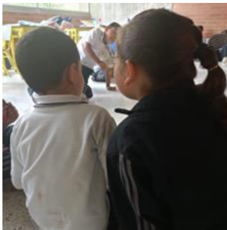
Fotografía 14. (29/04/2024) Chisme de Pepita.

Continúa la actividad y Nina menciona: “Mi amiga Pepita es muy fea” todos pasan el mensaje riendo cuando lo escuchan, al compartirlo algunos se ríen mientras que una niña se muestra molesta y dice: “No pueden decir que Pepita es fea porque no la conocemos” Se señala que eso es verdad y que ellos no pueden decir esas cosas o burlarse, porque esto puede hacer sentir mal al otro.