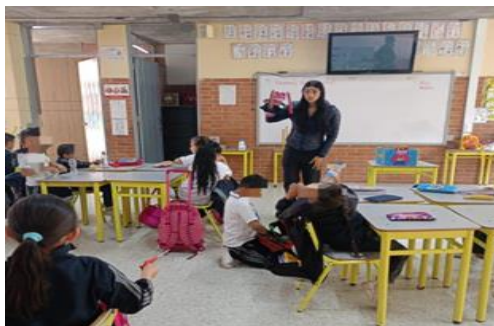
Fotografía 10. (26/04/2024) Participación.