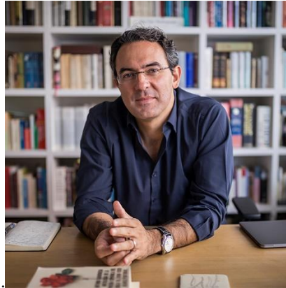
Fotografía de escritor Juan Gabriel Vásquez

Nota: fotografía perteneciente a Contextomedia.com. Recuperada de: https://contextomedia.com/juan-gabriel-vasquez-la-literatura-es-un-lugar-de-libertad-y-resistencia-contra-el-poder-politico/