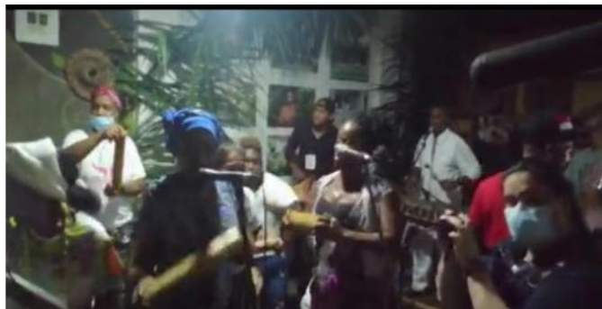
Figura 3 Mujeres cantadoras o “cantaoras” afro-pacíficas, tocando guasá.