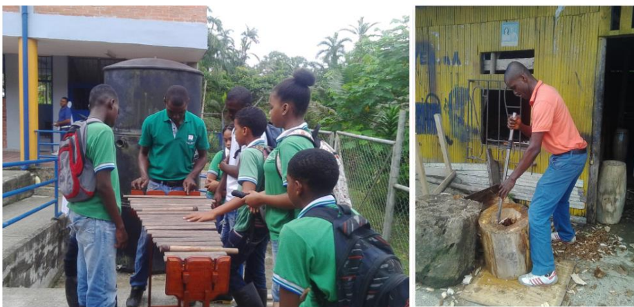
Figura 2 Enseñanza en la elaboración de la marimba