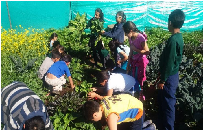
Imagen 4. Cosecha de Lechugas en la Granja.

Otra actividad que los estudiantes empezaron a realizar fue la participación en la granja, un espacio que ha tenido siempre el colegio pero que por motivos administrativos empezó a mediados del segundo semestre del año, iban todos los lunes y eran actividades como sembrar, alimentar las gallinas, recoger huevos, limpiar los gallineros entre otras.