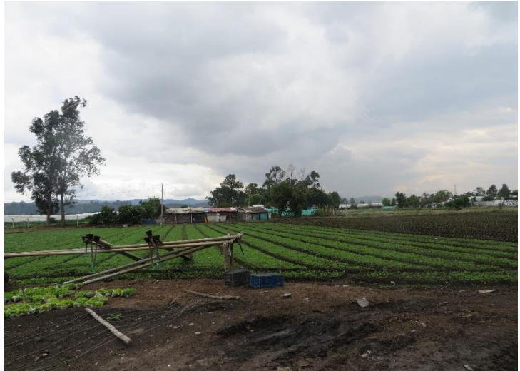
Imagen 2. Cultivo de Perejil. Sector- Chorrillos I.

Sin embargo, el problema que se ha caracterizado como eje central, es la no existencia de alcantarillado y acueducto, se conoció por fuentes del Acueducto de Bogotá, que para la empresa es imposible llevar el servicio a esa zona porque por reglamentación sólo se presta atención en el perímetro urbano. Lo que finalmente hace notable que esta vereda ha sido el retrato del descuido estatal.