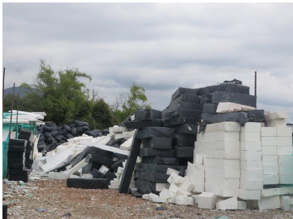
Imagen 3. Vertimiento y Almacenamiento de láminas de Icopor. Sector - Chorrillos I.

Sumado a ello (Nativa, 2014) hace referencia a que, en una esquina de la Vereda