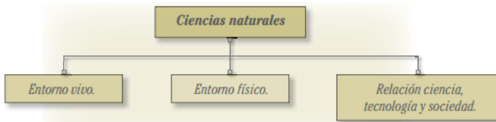
Imagen 10. Estándares básicos en competencias en Ciencias Sociales y Ciencias Naturales. Recuperado de http://www.mineducacion.gov.co/1621/articles-116042_archivo_pdf3.pdf .

En los Estándares Básicos de Competencias en Ciencias Naturales y Ciencias Sociales. Ministerio de Educación Nacional (2004) en el apartado: cómo leer los estándares de ciencias naturales, enfatiza en tres