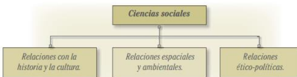
Imagen 11. Estándares básicos en competencias en Ciencias Sociales y Ciencias Naturales. Recuperado de http://www.mineducacion.gov.co/1621/articulos-116042_archivo_pdf3.pdf .

Es claro, en ese apartado ya indicado, que la interacción con los otros, no solo posibilita a los sujetos la introducción a complejos contextos sociales, sino que además intervienen fundamentalmente a retroalimentar o construir los procesos de perspectiva de mundo, su concepción de vida y lo vivo, organización de los pensamientos y acciones, y por ende de construcción de la identidad individual y social.