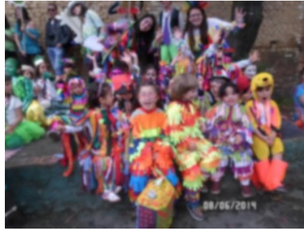
Imagen 20 Niños nivel 5 y maestra