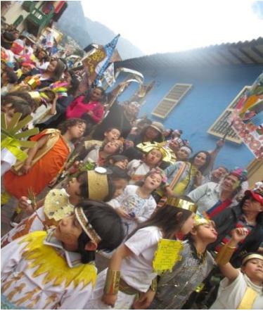
Imagen 25Circulo Hyzcaty

Estos son los diferentes rituales que el colegio trabaja de una manera articulada, y donde hay un encuentro de los diferentes lenguajes artísticos trabajados en la propuesta.