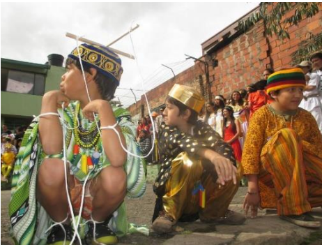
Imagen 21 Presentación circulo Hyzcaty candelaria (2015)

Gaia: mitologías (Egipto, Japón, Grecia)