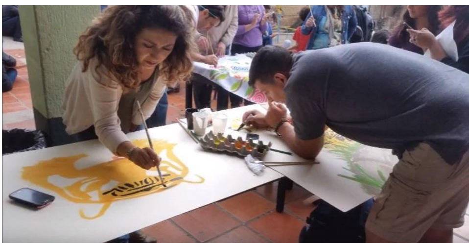
Imagen 30, taller de padres carnaval 2017

Además, dentro del carnaval se han realizado durante estos últimos 5 años algunos cambios, como lo nombra la maestra de teatro: