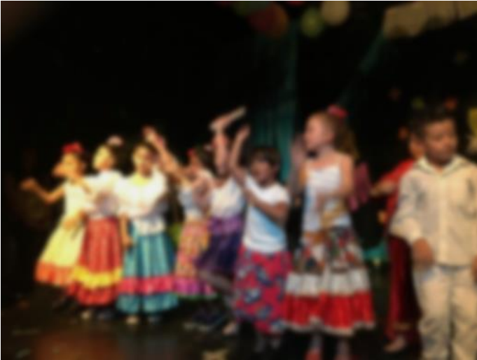
Imagen 14. Foto tomada 18 de noviembre 2017 MUESTRA FINAL nivel 6