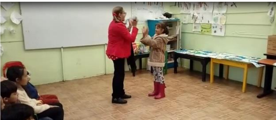
Imagen 10 juego de rima 2018