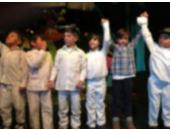
Imagen 16. Foto tomada 18 de noviembre 2017 nivel 6