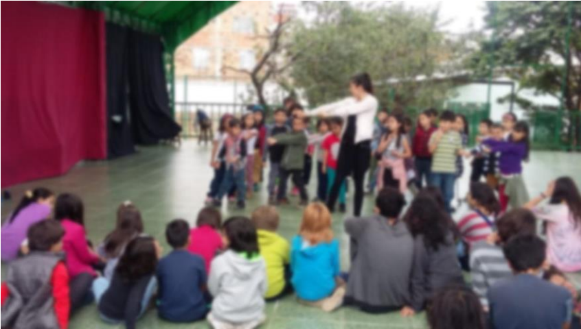
danzas nivel 6