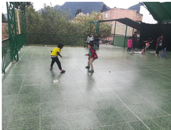
Imagen 5. El Olimpo Foto tomada mayo 31 del 2018 Imagen 6. Foto tomada 31 de mayo 2018

También se encuentra un lugar nuevo para los niños este año, un lugar donde hay un encuentro con los diferentes saberes de la institución, un sitio al que los niños le colocaron como nombre “OLIMPO”, este nombre hace referencia a la montaña más alta de Grecia, y como lo indica su nombre, es el lugar más alto del colegio, es un lugar que sirve para realizar las clases de danzas y teatro, y como escenario para las diferentes muestras o rituales que tiene la institución.