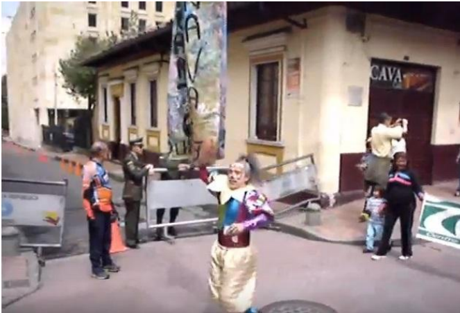
Imagen 31, carnaval 2013

un armazón de carnaval, que sea para calle porque se realizaban presentaciones de 8 am a 5 pm, donde se presentaban las cuatro áreas, entonces se apuesta a la presentación en calle, que sea coreografía de baile para calle, teatro para calle, entonces toda esa puesta en escena sea el fundamento del carnaval. Las cosas visuales, los elementos plásticos que sean grandes, que sean vistosos, que sean llamativos, que sean fáciles de cargar, en eso creo que hemos ganado bastante". (Profesora de teatro, comunicación personal, 15 Agosto del 2018)