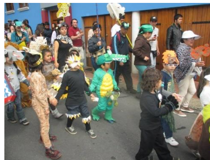
Imagen 22 recorrido por la