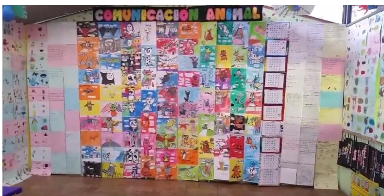
Imagen 32 , tiva nivel 6

Es importante señalar, que el trabajo de los lenguajes artísticos en el CEL, no está delegado solamente al cuerpo de maestros de arte, sino que también los maestros del círculo Hyzcaty deben incorporarse a ese trabajo, los lenguajes artísticos deben ser fundamentales en el trabajo de un maestro y además permitirán que ellos se puedan sensibilizar con el arte al igual que los niños y las niñas.