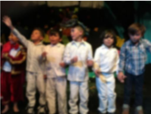
Imagen 15. Foto tomada 18 de noviembre 2017 nivel 6