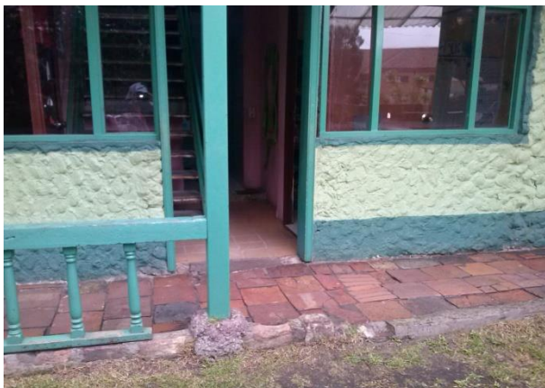
Imagen 3. Tiva de nivel 5 Foto tomada

Al lado de “ siempre verde ” se encuentra ubicada la tiva (salón de clase) del nivel 5 (transición), con un baño para los niños, este lugar es conocido como “ la casita de colores ” y al frente está un parque llamado “ estrellita ”, que es utilizado por los niños de nivel 5 en la hora del descanso.