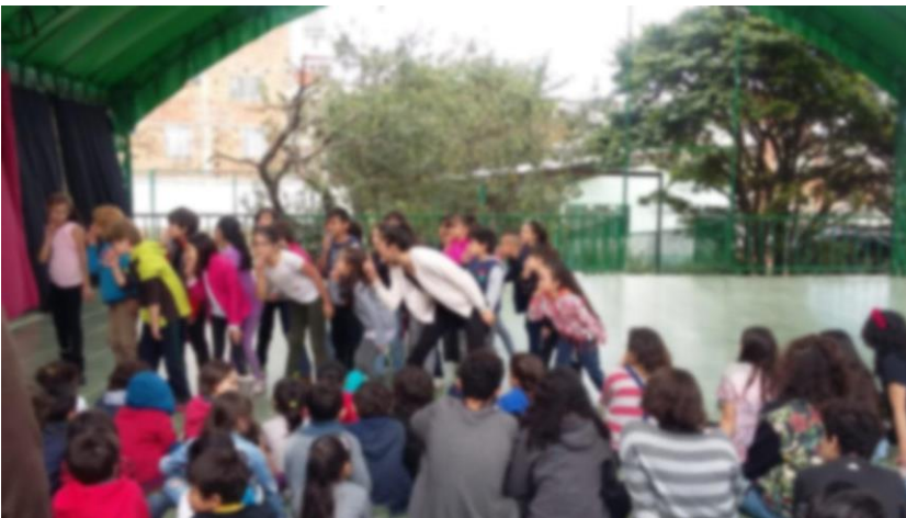
danzas nivel 9