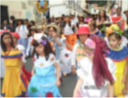
Imagen 19 Niños nivel 7 (2014)