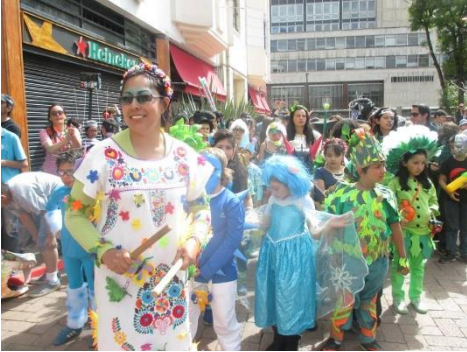
Imagen 23 Recorrido por candelaria circulo Hyzcaty

Es aquí donde se acude al carnaval para plantear diferentes momentos, desde la majestuosidad de la naturaleza, pasando por lo que está consumiendo a la tierra, hasta llegar al apocalipsis futurista donde las maquinas se apoderan del mundo y solo nos queda volver a nuestros ancestros. Este carnaval refleja una crítica frente a las problemáticas ambientales que se están viviendo.