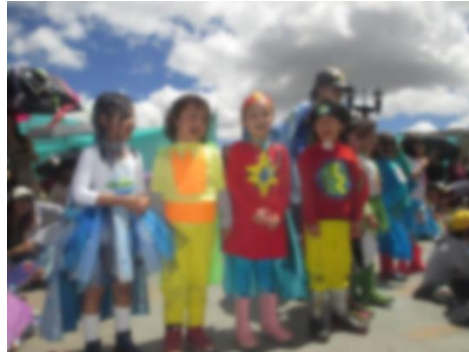
Imagen 24 presentaciones