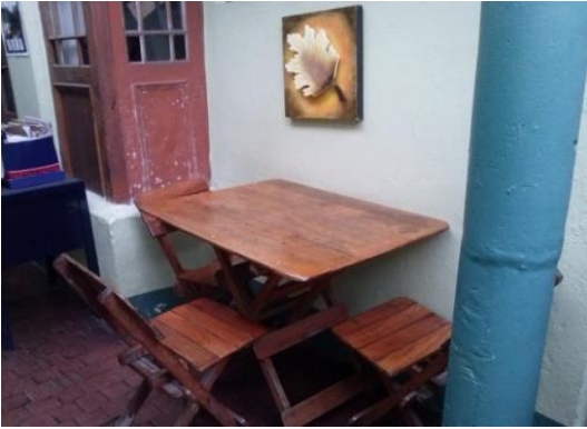
Imagen 1. El tertuliadero. Foto tomada el 15