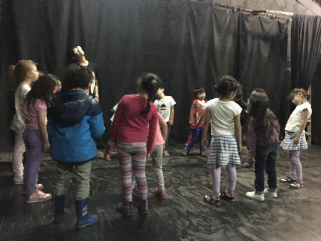
Imagen 13. Foto tomada 07 de junio