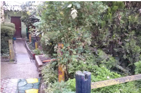
Imagen 2 siempre verde Foto tomada el 15 de marzo 2018

Más adelante se encuentra un espacio, donde se han ubicado algunas mesas y sillas, que es utilizado para reuniones, tanto de maestros con padres de familia, estudiantes, maestros en formación. Este sitio es llamado “el tertuliadero”, este lugar, como se mencionó anteriormente que los niños puedan tener un sitio en el cual puedan conversar y llegar a acuerdos con los maestros y padres de familia y sientan un ambiente de tranquilidad y privacidad.