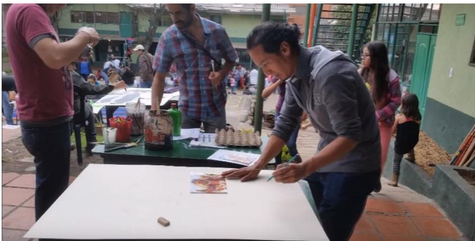
Imagen 29, taller de padres carnaval 2017