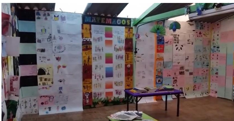
Imagen 33 , tiva nivel 6

(trabajos realizados con la maestra del círculo)