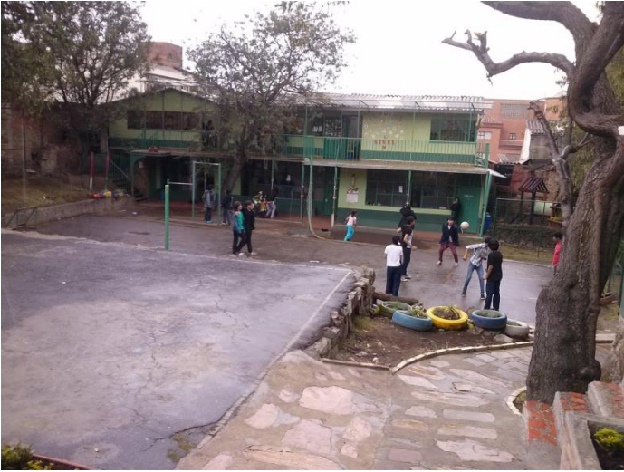
Imagen 4.cancha negra Foto