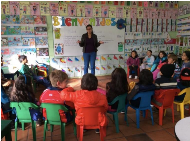
Imagen 7 Tiva del nivel 7 (salón de