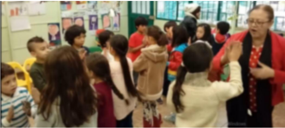
Imagen 9 juegos de rima 2018