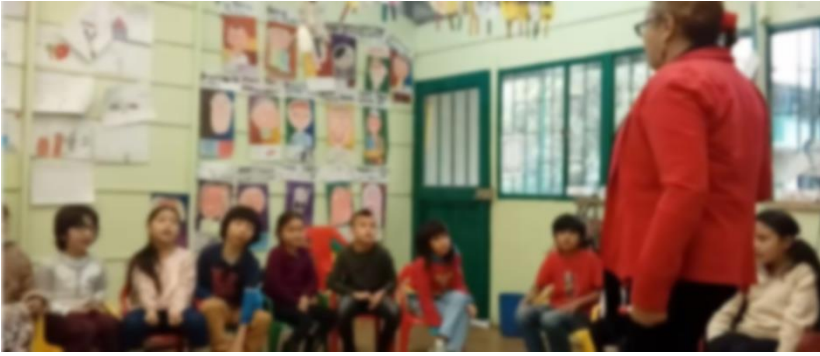
Imagen 8 momentos