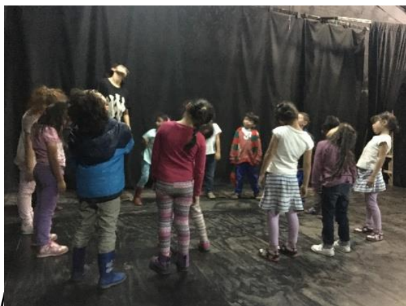
Imagen 12.. Foto tomada 07 de junio