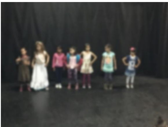
Imagen 11 foto tomada 07 de junio 2018

Requiere entonces recoger los contenidos curriculares? y ponerlos en escena sin el compromiso de obras terminadas sino con el compromiso de contagiar a la comunidad académica del CEL de sus logros (LAMBULEY, 2004)