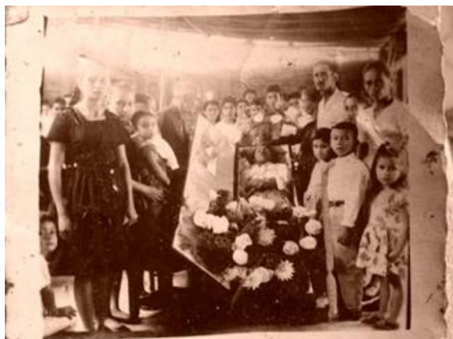
Imagen 6. Velorio.

mujer, pues eran ellas –en la mayoría de los casos- quienes realizaban los diferentes medicamentos, bebedizos y quienes asumían la labor de parteras. De ahí que el papel que desempeña la mujer sea significativo porque se le otorgaba la labor de mantener el orden de las cuestiones sociales y de salubridad.