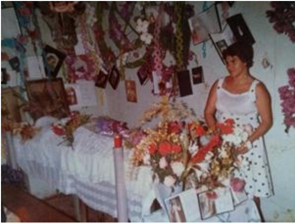
Imagen 7. Velorio.

Ahí en la casa misma se celebraban tres días y eso era toda la noche, daban chocolate, rezando y todo, toda la noche todo el día y daban comida y las nueve noches era mejor porque usted todas las noches cena y en las nueve noches la última noche todo se rezaba y a las 5 de la mañana a la aurora todos cantaban, ahora eso si acaso dejan hacer la novena.