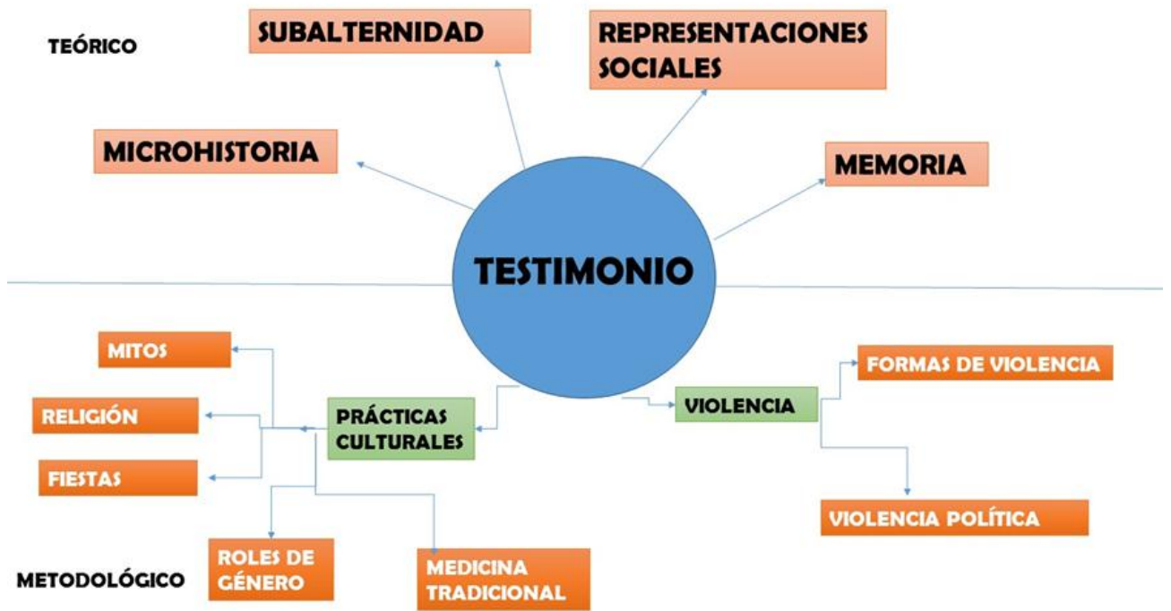
Gráfica 1. El Testimonio.