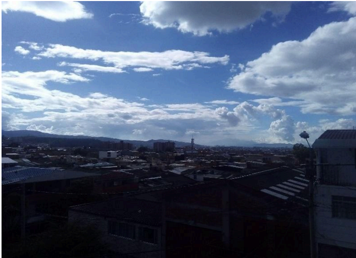
Figura 10. Fotografía azotea, casa señora María