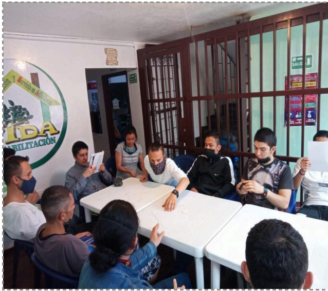
Figura 8. Espacio de trabajo-26 de febrero