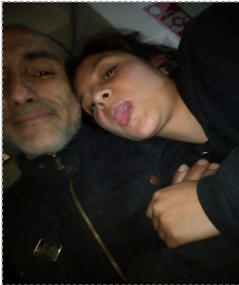
Figura 9.

10 marzo. Anatomía De Una Madre Ausente.