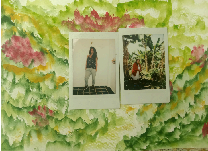
Figura 5. Pintura Geraldine Casallas-Floreciendo