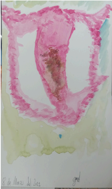
Figura 4. La mujer rota