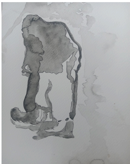
Figura 3. Esbozo