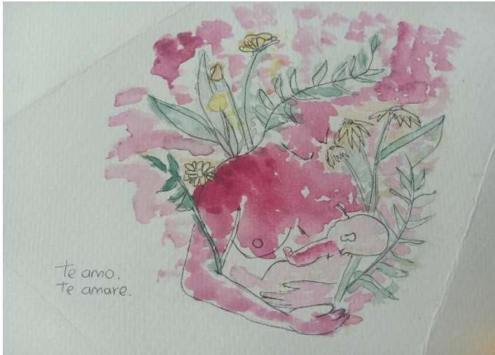
Figura 11. Pintura técnica acuarela: Después de mi primer aborto (2020).