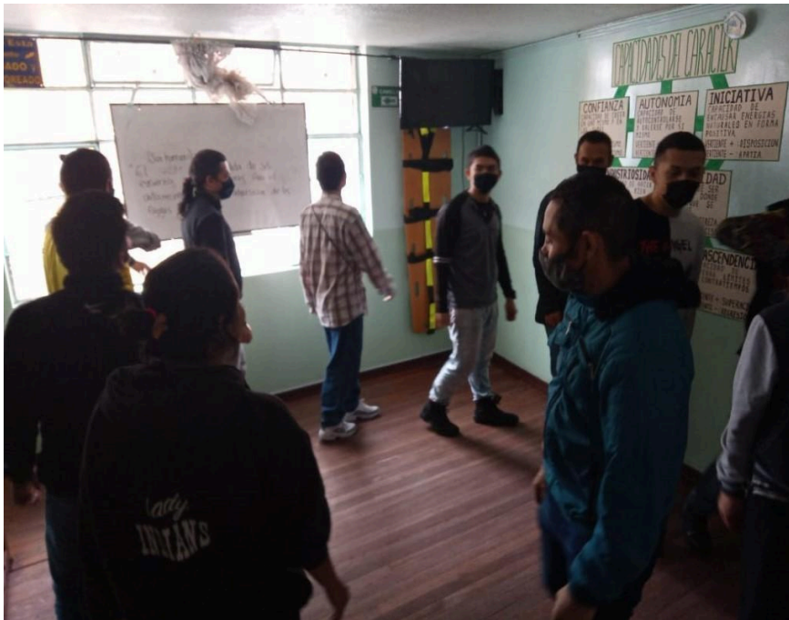
Figura 7. Espacio de trabajo, 19 de febrero