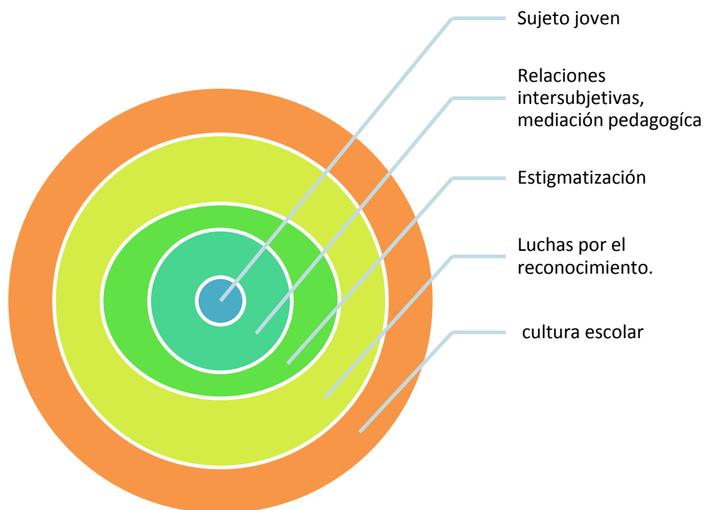
Ilustración 1 Esquema Modelo analítico