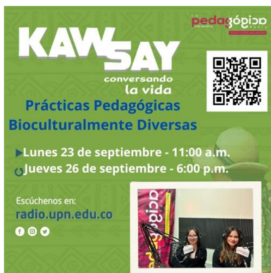
Figura 14. Participación en la Emisora Pedagógica Radio. Registro propio 2024.

desde y para los contextos diversos, profundizando en la mirada del maestro y la maestra de biología como investigadores investigadora(or) de su propia práctica. Así mismo que de los principales aportes, retos, oportunidades desde las experiencias de práctica en la formación de maestros en el país desde su condición bioculturalmente diversa. El programa radial esta disponible en el siguiente enlace: https://www.ivoox.com/practicas-pedagogicas-bioculturalmente-diversas-audios-mp3_rf_134389994_1.html (Pedagógica Radio, 2024).