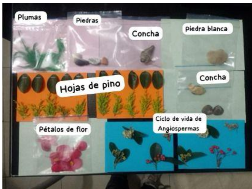
Figura 6. Materiales de la segunda actividad didáctica.

Para indagar las concepciones acerca de ¿cómo se siente la vida? se empleó un formulario con las siguientes preguntas orientadoras, las cuales fueron respondidas por parte de los estudiantes a partir del objeto que más les causo interés: