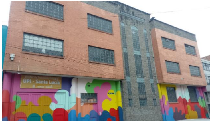
Figura 3. UPI casa de acogida Santa Lucia (registro propio, abril, 2023).

Los estratos socioeconómicos de los y las estudiantes varían desde sin estratificar hasta los estratos 1 y 2. Con respecto a las localidades que habitan los estudiantes, la mayoría proviene de la localidad de Rafael Uribe Uribe, Usme y algunos otros habitan en otras localidades como Bosa, Suba y el municipio de Soacha.