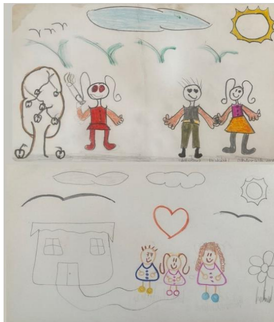
Figura 9. Ilustración sobre la vida representada en la familia. Registro propio 2023.

Dentro de las diferentes concepciones de ¿cómo se ve la vida? también se destaca que la vida se puede representar desde la familia y la coexistencia con el otro (Figura 12).