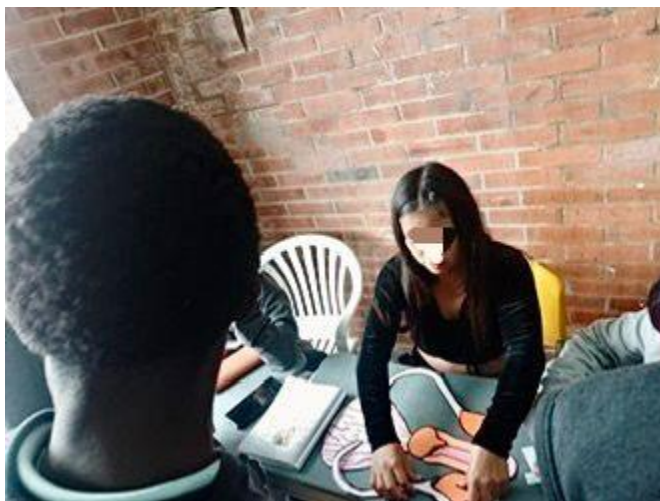
Figura 10. Taller enfocado en el reconocimiento de los sistemas reproductivos humanos.

La quinta guía didáctica centrada en la piel del hogar, se tituló: taller olfativo: ¿Cómo se percibe la vida?, se desarrolló el 19 de octubre del año 2023 con el grado octavo en los grupos a y c, ya que, por dinámicas institucionales los estudiantes de octavo fueron divididos entre dos cursos, la actividad tuvo como objetivo reconocer los aromas de la vida y lo vivo a través de expresiones artísticas a manera de taller, para este, se emplearon diferentes muestras olfativas de hierbas aromáticas como tomillo, laurel, cilantro, entre otras, complementario a la actividad se formularon preguntas orientadoras para identificar las apreciaciones de los estudiantes sobre la experiencia, en relación con la pregunta ¿Cómo lo describes?, describieron los aromas de diversas maneras: