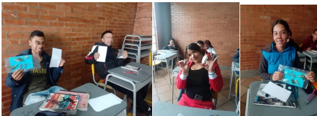
Figura 7. Socialización de saberes con los estudiantes.

Acorde con lo anterior se puede inferir, los estudiantes conciben la vida asociada a la interacción con el entorno natural, al finalizar la actividad se socializaron y diálogo acerca de las respuestas de los estudiantes (Figura 7).