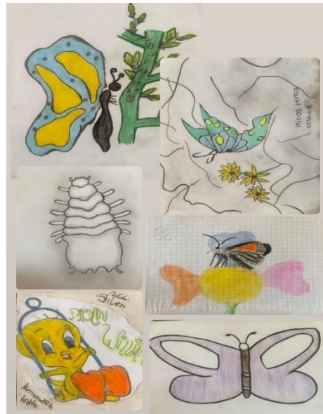
Figura 6. Ilustración sobre la vida representada en la naturaleza. Registro propio 2023.

La vida se ve representada en los diferentes organismos de la naturaleza (Figura 9):