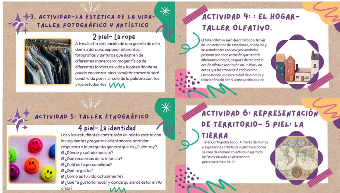
Figura 5. Socialización de la propuesta del proyecto de práctica.

La segunda guía didáctica se tituló: Epidermis-Concepciones sobre la vida y lo vivo ; la cual se realizó el 05 de septiembre del año 2023 implementada junto con los estudiantes y el profesor titular en el área de Ciencias Naturales en los grupos a, b y c del grado octavo, la cual tuvo el objetivo, indagar las concepciones de las(os) estudiantes acerca de la vida y lo vivo y sobre la naturaleza para el reconocimiento de sus diferentes contextos socioculturales y experiencias de vida. La actividad se realizó a través de un taller sensitivo a partir del tacto, donde ellos expresaron ideas sobre lo que ellos percibían a través del palpar con sus manos (la epidermis) las diferentes texturas que pueden encontrar en la naturaleza, como las hojas de una planta, el tronco de un árbol, la piel de un animal y diferentes texturas de suelo. (Figura 6).