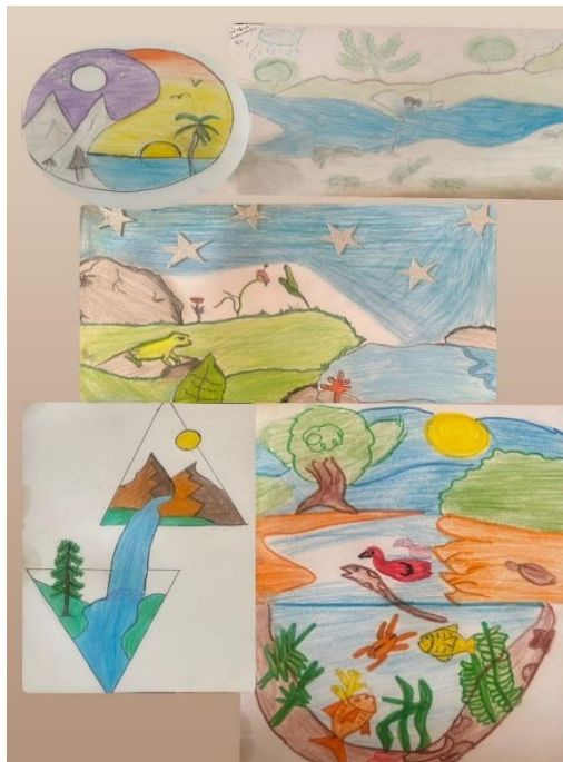
Figura 7. Ilustración sobre la vida representada en los ecosistemas. Registro propio 2023.

La vida se distingue en los ecosistemas conformados por los diversos factores bióticos y abióticos y el principio de interdependencia (Figura 10).