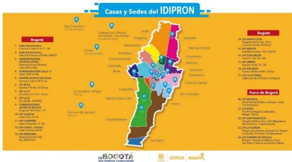
Figura 1. Mapa de localización de las UPI del IDIPRON.

El proyecto de investigación educativa se desarrolló específicamente dentro de la UPI (Unidad de protección integral) Casa de Cuidado Santa Lucía del IDIPRON. Que se encuentra en el sector centro-oriental de Bogotá.