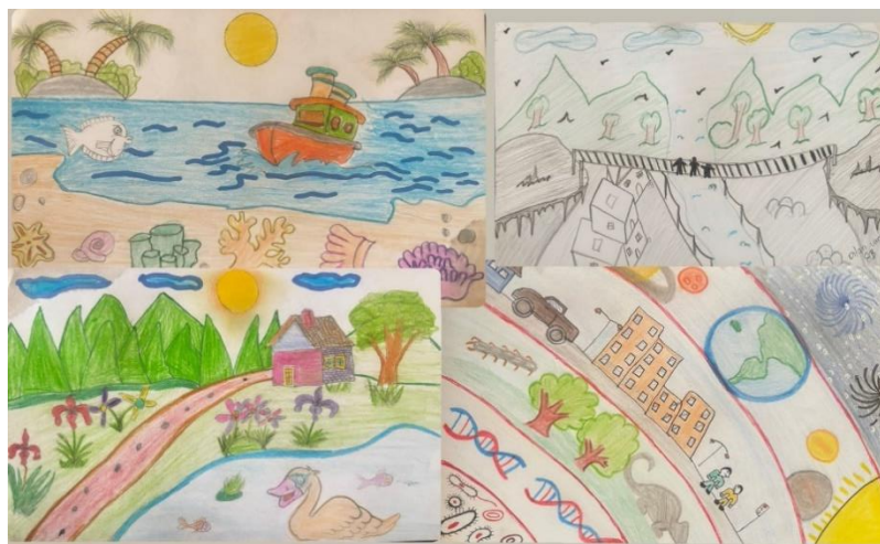
Figura 8. Ilustración sobre la vida representada en la relación humano y naturaleza. Registro propio 2023.

Se evidencia la intervención antropocéntrica dentro de la naturaleza, el paisaje y la relación humano-naturaleza (Figura 11).