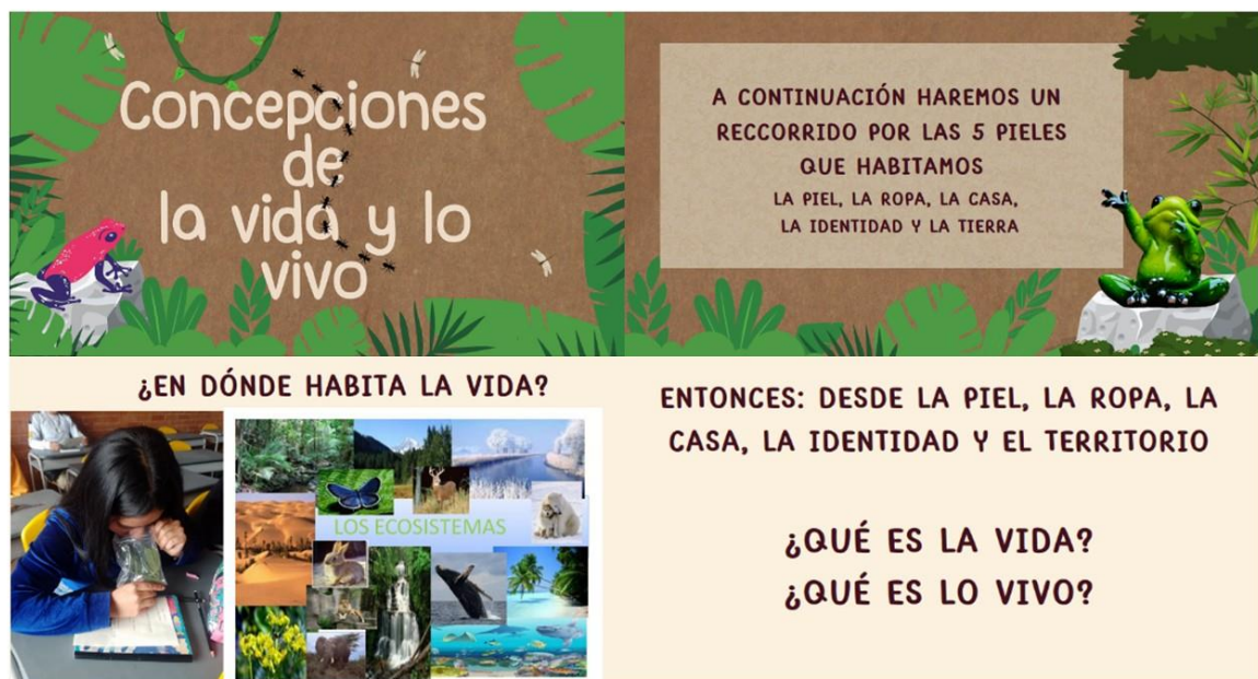
Figura 13. Presentación de la séptima actividad didáctica. Registro propio 2023.

Finalmente, para la séptima guía didáctica se realizó una única sesión en conjunto con los cursos octavo a y c, el día 14 de noviembre del año 2023, donde a través de una presentación de diapositivas se socializaron las experiencias y resultados y aprendizajes durante el desarrollo de la práctica pedagógica liderada por la maestra en formación en donde se presentaron los diferentes momentos y actividades de la práctica (figura 16).