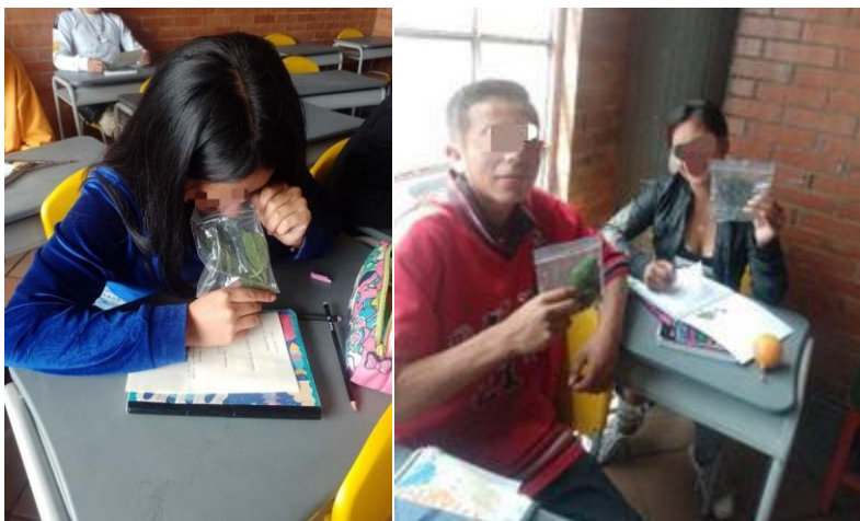
Figura 11. Taller olfativo. Registro propio 2023.

Para la guía didáctica seis enfocada en la piel de la Tierra, se planteó un taller titulado Cartografía Social ¿Dónde habitas tu vida? tuvo lugar el 02 de noviembre del año 2023 en los cursos octavo a y c, se realizó un ejercicio cartográfico con el objetivo de permitir a los estudiantes representar sus experiencias y percepciones sobre su entorno. Buscando fomentar la participación de los estudiantes, el trabajo en grupo e involucrándolos en el proceso de ejercicio cartográfico.