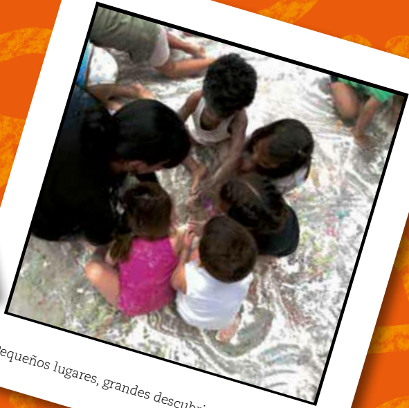
Pequeños lugares, grandes descubrimientos (2013)