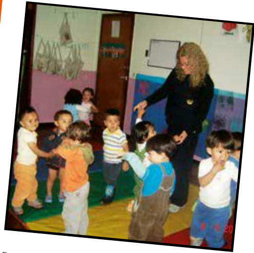
Estrechar vínculos desde nuestro cuerpo