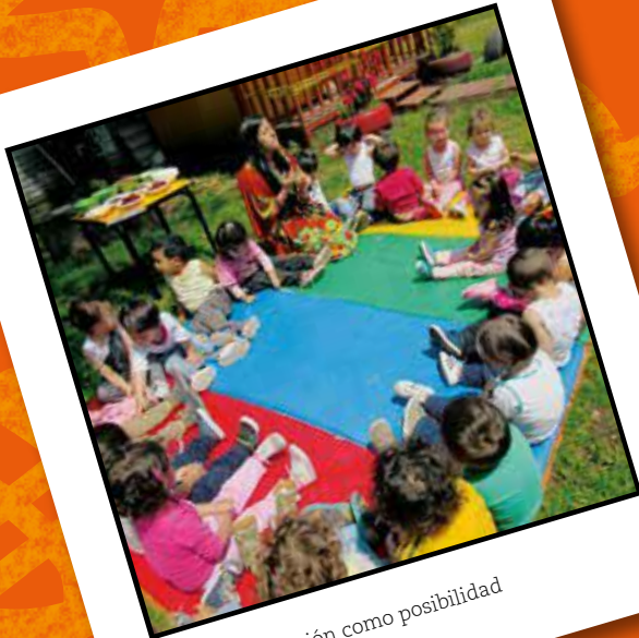
La personificación como posibilidad de vivir experiencias