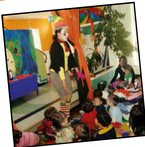
El arte y sus múltiples interacciones como posibilidad de potenciar la imaginación y la creatividad