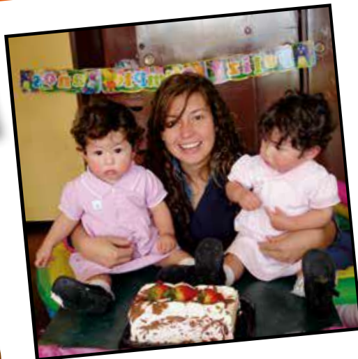
Maestras que acompañan con brazos abiertos