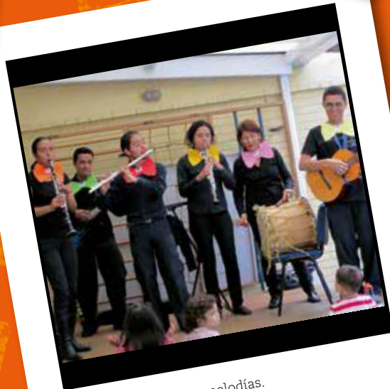
Disfrutar de diversas melodías. Licenciatura en Música (2011)