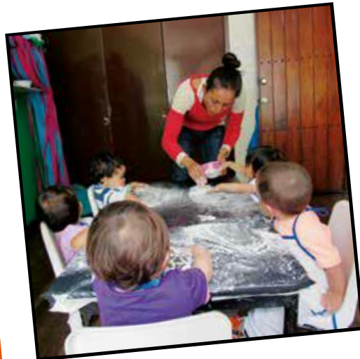
Experiencia de exploración. Licenciatura en Educación Infantil (2015)