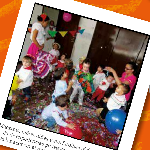
Maestras, niños, niñas y sus familias disfrutaron día a día de experiencias pedagógicas significativas que los acercan al mundo físico, social y cultural