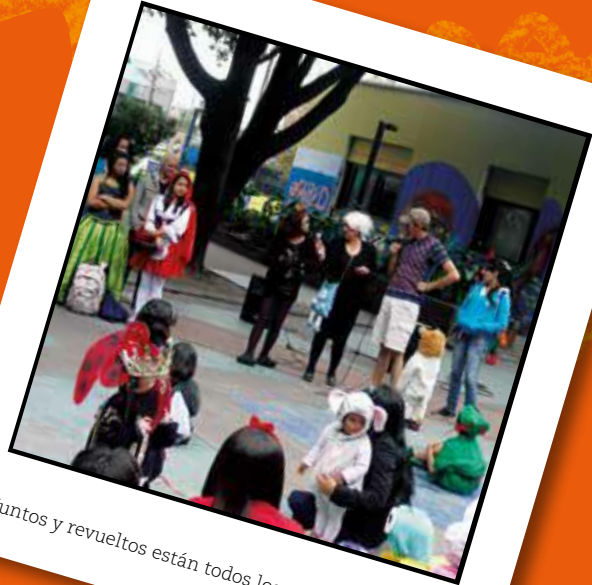
Juntos y revueltos están todos los cuentos (2015)