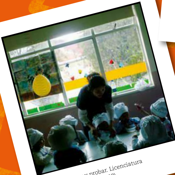
Amasar, amasar y probar. Licenciatura en Educación Infantil (2009)