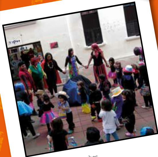
Pintar el mundo de muchos colores y emociones (2016)