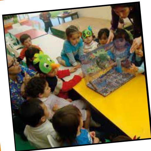
Entre coloridas plumas y un pico, un amigo los niños conocieron (2014)