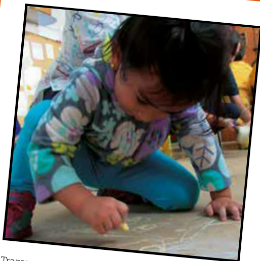
Trazar caminos de colores, dar vida a la fantasía (2016)