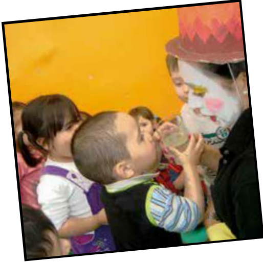
Un sorbo de magia y fantasía (2014)