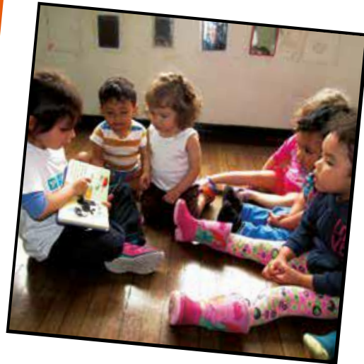
La sinergia de mundos, lecturas e historias (2017)