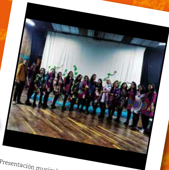
Presentación musical, sonidos del corazón (2018)