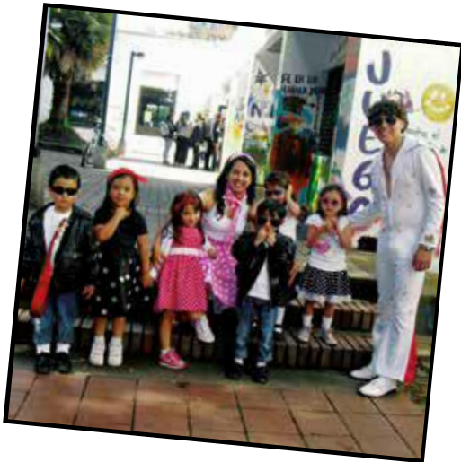
Viaje a través del tiempo (2014)