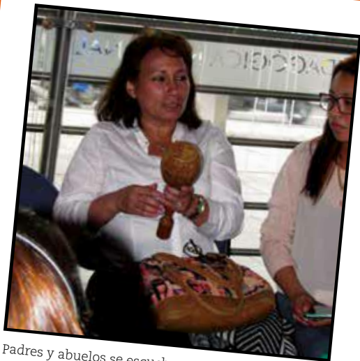
Padres y abuelos se escuchan entre sí para enlazar una suerte de tejido, con encuentros y distancias propias de la rica y compleja diversidad social y cultural