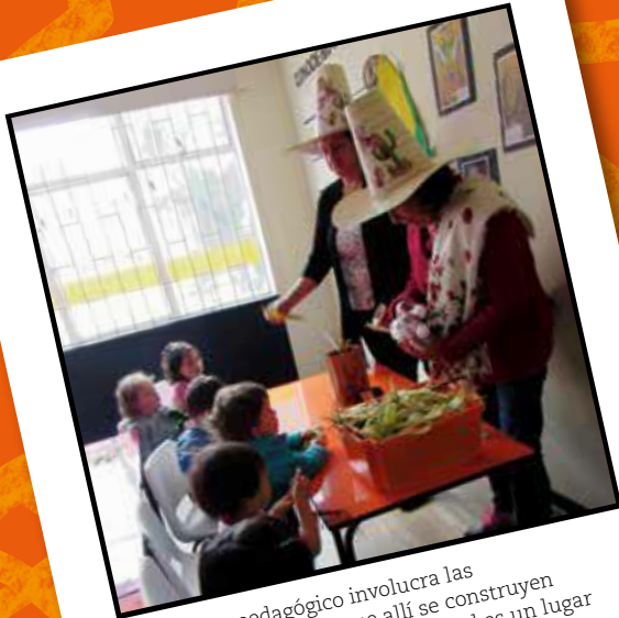
El proyecto pedagógico involucra las familias y los saberes que allí se construyen culturalmente. La Escuela Maternal es un lugar para escuchar, ser escuchado y compartir