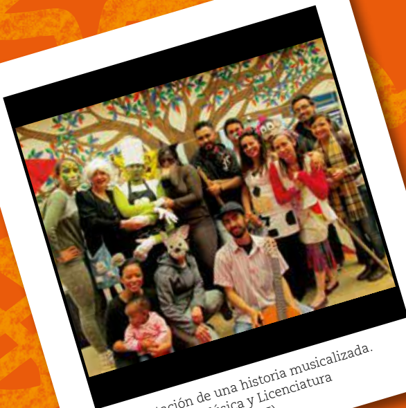
Representación de una historia musicalizada. Licenciatura en Música y Licenciatura en Educación Infantil (2015)