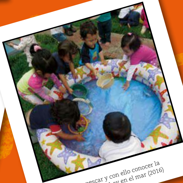
Aprendimos a pescar y con ello conocer la variedad de peces que hay en el mar (2016)