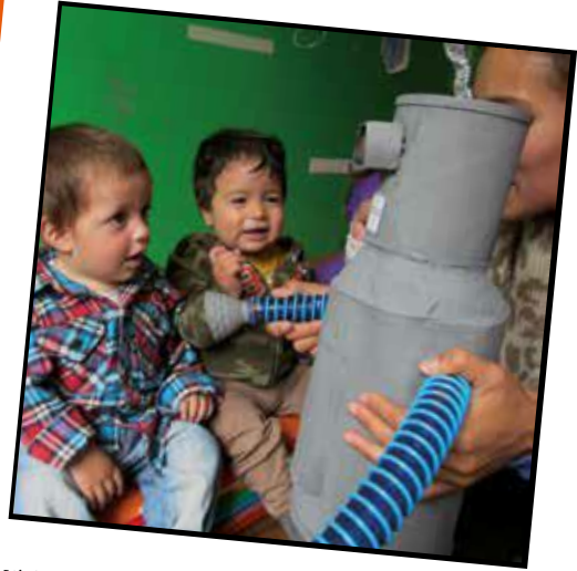
Visitas inesperadas (2015)