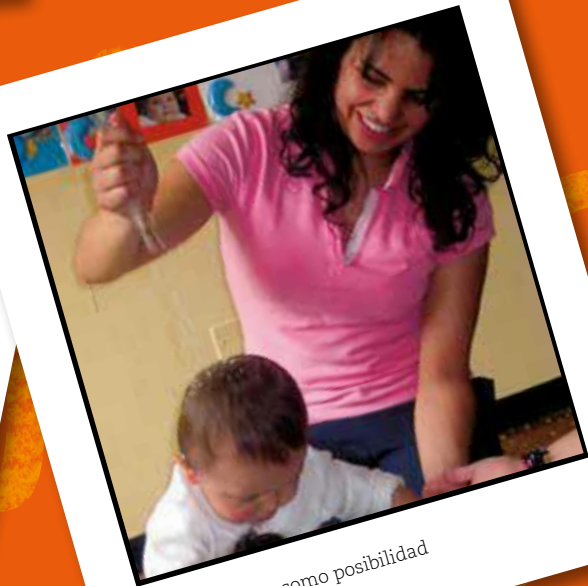
La exploración como posibilidad de conocer el entorno