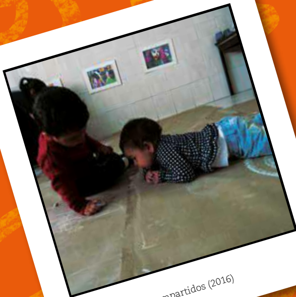
Dibujar mundos compartidos (2016)