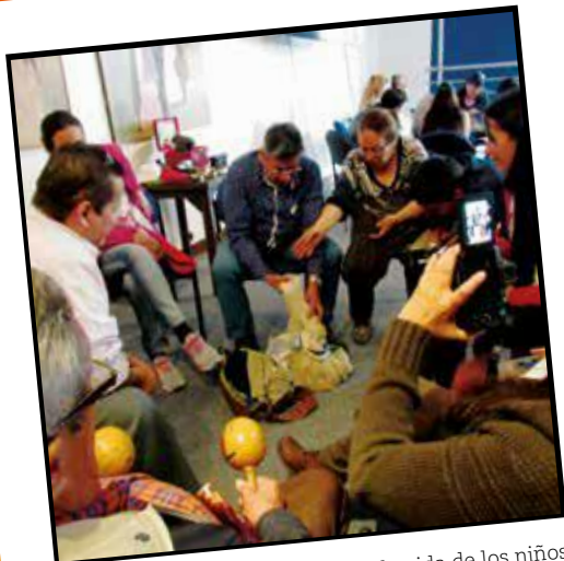
Como actores fundamentales en la vida de los niños y las niñas, los abuelos tienen voz en la Escuela Maternal para reconocer su experiencia de vida