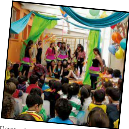
El circo en la Escuela Maternal. Licenciatura en Educación Infantil (2015)