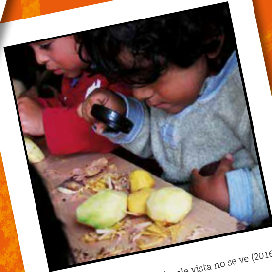
Descubrir aquello que a simple vista no se ve (2016)