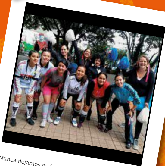
Nunca dejamos de jugar, aprendemos jugando