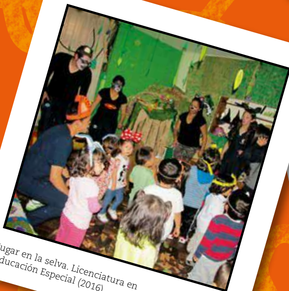
Jugar en la selva. Licenciatura en Educación Especial (2016)