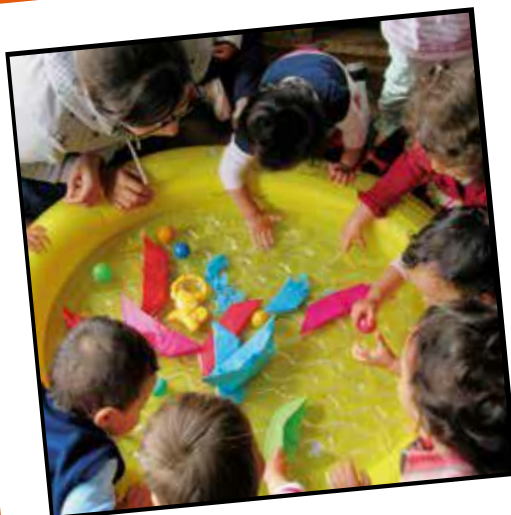
Había una vez... muchos barcos chiquiticos que querían navegar (2016)