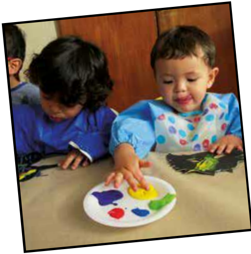
Colores que dan vida (2016)