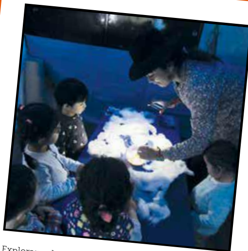
Explorar y descubrir la luz. Licenciatura en Educación Infantil (2018)