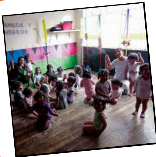
Celebrar nuestra cultura (2019)