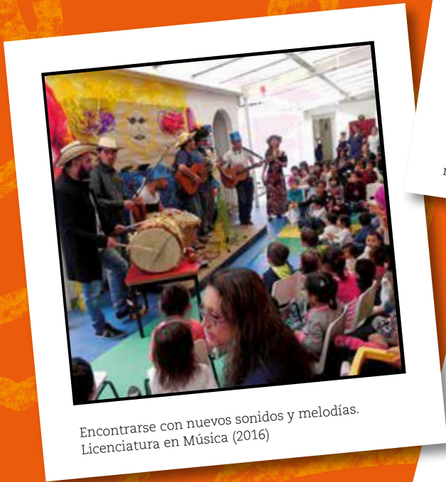
Encontrarse con nuevos sonidos y melodías. Licenciatura en Música (2016)