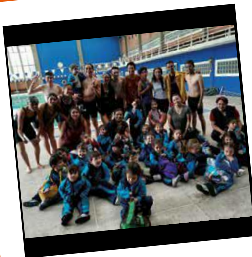
Compartir, aprender y dejar huella en otros. Licenciatura en Educación Física y Deporte (2019)