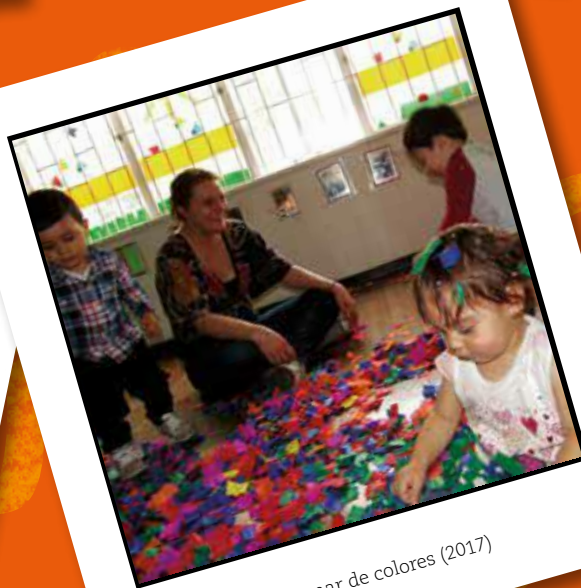
Sumergirse en un mar de colores (2017)