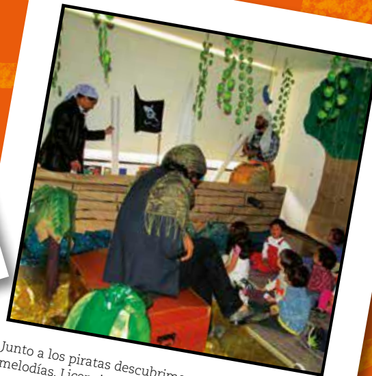
Junto a los piratas descubrimos nuevas melodías. Licenciatura en Música (2016)