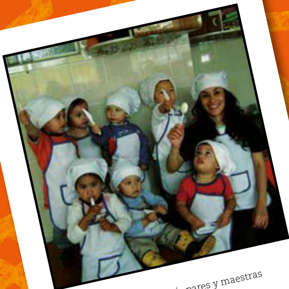
Construyo, exploro con mis pares y maestras