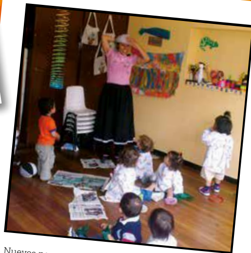
Nuevos personajes, nuevas historias. Licenciatura en Educación Infantil (2009)