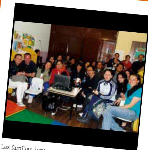
Las familias, junto con la maestra, se consolidan como un equipo que se moviliza a favor de las necesidades de los niños y las niñas