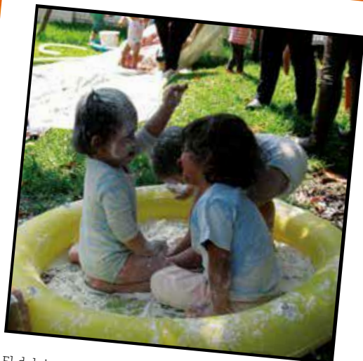
El deleite, la alegría y el disfrute que emergen a la hora de jugar (2016)