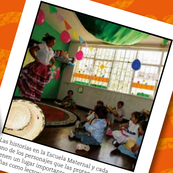
Las historias en la Escuela Maternal y cada uno de los personajes que las protagonizan tienen un lugar importante en los niños y las niñas como lectores del mundo y la palabra