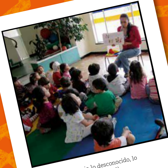
Abrir la puerta hacia lo desconocido, lo mágico y lo sorprendente (2011)