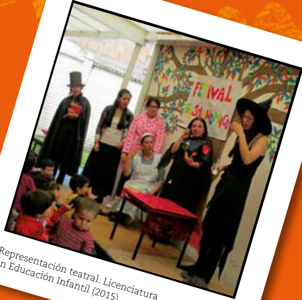
Representación teatral. Licenciatura en Educación Infantil (2015)