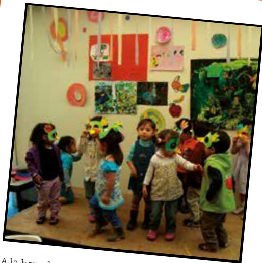
A la hora de explorar, las alas debemos desplegar (2014)