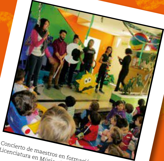
Concierto de maestros en formación. Licenciatura en Música (2017)