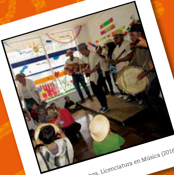
Al ritmo de carranga. Licenciatura en Música (2016)