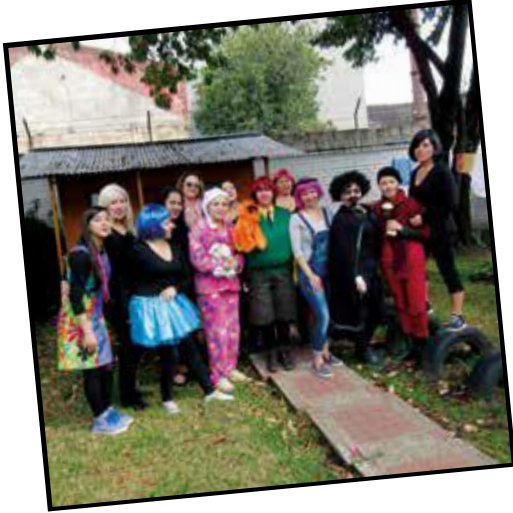
El trabajo colectivo y sus múltiples lenguajes