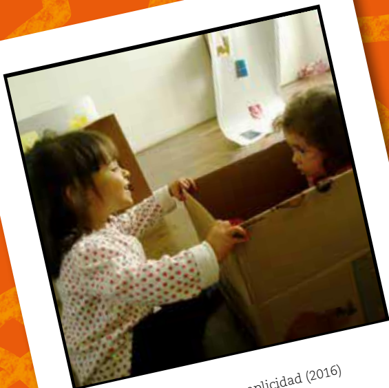
Miradas de encuentro y complicidad (2016)