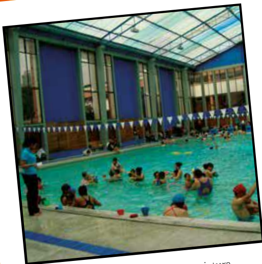
Proyecto "Mi cuerpo en el agua". Licenciatura en Educación Física y Deporte (2011)