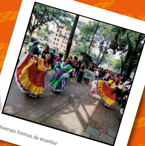
Diversas formas de enseñar