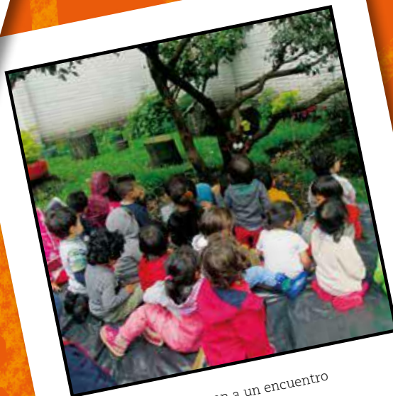
Indagaciones que llevan a un encuentro con lo sorprendente (2019)