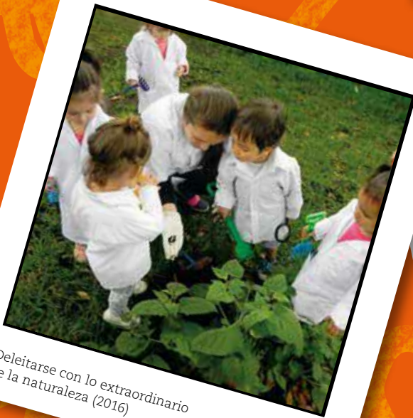
Deleitarse con lo extraordinario de la naturaleza (2016)