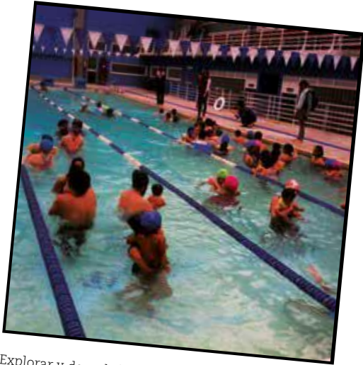
Explorar y descubrir las destrezas del cuerpo. Licenciatura en Educación Física y Deporte (2013)