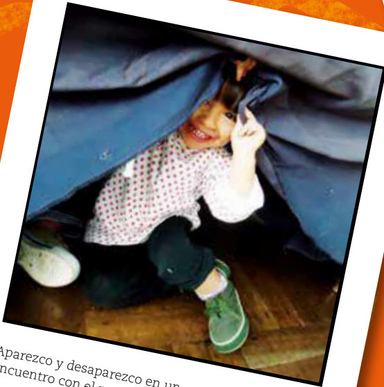
Aparezco y desaparezco en un encuentro con el mundo (2016)