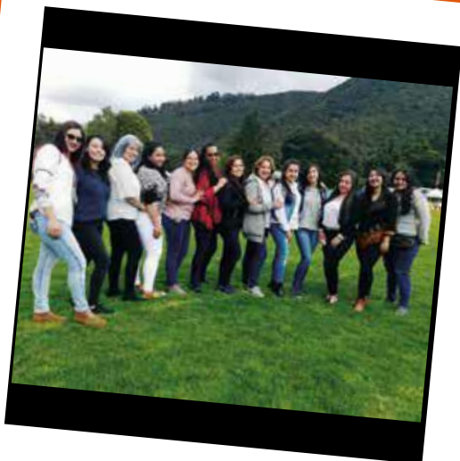
Educamos con amor