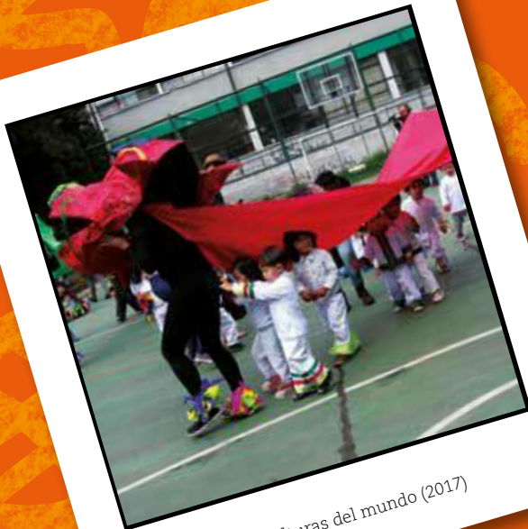
De viaje por las culturas del mundo (2017)