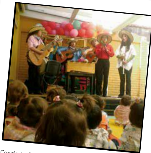
Concierto de maestros en formación. Licenciatura en Música (2009)

Es importante mencionar cómo desde el acompañamiento del equipo, a través de las interacciones que se tejen y los retos que propone este espacio, se aporta significativamente a la formación de maestros críticos, reflexivos y comprometidos con la labor docente y la infancia temprana.