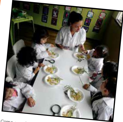
Como grandes científicos las raíces se dieron a la tarea de conocer (2016)