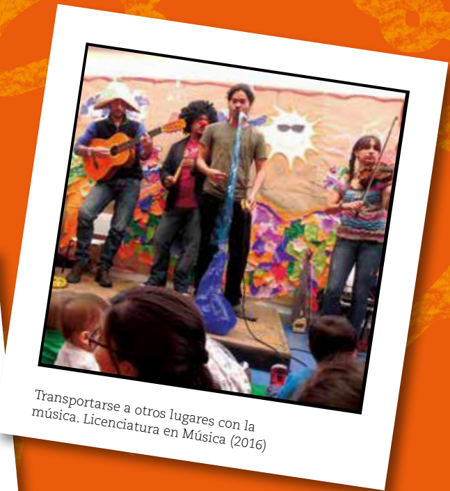
Transportarse a otros lugares con la música. Licenciatura en Música (2016)