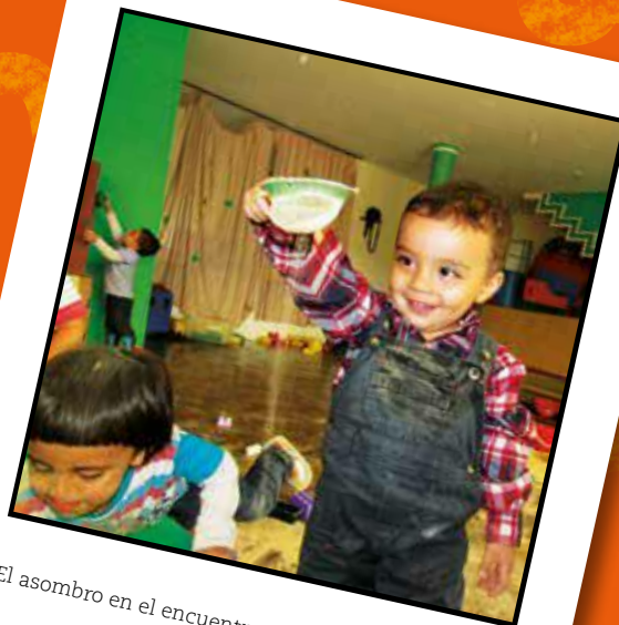
El asombro en el encuentro con lo diverso (2016)