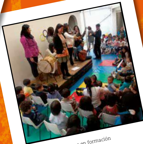
Concierto de maestros en formación. Licenciatura en Música (2014)