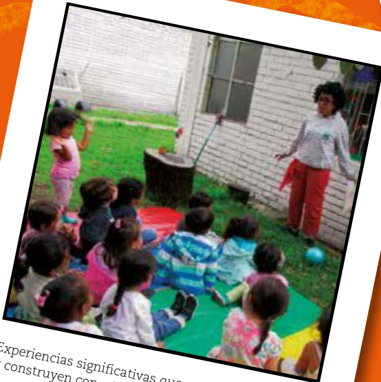
Experiencias significativas que movilizan y construyen conocimiento