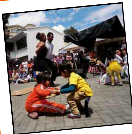
Viajar por las regiones de Colombia (2013)