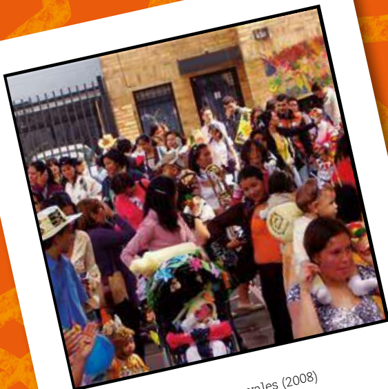
De fiesta en nuestros carnavales (2008)