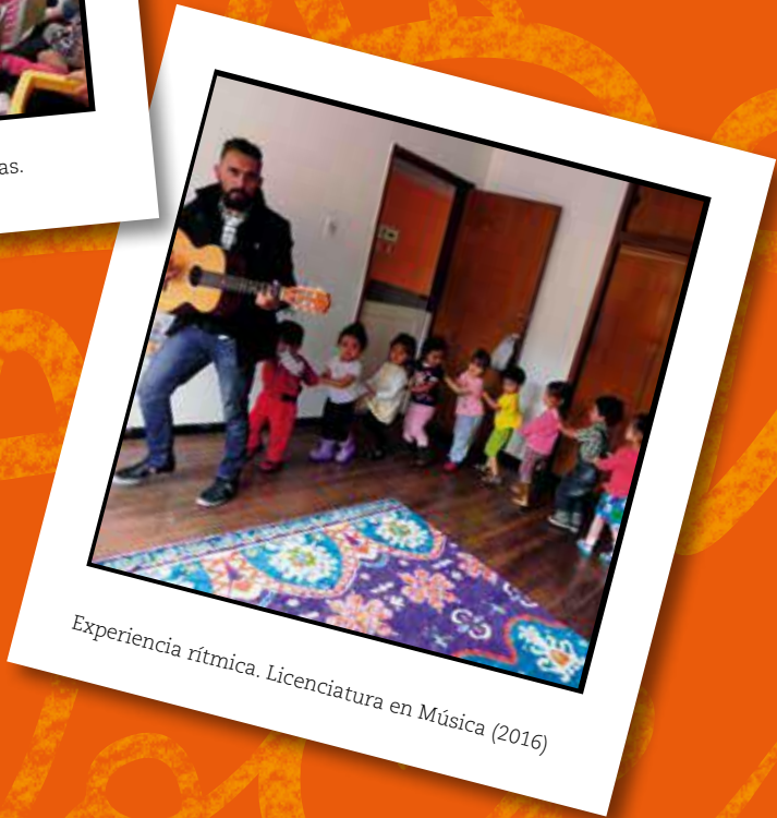
Experiencia rítmica. Licenciatura en Música (2016)