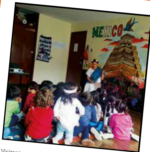
Visitantes que enriquecen las búsquedas emprendidas (2019)