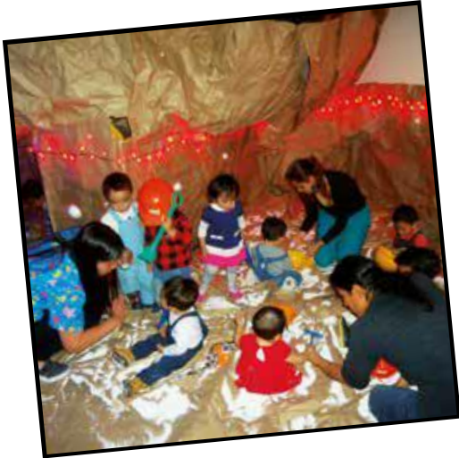
Viajes que transportan a niños y niñas a lugares diversos (2016)