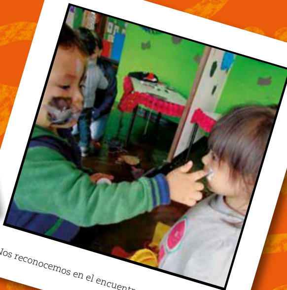
Nos reconocemos en el encuentro con el otro (2016)