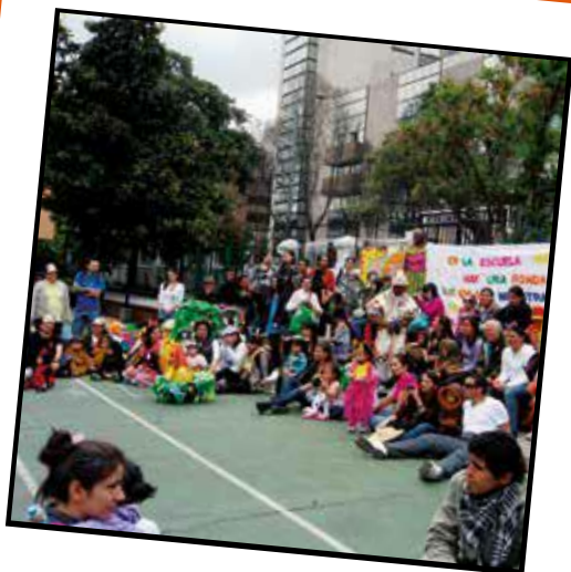
Ronda que ronda la ronda (2012)