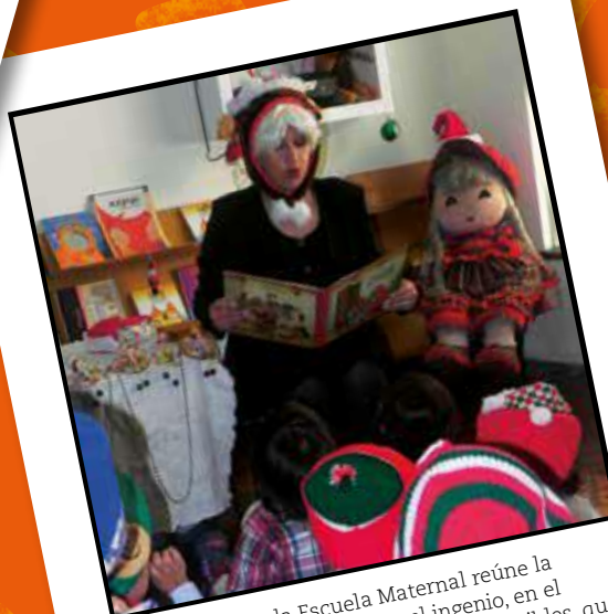
La literatura en la Escuela Maternal reúne la imaginación, la creatividad y el ingenio, en el avistamiento de mundos posibles, intangibles, que se materializan en la construcción de subjetividad