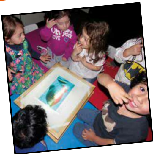
Ampliar los referentes construidos (2018)