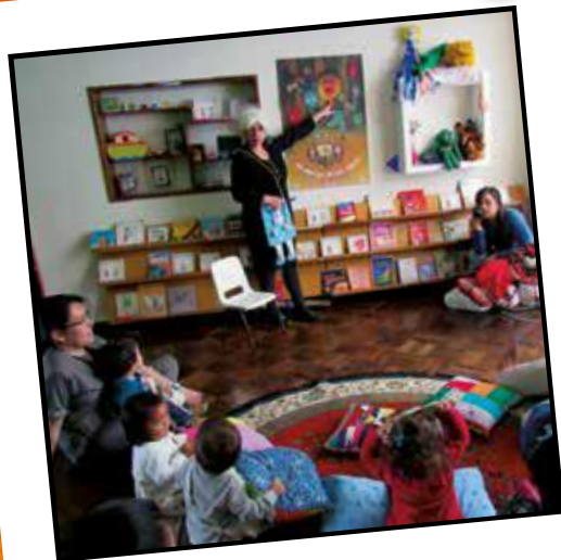
Relatos de la tía Mechas