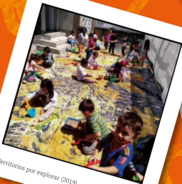
Territorios por explorar (2019)