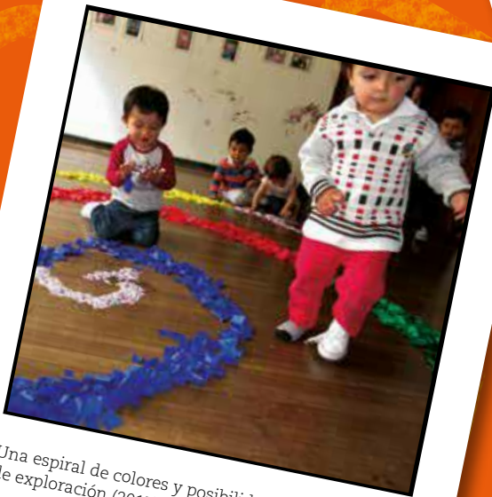
Una espiral de colores y posibilidades de exploración (2017)