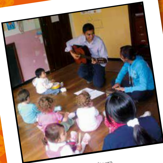
Al ritmo del tambor y la guitarra. Licenciatura en Música (2009)