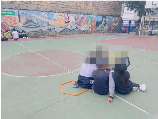
Ilustración 3. Momento de cierre