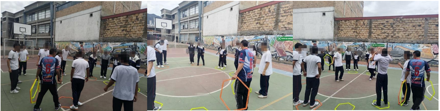
Ilustración 5. Guiño

con ese toque reflexivo que nos permite hacer las actividades/juegos con un propósito, y ver cómo podemos llevar esto a nuestro diario vivir.