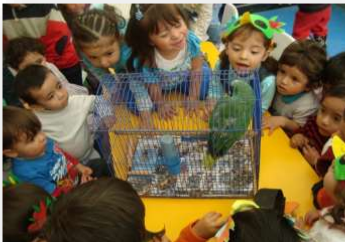
Fotografía # 3. Cotiniadidad de la Escuela Maternal. Rodríguez 2017 nán 6

e inaplazable, en tanto los primeros años del ciclo vital potencian o condicionan el desenvolvimiento cultural y social en las siguientes fases del ciclo vital. De ahí la importancia de contar con excelentes docentes en este momento del ciclo formativo.