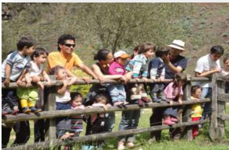
Fotografía # 4. Cotiniadidad de la Escuela Maternal. Acciones con padres y madres de familia. Rodríguez. 2017. pág. 7

La Escuela Maternal al ser consciente de que sus Padres y Madres son en su mayoría muy jóvenes y que se debaten entre estudiar para ser profesionales y cumplir con sus deberes sociales, contribuye a que estos docentes en formación asuman responsablemente su labor de agentes de la institución, en el componente de familia.