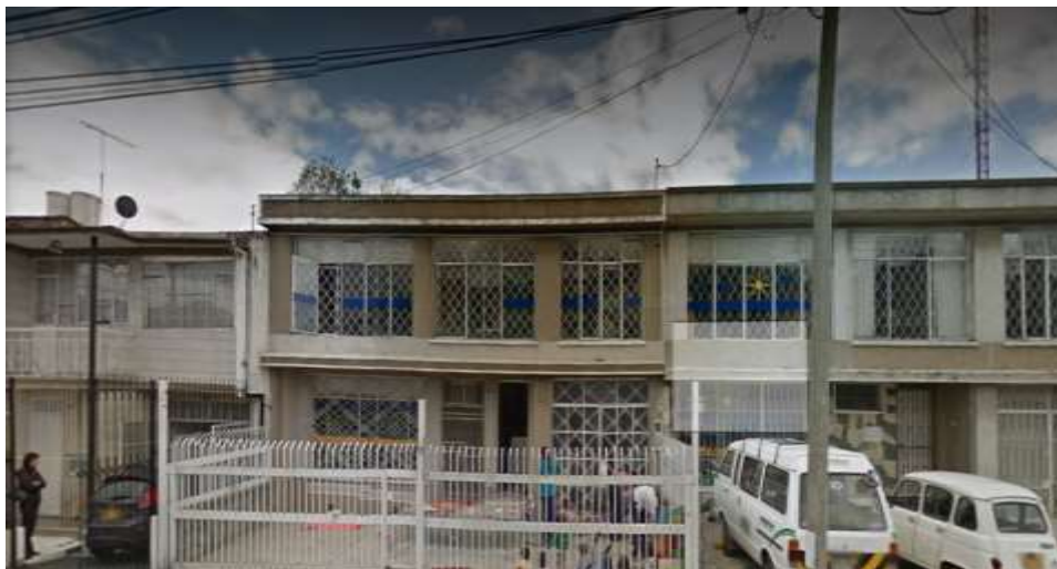
Fotografía # 1 Fachada de las instalaciones de la Escuela Maternal. Rodríguez. 2017. pág. 1.

La Universidad Pedagógica Nacional, da lugar a la creación de la Escuela Maternal, mediante la resolución 0238 del 1 de marzo de 2004, y su puesta en marcha empieza el 23 de agosto de 2004, la misión prevista en su creación es que este lugar fuese destinado al cuidado y educación de niños y niñas y a su vez permitiese a sus padres, estudiantes de la Universidad, asumir sus responsabilidades académicas, mientras sus hijos permanecían en un contexto óptimo para su desarrollo (Rodríguez et al. 2017. pág. 4).