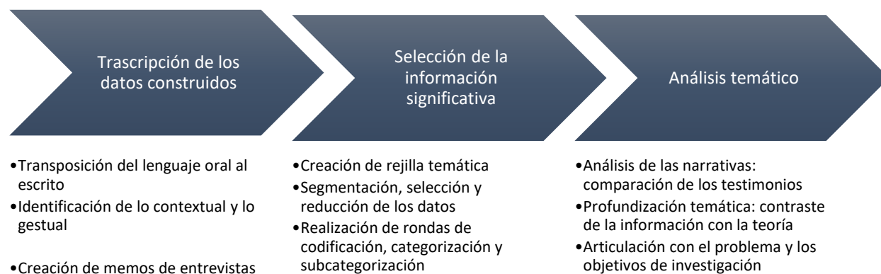
Figura 3. Proceso de análisis temático de los datos.

El proceso de análisis involucra una profundización cada vez mayor sobre el tema o los temas planteados que en este caso involucra tanto la transcripción, la creación de memos, la categorización y el análisis de las narraciones. Esta profundización se realizó identificando los nexos, buscando lo dicho y lo no dicho, comparando las experiencias y contrastando los sentidos con la teoría involucrado. En consecuencia, con Borda et al (2017) “La tarea analítica requiere reducir el volumen de la información, separar lo trivial de lo significativo, identificar patrones y construir un marco argumentativo para comunicar la esencia de lo que revelan los datos” (p. 76). En la Figura 3 se resume el proceso de análisis temático seguido en esta investigación a partir de los datos construidos.