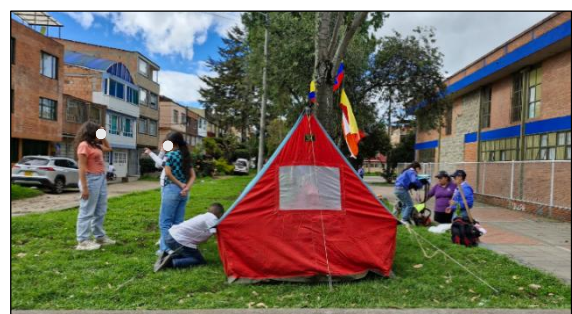
Figura 35. Sesión 4