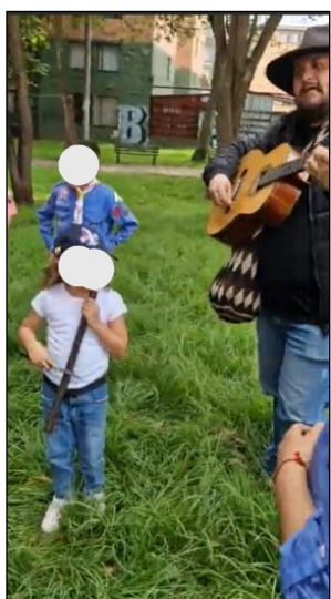
Figura 5. Sesión 1: Música y coplas