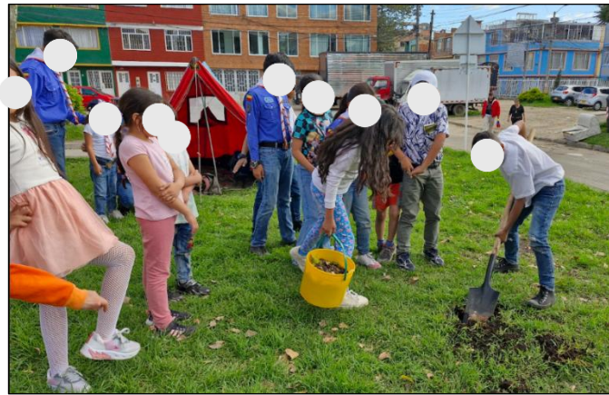
Figura 24. Sesión 3