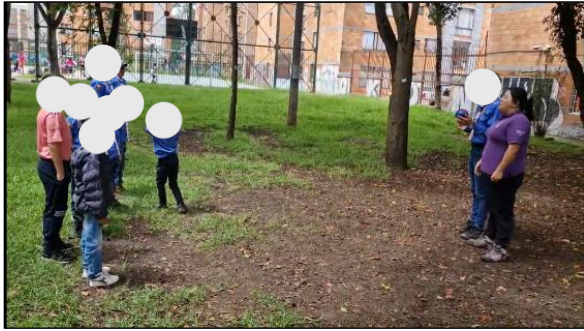
Figura 7. Sesión 1