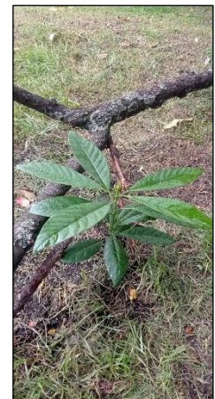
Figura 22. Sesión 3