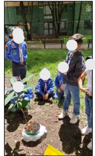
Figura 16. Sesión 3