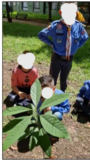
Figura 15. Sesión 3