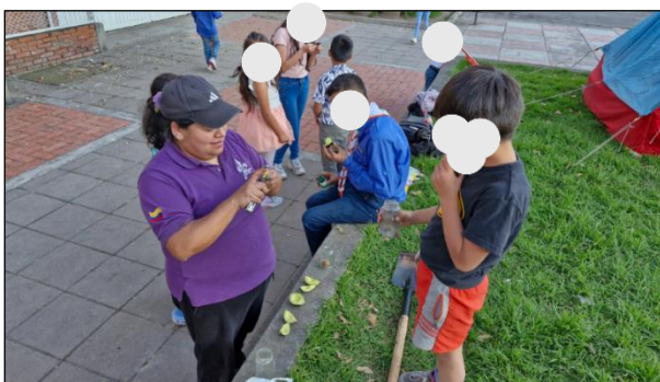
Figura 12. Sesión 2