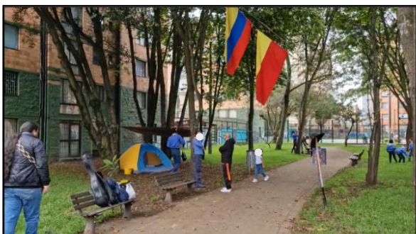
Figura 1. Sesión 1: Inicio de reunión, preparación.