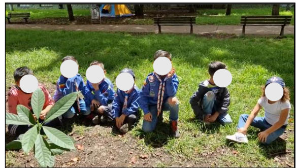
Figura 19. Sesión 3