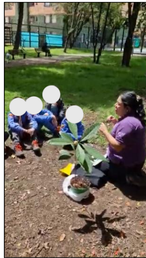
Figura 18. Sesión 3