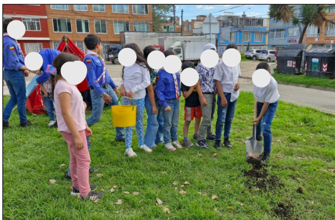
Figura 25. Sesión 3