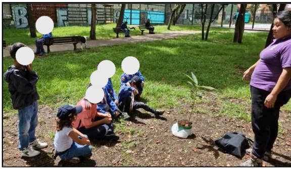
Figura 14. Sesión 3