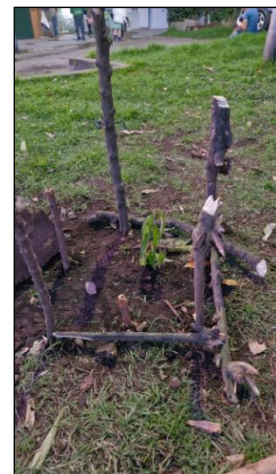
Figura 26. Sesión 3