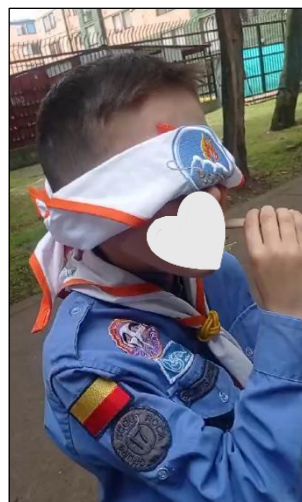
Figura 31. Sesión 4