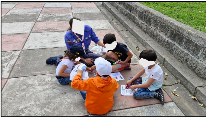
Figura 28. Sesión 4