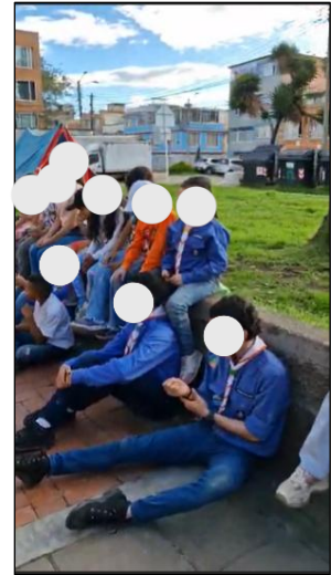
Figura 9. Sesión 1