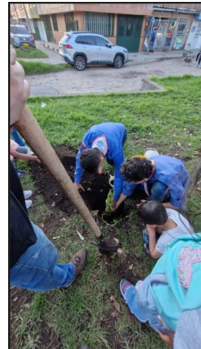
Figura 24. Sesión 3