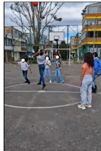
Figura 29. Sesión 4