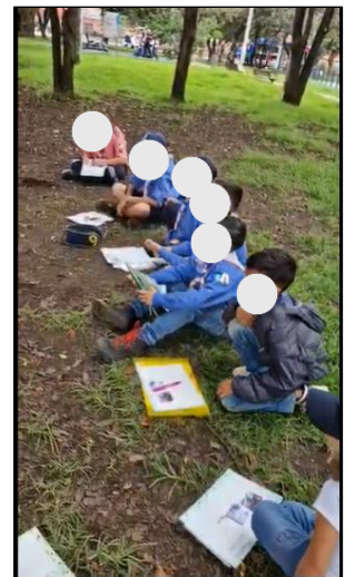
Figura 13. Sesión 2