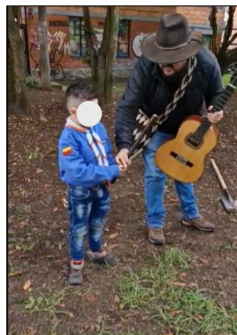
Figura 4. Sesión 1: Música y coplas