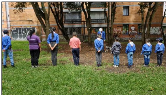
Figura 2. Sesión 1: Formación, saludo