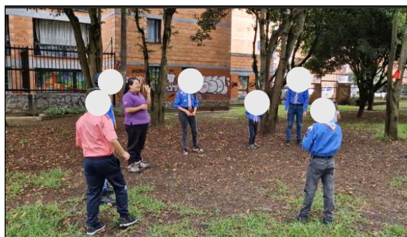
Figura 6. Sesión 1: Presentación Temática