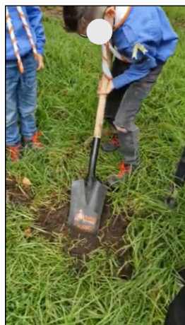
Figura 30. Sesión 3