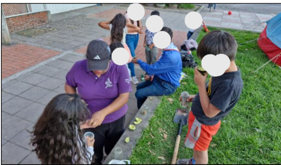
Figura 20. Sesión 2