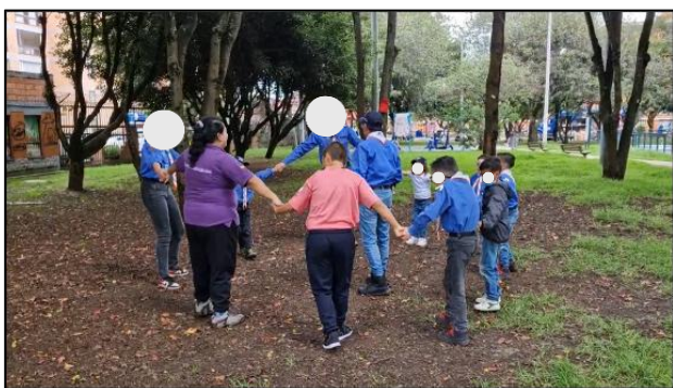
Figura 3. Sesión 1: Actividad Rompe hielo