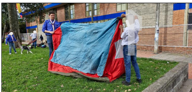
Figura 33. Sesión 4