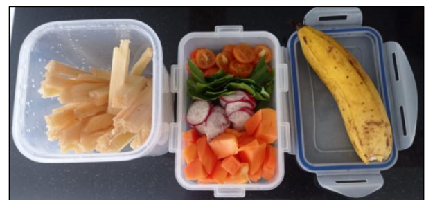
Figura 32. Sesión 4