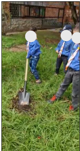
Figura 17. Sesión 3