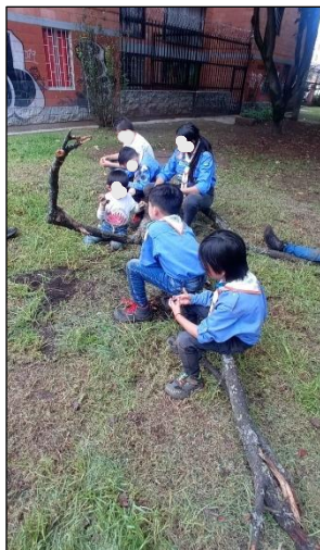
Figura 30. Sesión 4