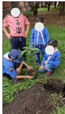
Figura 21. Sesión 3