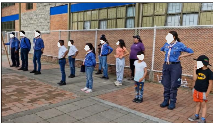
Figura 27. Sesión 4