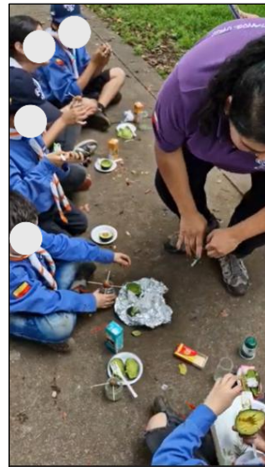
Figura 11. Sesión 2