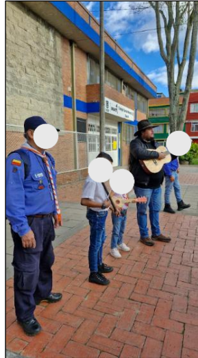
Figura 8. Sesión 1