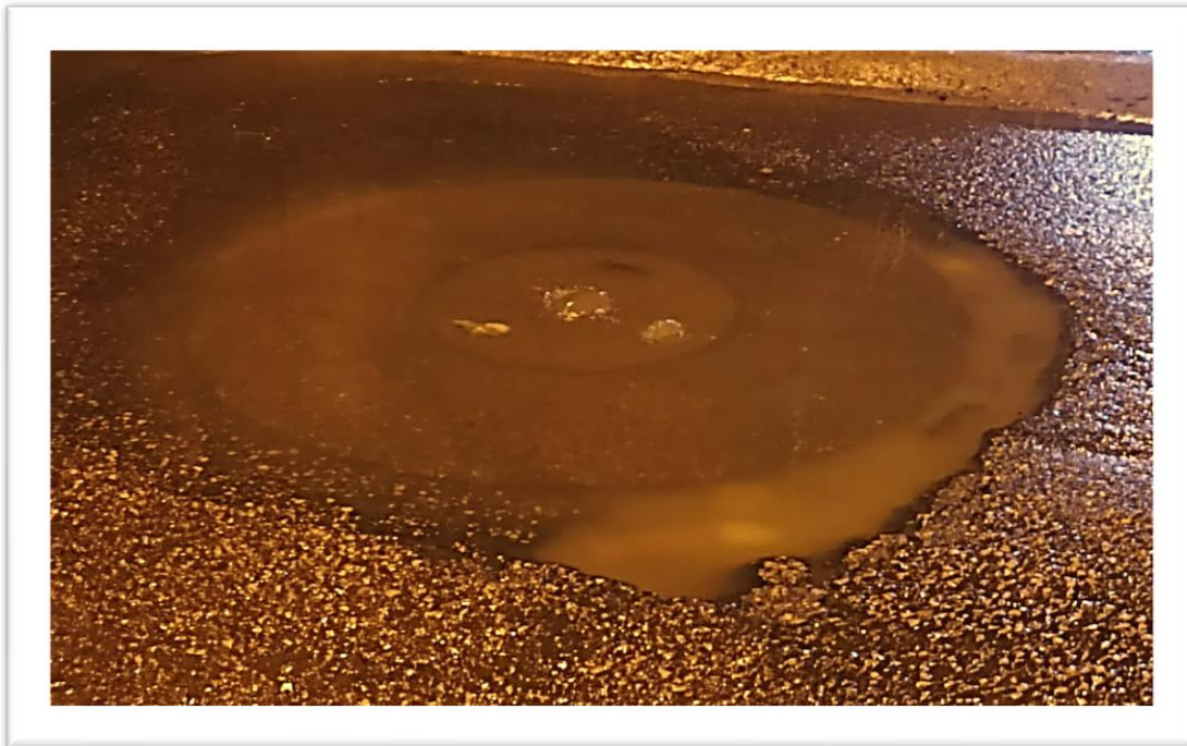
Figura 5 Fotografía tomada por Sofía (15 años). «Esta agua es de todos los días». Fuente: archivo de photovoice, 2025.

La respuesta de Sofía es un manifiesto. Está rechazando la narrativa oficial de su barrio, la que muestra lo pintoresco, lo bonito, lo que se puede mostrar a los visitantes, para afirmar una verdad vivida: la precariedad, el abandono, la contaminación cotidiana. Su fotografía no es un registro estético; es un acto político de visibilización.