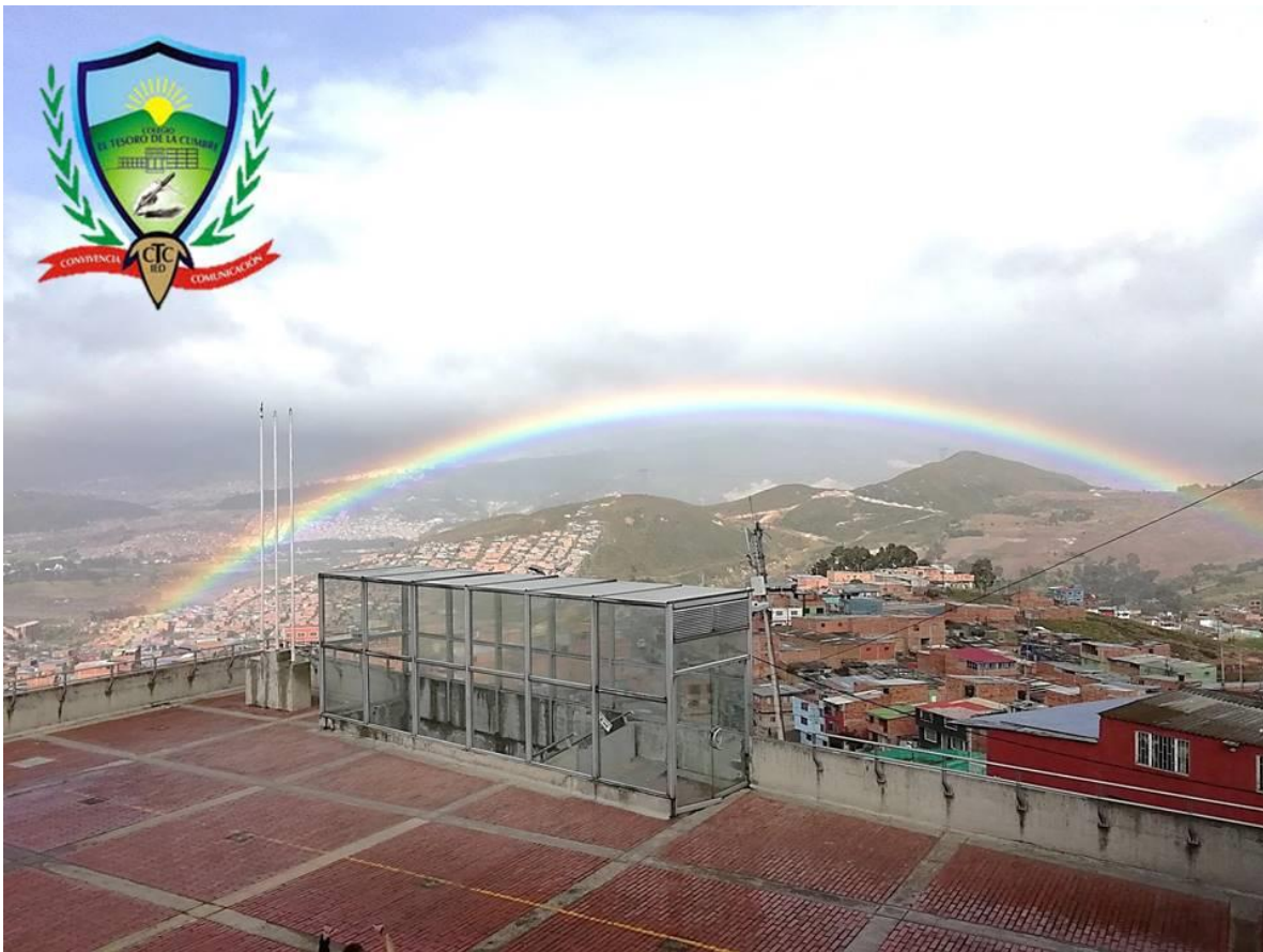
Figura 1 Panorámica de Ciudad Bolívar.

Datos de la Secretaría Distrital de Planeación (2022) indican que, mientras en la ciudad el acceso a acueducto es casi universal, en Ciudad Bolívar persisten zonas con cobertura intermitente o mediante redes informales de acceso a servicios.