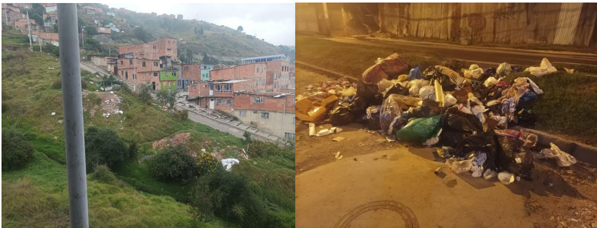
Figura 3 Punto crítico de basura en Ciudad Bolívar.

Ante la ausencia o insuficiencia del servicio público, emergen soluciones informales que, si bien mitigan temporalmente el problema, no resuelven la raíz estructural y, en muchos casos, generan nuevas formas de exclusión y precariedad.