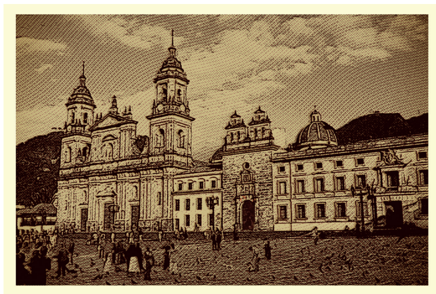
Imagen 2.1. Plaza de Bolívar.

La plaza fue además el lugar de socialización por excelencia en el pasado de las ciudades europeas y latinoamericanas, donde las personas se involucraban en la vida colectiva de la ciudad. Durante la Edad Media, en Europa Occidental, las plazas eran utilizadas para el pregón, distintas actividades religiosas, como la ejecución de las condenas dictadas por los tribunales de la Santa Inquisición. Fueron escenarios para los juglares, saltimbanquis, cuenteros y representaciones teatrales. En el Renacimiento se convirtieron en escenarios propicios para el discurso y exhibiciones artísticas, que llenaron las plazas europeas de esculturas.