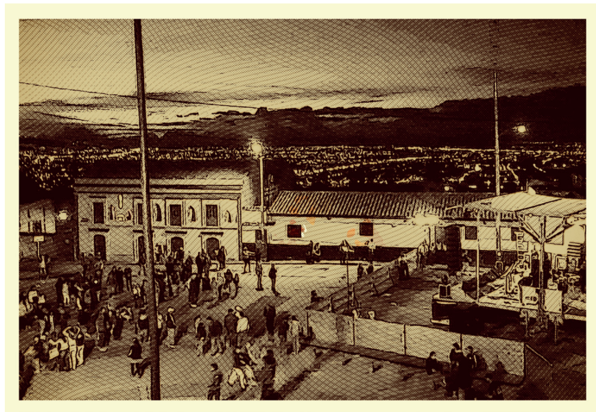
Imagen 2.2. Calle de Santa Fé de Bogotá.

y del correspondiente esfuerzo público por preservar la integridad de la calle manteniéndola libre de la apropiación.