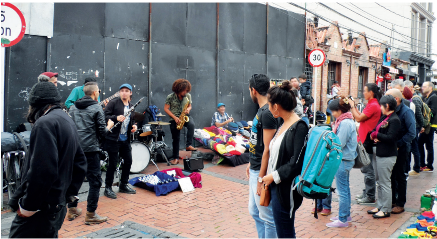
Imagen 3.2. Músicos callejeros.

Un día fue y le dio tinto, otro día fue y le dio pan, al otro día le dio tamal, y al otro café, y yo no sé qué le dio más porque al quinto día, ya estaban rejuntados y termino ella dándole después cinco chinos.