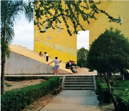
Imagen 3.10. Parque amarillo.

Las cuatro funciones básicas de la ciudad moderna: habitar, circular, trabajar y recrearse, han sido los preceptos que han seguido los planificadores de las ciudades desde el siglo xx. En ese tenor, el diseño de los espacios de ocio y recreación fueron implementados como elementos reguladores del medio ambiente, con ello se quería incidir favorablemente en el espíritu humano y facilitar las