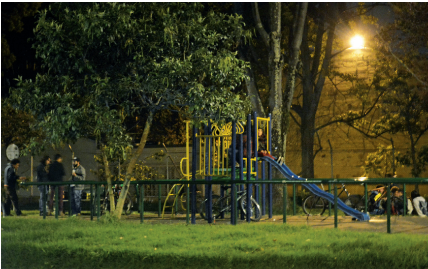
Imagen 3.6. Parque infantil.

que todos están pendientes de que ninguna persona o grupo realice alguna acción que atente contra la integridad de otra persona. En este sentido, uno de los mayores peligros de la zona, afirma el grupo de estudiantes entrevistados, se da cuando el parque no está tan concurrido, y aparece un grupo de tres habitantes de calle que ya han sido denunciados a las autoridades por la comunidad, por los robos que se presentan en el sector y que a pesar de haber sido denunciados a las autoridades no han sido detenidos.