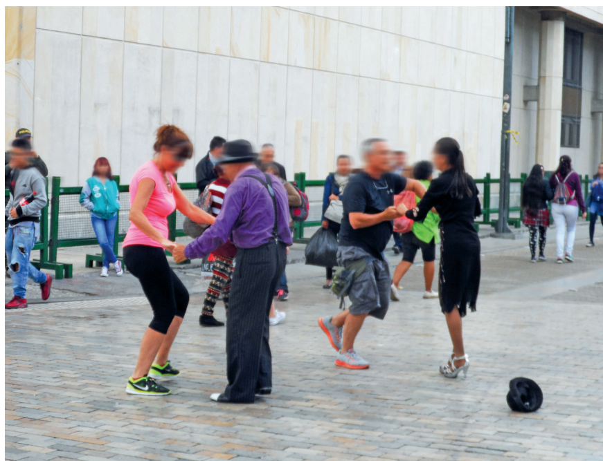
Imagen 3.1. Septimazo mágico.

Este corredor de la ciudad es visitado los fines de semana por una gran cantidad de ciudadanos que se mezclan entre sí, un flujo constante que en ocasiones produce aglutinamiento en los actos artísticos. Debido a ello, la concurrencia a la Séptima, específicamente al acto de magia, se acompaña de una alta presencia policiaca. Por este motivo, las personas indagadas reconocen que se sienten seguros, sin embargo, hay que tener cuidado con los “cosquilleros”, “amigos de la ajeno” y los “choros” que actúan de manera silenciosa aprovechando los tumultos y el descuido de la gente.