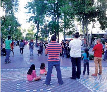
Imagen 3.11. Paseo Chapultepec.

El paseo Chapultepec comienza desde su cruce con av. México hasta av. Niños Héroes. Antiguamente, se le conocía como av. Lafayette y desde 1908, cuando se hizo esta avenida para el público que salía del centro de la ciudad, sirvió sitio de recreo y de paseo. Desde entonces, se caracterizó por ser arbolada con tabachines, jacarandas, ceibas, fresnos y hules entre otras especies. En los últi-