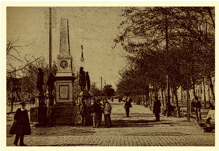
Imagen 2.3. Obelisco de la Alameda ca. 1900.

unas dos millas fuera de la ciudad y a sus lados hay árboles cuyos troncos están unidos por un intrincado seto de rosas silvestres. Aunque ni a los habitantes de la capital ni a los del campo les gusta mucho pasear y se limitan a hacerlo en los andenes de la calle real, sucede que se ve en La Alameda, sobre todo los domingos. Una numerosa concurrencia. Pero los que frecuentan más este paseo son los jóvenes elegantes, quienes al andar de sus caballos la recorren todas las tardes. (Citado en Mejía, 2002, p. 234).