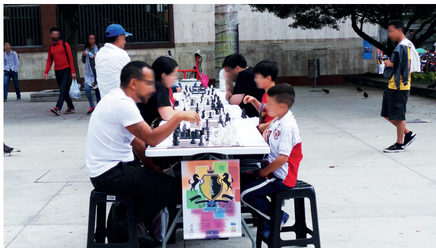
Imagen 3.7. Juegos de mesa.

El espacio físico en el que realizan los juegos no es precisamente el indicado para esta actividad, genera inconvenientes a quienes transitan por el sector y para ellos mismos no es el más cómodo, pues toca estar de pie por los ratos que dura el juego, en un espacio reducido, se requiere armar y desarmar las mesas, convocar participantes y establecer las reglas según el juego. Sin embargo, es la opción que tienen a la mano, cerca de sus lugares de trabajo y esto lo hace indicado para ellos, ya que pueden tener un poco de recreación mientras cuidan sus negocios a la vez que socializan y estrechan relaciones con vecinos y conocidos del lugar.