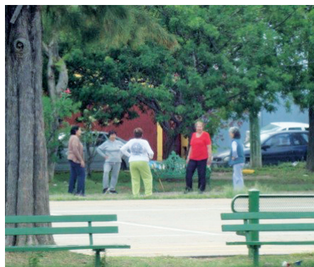
Imagen 3.9. Grupo gimnasia tercera edad.

En la zona metropolitana de Guadalajara, el municipio con mayor población es Zapopan y es, a su vez, el segundo más poblado del Estado de Jalisco. Sin embargo, está integrado geográficamente y transitando por sus calles es difícil reconocer los límites con Guadalajara como municipio. Se habla del poniente de Guadalajara para referirse a lo que es el municipio de Zapopan. Del total de su territorio,