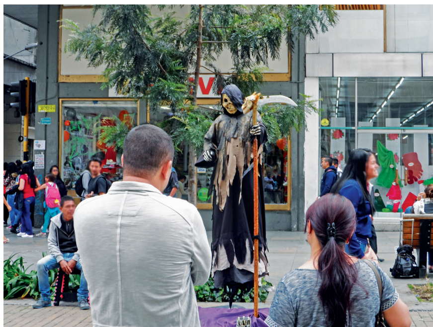
Imagen 3.4. Estatua.

Los artistas toman dos descansos de 10 minutos y vuelven a empezar su espectáculo. A medida que va cayendo la tarde, el flujo de personas que se detienen a observar disminuye. A las 5:00 p. m., las dos estatuas humanas deciden terminar el espectáculo, abren la alcancía que habían puesto para ambos y reparten el dinero, esto lo hacen ya en la esquina de un andén, cada uno recoge su indumentaria se despiden y se dirigen a sus hogares.