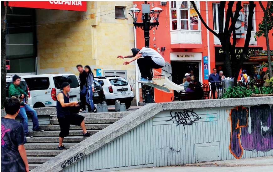
Imagen 3.8. Skaters en el parque Santander.

mañana montando en sus tablas, otros se reúnen para tomar un almuerzo rápido que llevan desde sus casas; la mayoría comparte la comida, que por lo regular es papas fritas de paquete, emparedados o refrescos. Después de esta hora, las personas siguen montando un poco y luego se marchan; no obstante, llegan después más skaters . El promedio de duración por persona en este lugar es de alrededor de tres a cuatro horas, lo que duran los espectadores esporádicos allí es menos, de quince a treinta minutos.