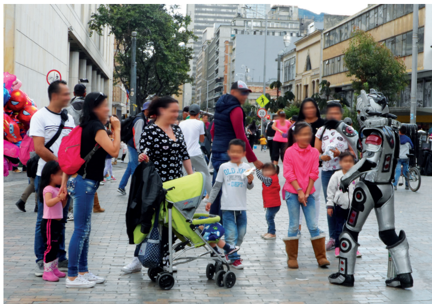
Imagen 3.3. Risas en la calle.

Los patrones del artista están en consonancia con el lugar: el tono de la voz, el movimiento por el espacio, el apoyo que ofrece el mobiliario urbano, como las materas o las bancas del parque, se constituyen en los facilitadores del encuentro aun cuando no hayan sido planificados estos elementos espaciales para tal fin. Son los individuos quienes los transforman para facilitar el encuentro casual.