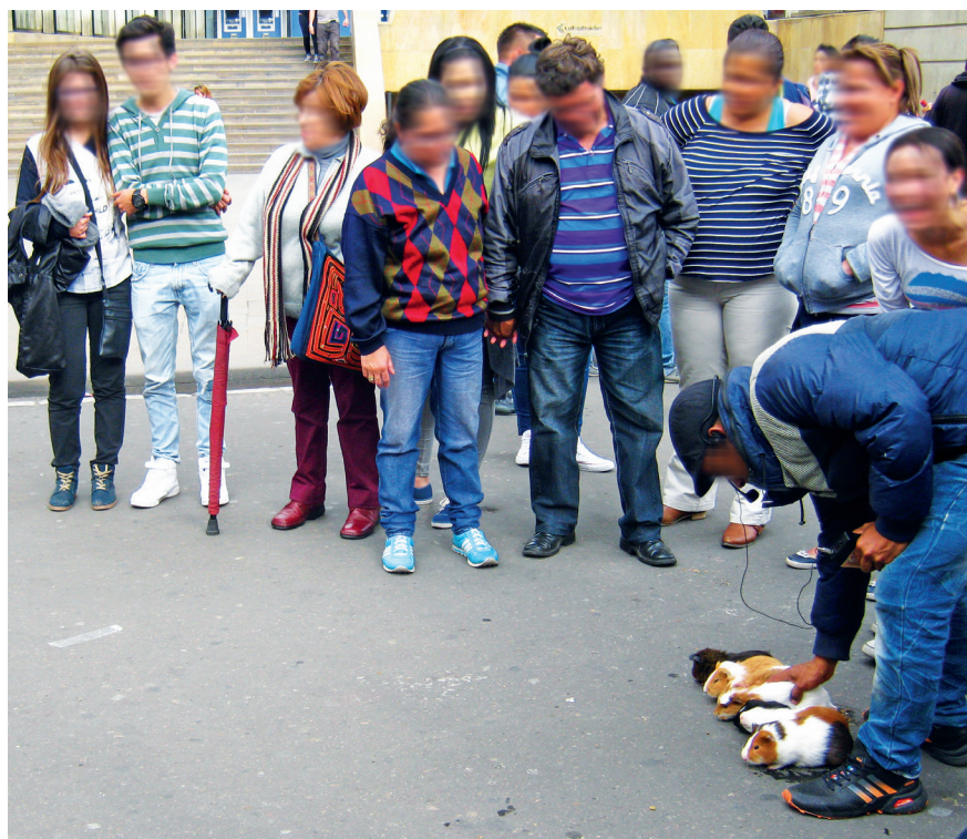
Imagen 3.5. Juegos con animales: los cuyes.

clarificación. Además, y en consideración a que todo espectáculo tiene espectadores, encontramos dos tipos. Los observadores, transeúntes que usualmente van acompañados y que intercambian palabras entre sí o con desconocidos, con lo que confiere a un comentario sobre el juego o el cuy. Y, por otro lado, los participantes, que ascienden del rol de observadores a participantes en el juego, cuyo interés ya no está ligado a la admiración, podríamos decir, del cuy en su manera de moverse o lo que este incite, sino a lo que pueda posibilitar una ganancia por el trayecto y la selección de la gruta de homologación numerada que ha de tomar el roedor.