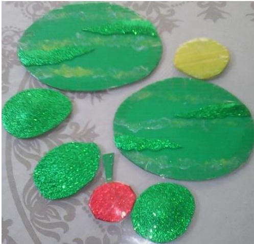
Ilustración 10 Frutas

Frutas hechas en cartón piedra que corresponden a: