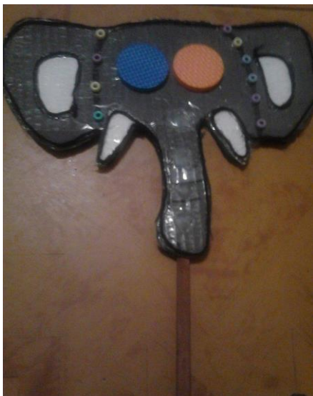
Ilustración 6 Mascarita elefante

Mascarita de elefante hecha en caja de cartón, con texturas como chaquiras para delimitar la forma de sus orejas y fomi en la parte de los ojos también cuenta con una paleta para un buen agarre.