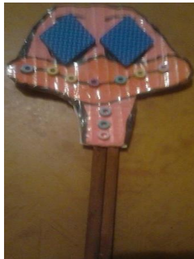
Ilustración 5 Mascara pato

Mascara de león hecha en caja de cartón, con texturas como chaquiras para delimitar la forma de sus bigotes, fomi en la parte de la nariz y lana para destacar su melena también cuenta con una paleta para un buen agarre