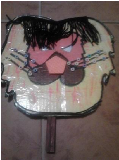
Ilustración 4 Mascara León

Mascara de león hecha en caja de cartón, con texturas como chaquiras para delimitar la forma de sus bigotes, fomi en la parte de la nariz y lana para destacar su melena también cuenta con una paleta para un buen agarre