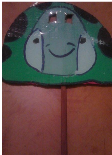
Ilustración 7 Mascarita tortuga

Mascarita de elefante hecha en caja de cartón, con texturas como chaquiras para delimitar la forma de sus orejas y fomi en la parte de los ojos también cuenta con una paleta para un buen agarre.