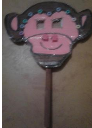
Ilustración 11 Mascara mico

Un limón de textura liza, color amarillo de tamaño pequeño con olor