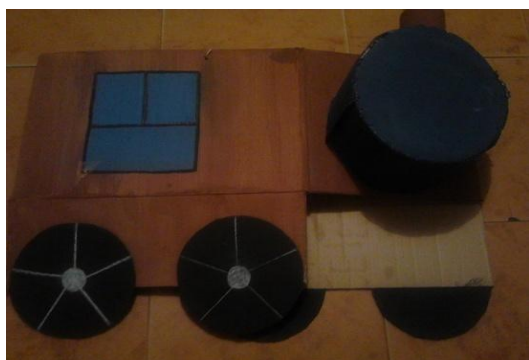
Ilustración 8 Tren

Mascarita de tortuga hecha en caja de cartón, con colores respectivos también cuenta con una paleta para un buen agarre.