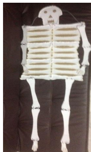
Ilustración 9 Esqueleto

Tren grande hecho de cartón con capacidad de alojar dos personas, textura liza, color café y azul con 4 llantas a cada costado.