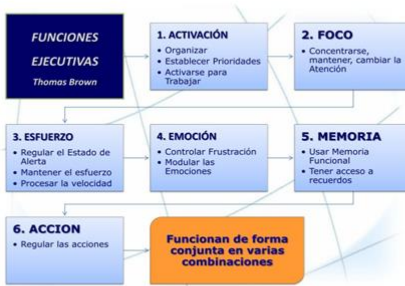
Ilustración 1 Funciones ejecutivas por Thomas Brown

Para Brown algunos impedimentos de las FE “pueden ocurrir en los niveles más básicos de manejo del comportamiento 3 ” (Brown 2002: 910) en donde se encuentran las dificultades en el autocontrol de las acciones y así manifestar hiperactividad o impulsividad lo cual impide un adecuado desarrollo de las tareas y una afectación en la emoción, por otro lado se encuentran otras alteraciones más sutiles “afectando la memoria, la organización y las habilidades de planificación 4 ” (Brown 2002: 911) lo que implica que estas no se desarrollen o se desarrollen mucho más tarde de lo esperado y afecte el inicio, desarrollo y finalización de múltiples tareas de la vida cotidiana.