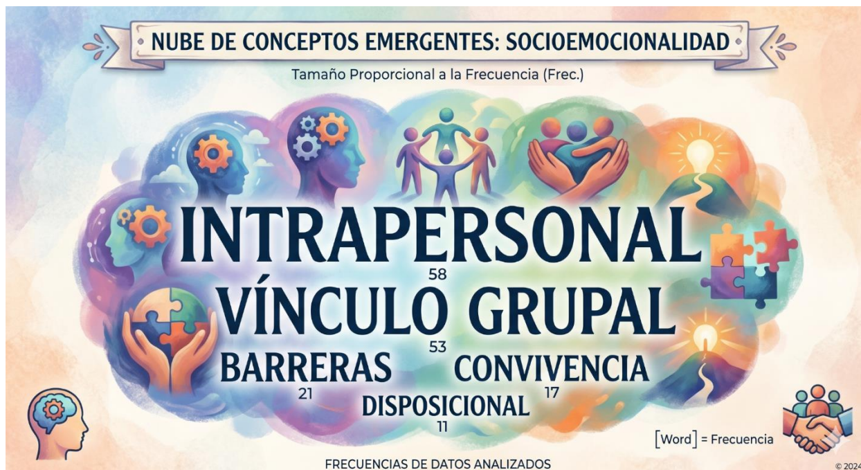
Figura 2. Categorías emergentes

nos permitió evidenciar que, más allá de cumplir con una actividad, los estudiantes reflexionan sobre su comportamiento y el de sus compañeros, dando cuenta de una comprensión básica de aspectos como el respeto, la cooperación y la inclusión.