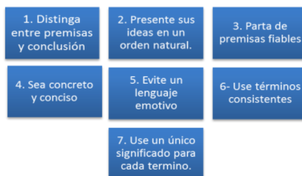
Figura 1. Reglas generales para la composición de un argumento corto.

Weston (2006) menciona que la argumentación es, “ofrecer un conjunto de razones o de pruebas en apoyo de una conclusión” (p. 11), por lo tanto, la argumentación se enfoca en analizar las razones detrás de las decisiones tomadas, involucrando argumentos, intereses o conocimiento compartido con el propósito de respaldar o debatir la validez de ideas mediante pruebas fundamentadas. En este ejercicio consciente, como lo es argumentar se encuentra que Weston propone una serie de reglas generales con respecto a la composición de un argumento corto, las cuales señalan un punto de partida directo y conciso para quienes dan sus primeros pasos en este ejercicio.