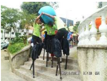
Nota: Competencia de zancos en Medellín.

indispensables para poder formarme como zanquero. Estos