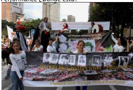
Nota: Desfile organización derechos humanos. Tomado de (Fundación Nydia Erika Bautista, 2013)

2. ‘El músico’, personajes de la obra ¿Dónde está? Este personaje era algo elegante, sus movimientos eran lentos, ya que semejaban a una persona en procesión con la diferencia que tenía un tambor (bombo) grande en el pecho, el cual llevaba el compás de la procesión.