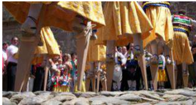
Figura 29 Zancos de Anguiano.

Nota: zanqueros danzantes por calles de España.