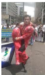
Nota: En una marcha.

También presentaba pequeños sketches en los semáforos para