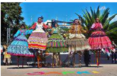
Figura 8 Personajes obra Saphi

Nota: Presentación obra Saphi en el municipio de Funza. Tomado de (Colectivo Teatral Luz de Luna, 2023)