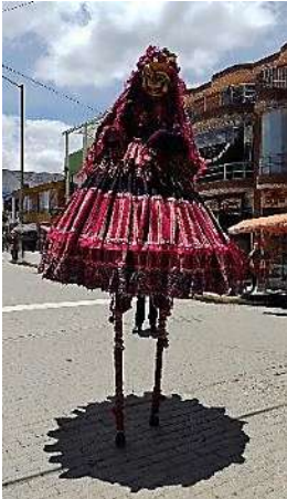
Nota: Personaje de la obra Saphi. Tomadas de archivo personal.

5. ‘Silvina’ de la obra Saphi . Este personaje es de los últimos que he tenido la oportunidad de crear. Este pasa por diferentes etapas de acuerdo con la dramaturgia que son el paso por la vejez, la niñez y la muerte. Cada personaje tiene diferentes cualidades de moviendo, cuando están las ancianas llamadas alegrías (vejez), los movimientos de este personaje son un poco lentos, pero contundentes y con algo de movimientos involuntarios en las manos; con el personaje de las jóvenes (niñez), los movimientos son más enérgicos, más efusivos y llenos de energía y con el personaje de