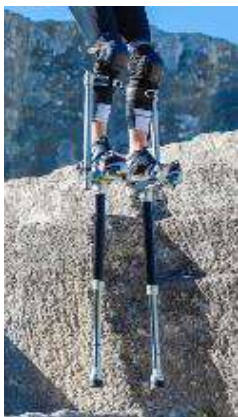
Figura 32 Zancos con suspensión.

hazañas de manera fluida, como una extensión del cuerpo, mas no como ente externo al mismo. Los zancos pueden sorprender y también ofrecen la oportunidad de crear cualquier tipo de movimientos, coreografías únicas. Debido al trabajo con el cuerpo de los diferentes