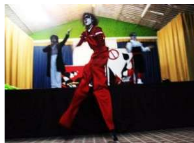
Figura 4 Personaje pelos en zancos.

Nota: Intervención en colegio, archivo personal.