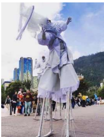
Figura 38, 39 y 40 Zancos de Balance

En la foto vemos a uno de los personajes de Luz de Luna, uno de sus ángeles zancudos, balanceándose una y otra vez, yendo y viniendo (Salas, 2020)