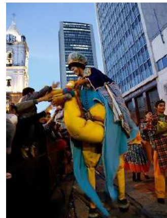
Figura 22 Rey mago.

Nota: Desfile de comparsas.