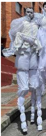
Figura 21 ‘N.N’

Nota: intervención.