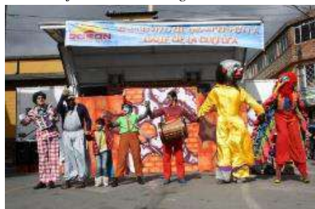
Nota: Presentación obra El Paragüero en Bogotá.

tanto lo de la consciencia corporal como la consciencia espacial en los zancos, durante la escena. También trabajaba mucho la percepción, la memoria corporal, ya que la vista era limitada.