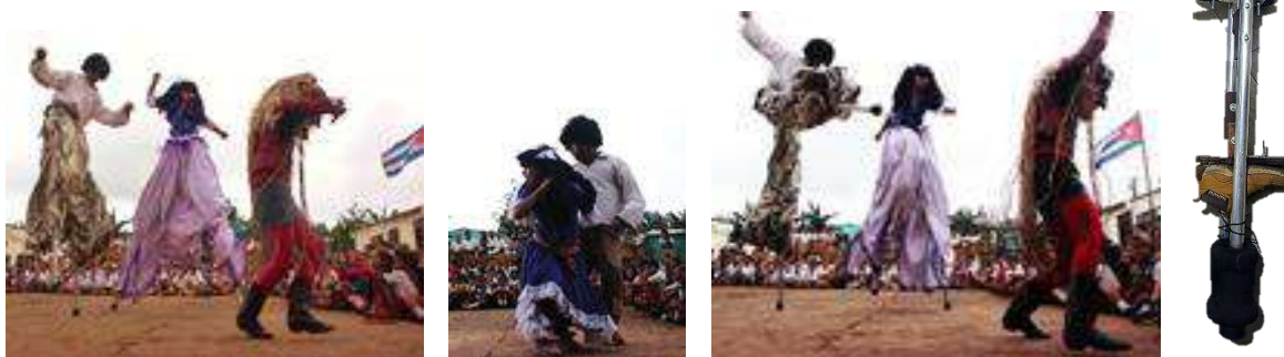
Figura 5, 6 y 7 Los fantasmas del

Nota: Presentación de la obra los fantasmas del vecino en Cuba y zancos de aluminio.