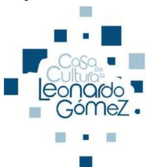
Figura 1 Logo de la casa cultural

Nota: Tomado de (Casa de la cultura Leonardo Gómez, 2023)