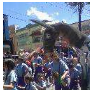
Nota: Comparsa Canecas llenas, corazón contento.