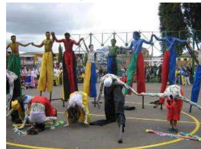
Figura 24 Personaje ‘Agua’

Nota: Muestra de comparsas. Tomada de (Guarín, 2008).