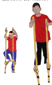
Figura 34 Zancos de mano.

Nota: Zancos de mano.