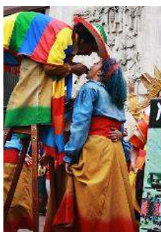
Nota: Comparsa Miradas Inquietas entre ollas y carretas. Tomadas de (Luz, 2014).

8. ‘ Borracho en comparsa ’. Este personaje es uno de los primeros personajes que se propuso para los zancos de balance, la característica más evidente es que siempre estaba borracho y la relación con los zancos. Fue muy importante, ya que estos zancos en su parte inferior tienen un arco que está modificación en los zancos para el personaje de borracho, lo que hace que uno juegue