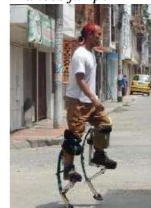
Figura 37 Zancos jumper

Nota: Ensayando.