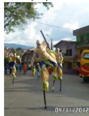
Nota: Comparsa en Medellín.