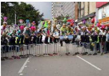
Figura 36 Zancos con patines.

Nota: Grupo Chiminigagua en comparsa.