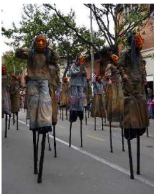
Nota: Comparsa danza de lo oculto.

despreocupada, tenía un léxico y una forma de relacionarse con los demás muy chabacano, con este personaje se jugaba mucho con los desequilibrios, ya que en el primer momento imitaban a personas de la alta sociedad, pero luego se polveaba la cara y se convertía en un habitante de calle que había acabado de consumir