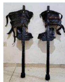
Figura 35 Mis zancos.

Nota: Estos zancos son los que normalmente uso Tomado de (Registro personal).