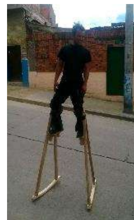
Nota: Primera prueba en zancos de balance. Tomadas de (Guarín, 2014).