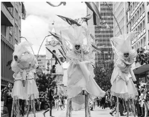
Nota: Desfile metropolitano de Bogotá.

9. ‘Estatuas móviles’, desfile. Estos personajes también tenían los zancos de balance en los que se pretendía imitar un movimiento pendular de atrás para adelante, mientras que seguían a unos pobladores (personajes de piso). Estos personajes nos permitían jugar con dos diferentes cualidades