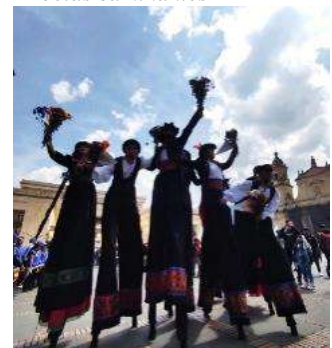
Nota: Intervención plaza de Bolívar.