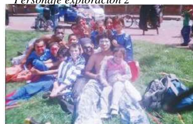
Nota: Muestra de uno de mis primeros procesos. Tomado de (Guarín, 2014).