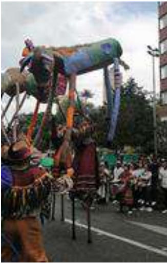
Figura 23 Desplazado con su burro.

Nota: Desfile de comparsas.