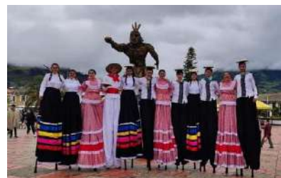
Figura 31 Teatro Experimental de Boyacá

diversas razones que se relacionan con su accesibilidad, interacción con el público, y su capacidad para adaptarse a los espacios no convencionales y diferentes contextos sociales, culturales. Los zancos han encontrado una mayor acogida en el teatro callejero por diferentes razones entre