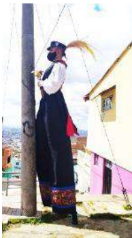
Nota: Intervención localidad Santa Fé. Tomadas de (Guarín, 2020).

6. ‘Poeta caminante’ de Aves de paso . Este personaje se pensó desde la creación de imágenes, al hablar lo hacía desde unos poemas previamente establecidos, los zancos jugaban una parte