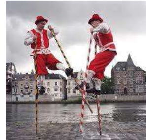
Figura 30 Zancos de Namur

Nota: zanqueros en combate en calles de España.