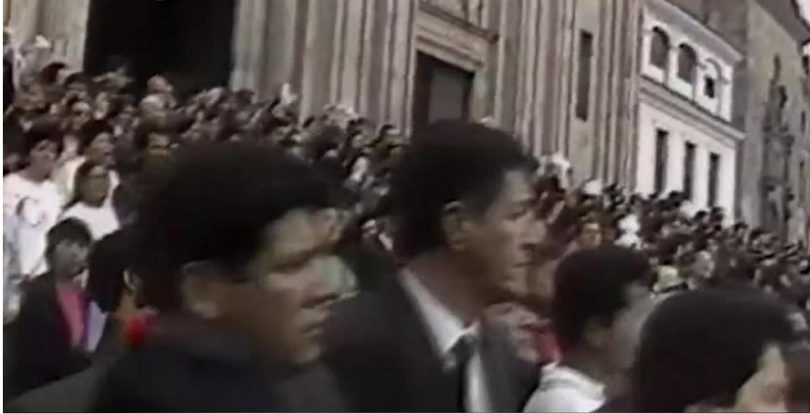
Imagen 3. La gente acompaña el féretro de Diana Turbay (archivo de video incluido en Escobar, el patrón del mal, capítulo 103)

En la imagen se puede ver una gran multitud en luto por lo ocurrido con Turbay; a una ciudadanía que sufre ante el acto violento de un narcotraficante. Se crea un sentimiento de dolor colectivo que busca ser transmitido a los televidentes. Es el dolor derivado de las acciones de un personaje que, capítulo a capítulo, se ha convertido en la materialización del mal. De esta forma, se busca crear una suerte de conciencia colectiva a partir de la división binaria entre bien y mal, para que los televidentes tomen el bando de la ciudadanía que se ha decidido mostrar: el dolor, la compasión y la aceptación de las decisiones presidenciales. Una ciudadanía, además, que históricamente sí existió, pues la imagen no es un montaje: es un archivo.