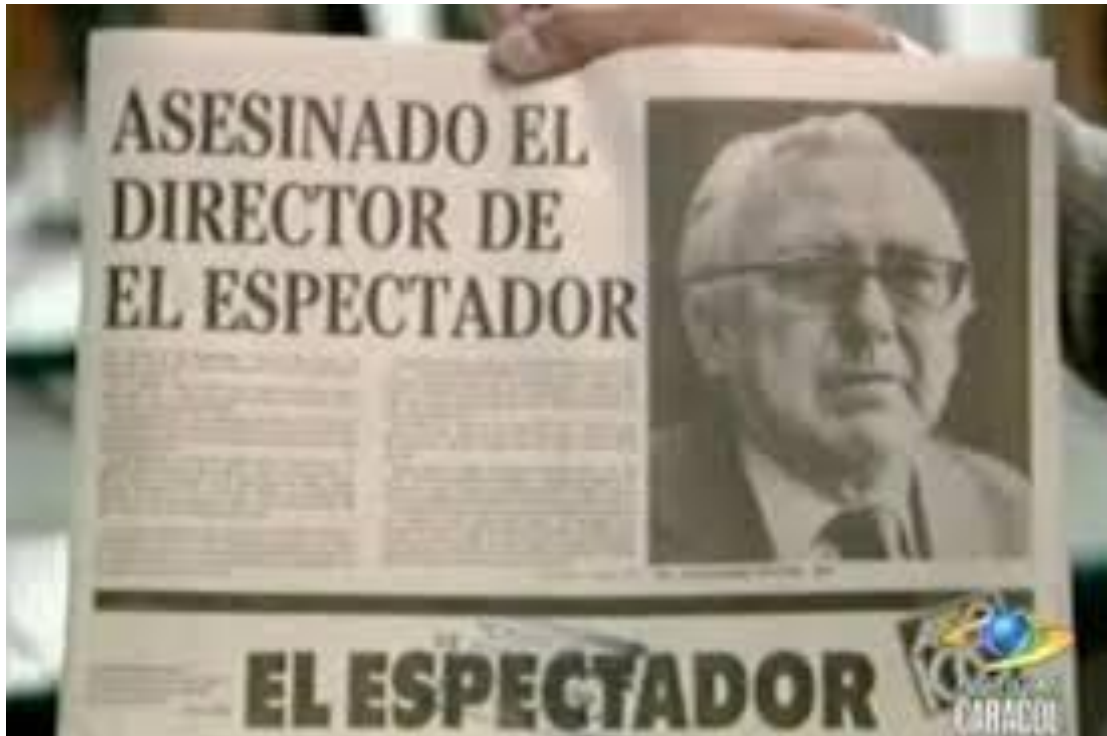
Imagen 5. Noticia sobre el asesinato de Guillermo Cano, director del Espectador.

En la imagen 6 se observar a Pablo sosteniendo un periódico con la noticia del asesinato del director del Espectador.