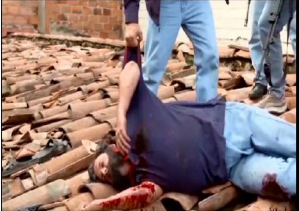
Imagen 8. Foto de la muerte de Escobar en la serie.