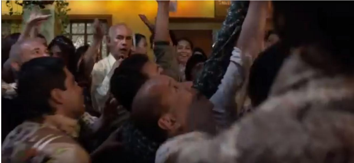
Imagen 1. Celebración de cumpleaños de Pablo Escobar en Escobar, el patrón del mal ; capítulo 1

Las personas en esta escena se ven después en una situación de lucha para acceder a más billetes. Más allá de la sensación de los personajes en escena (dicha ante el acceso fácil a dinero) se empieza el proceso de construcción de Pablo Escobar, en pantalla, como un personaje que se involucrará en la atención de las desigualdades sociales, no desde un panorama filantrópico sino desde la lucha por el poder. El dinero permite tener a su disposición el amor y cariño de otras personas, pero también permite una suerte de posesión, en la forma en que se manipula para que se desencadenen acciones específicas. A lo largo de la serie se va evidenciando que la vida de Escobar es una historia de derroche, exageración y uso del dinero para que las personas lo tilden de “buena persona”, “buena gente”, “amable” y “generoso”.