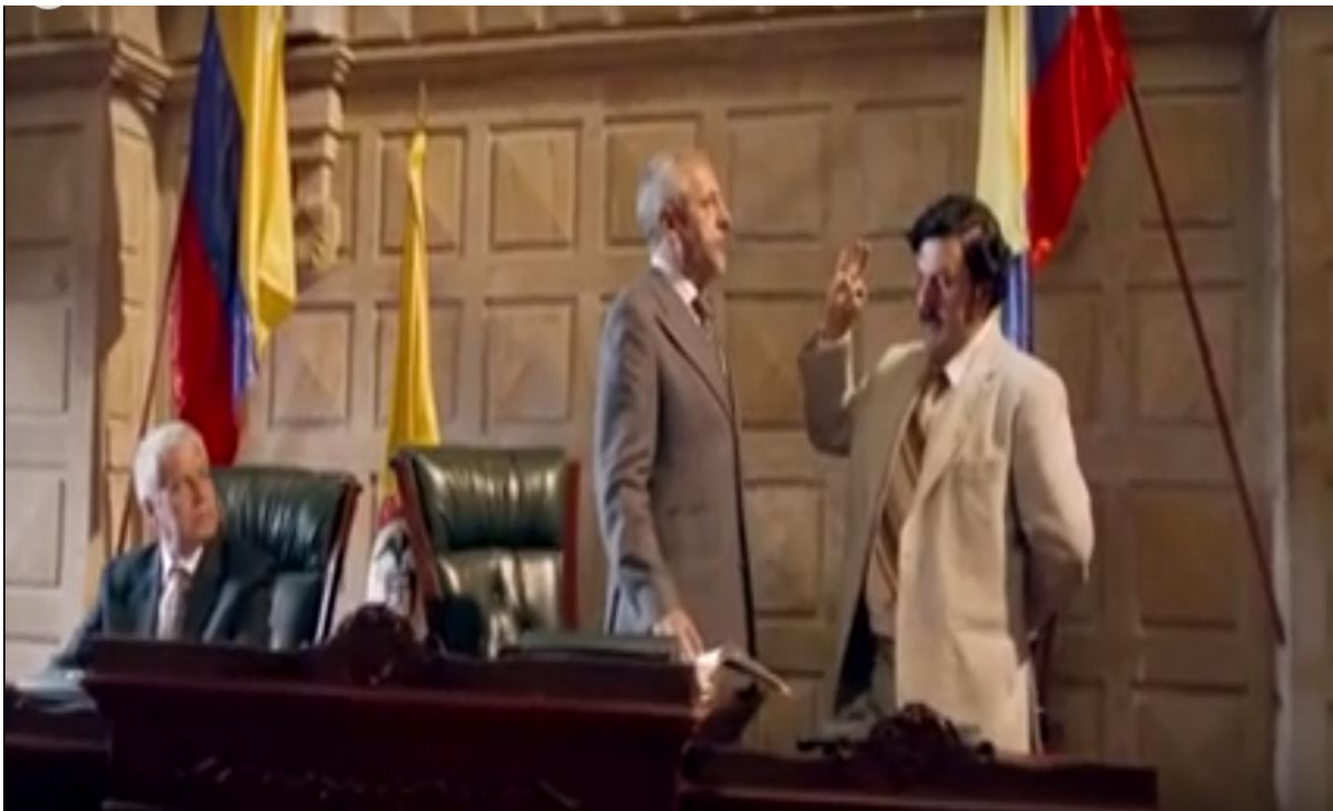
Imagen 4. Pablo Escobar tomando posesión de su cargo como diputado.

En 1982, la serie muestra cómo Pablo Escobar logró obtener una votación suficiente para llegar a ser diputado suplente de la asamblea antioqueña. En la imagen 4 se evidencia el momento en que Escobar realiza su juramento de diputado.