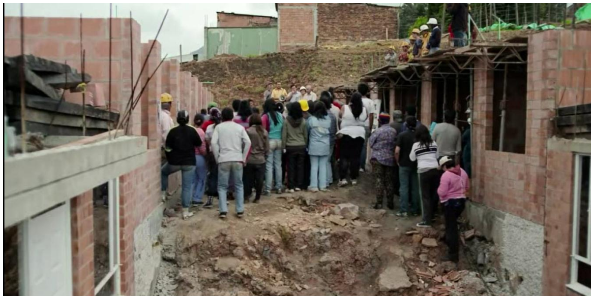
Imagen 2. Escobar entrega casas a familias de escasos recursos en Medellín en Escobar, el patrón del mal, capítulo 11

En la imagen 2 se puede ver una escena de la serie en la que Escobar entrega casas a personas de bajos recursos, así como fichas para que reclamen elementos faltantes, como ventanas, puertas o pisos.