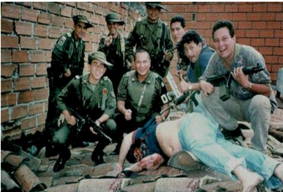
Imagen 9. Imagen publicada en medios de comunicación de la muerte de Pablo Escobar.

La imagen de violencia contrasta con la sonrisa de los miembros del bloque de búsqueda, que finalmente habían logrado cumplir el objetivo final: dar muerte al líder del cartel de Medellín y al narcotraficante más buscado en el mundo. Para finalizar este análisis sobre la memoria colectiva, se puede decir que los medios de comunicación generan un conjunto de imágenes, que a su vez se van convirtiendo en una memoria colectiva. Dichas imágenes ayudan a representar un acontecimiento, a recrear la memoria sobre un hecho relevante de una cultura particular. En este sentido, las imágenes presentadas en las series vinculan los acontecimientos más importantes, a través de unos pocos rasgos que develan un fenómeno social complejo.