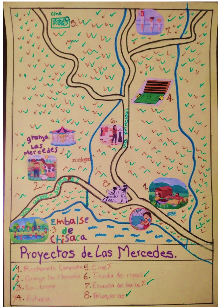
Ilustración 10 Plano Proyectos Las Mercedes

(Fuente propia, Vereda las Mercedes, Usme, Bogotá, 2019)