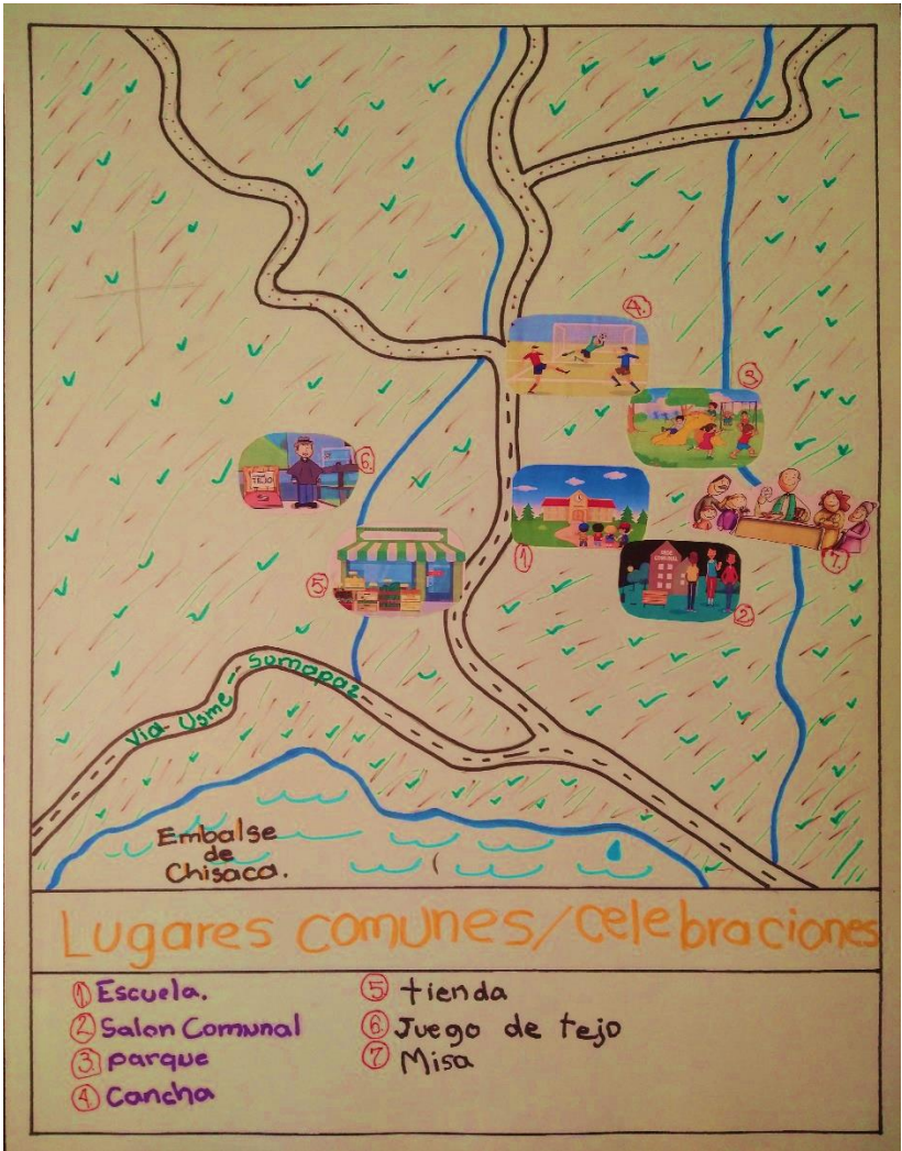
Ilustración 9 Plano Lugares comunes, Celebraciones

Contiguo a la escuela se encuentra una tienda, la cual es el punto de abastecimiento de abarrotes y productos de primera necesidad, así como recargas de celular y llamadas. Además, esta tienda es un punto de encuentro los fines de semana para compartir algunas cervezas, cantadas y juego de tejo o rana, momentos que luego de las largas jornadas de trabajo arduo en el campo se esperan a manera de recompensa.