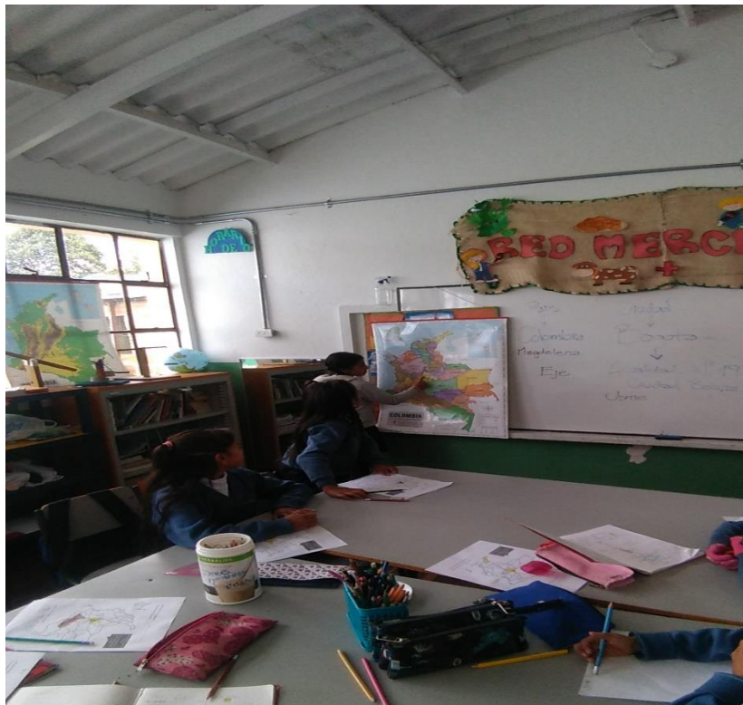
Ilustración 4 Desarrollo de talleres

La sistematización está enfocada en el proceso de construcción de los planos veredales que dejo como producto final ¡A Mapear! Los cuales son 5 planos que dan cuenta de algunos aspectos que entre los niños y niñas decidieron que eran importantes dar a conocer y que se vinculan de manera acertada con la idea de enunciar para revalorizar el territorio.