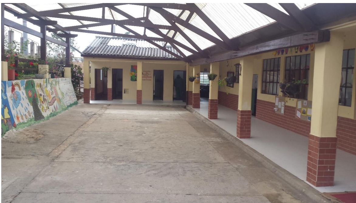
Ilustración 1 Patio Escuela las Mercedes

Actualmente la escuela está bien dotada en lo concerniente a infraestructura, cuenta con dos aulas, una cocina (utilizada antiguamente por el docente tenía que quedarse debido al difícil acceso de la vereda) dos baterías de baño, cancha, parque, y se está incorporando un invernadero para fines formativos, hay una zona de prado y en el mismo predio se encuentra el salón comunal, lo que hace que la escuela sea el punto de referencia y de encuentro de la comunidad.