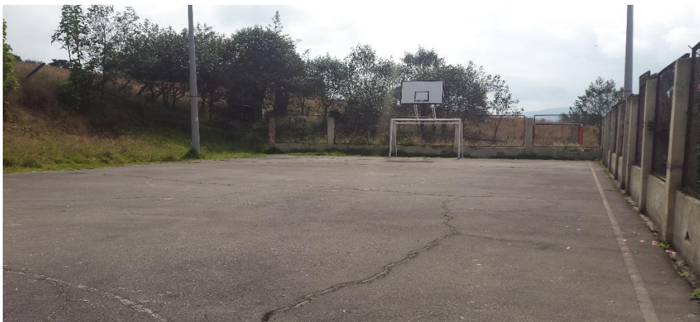
Ilustración 2 Patio, Cancha de Juegos