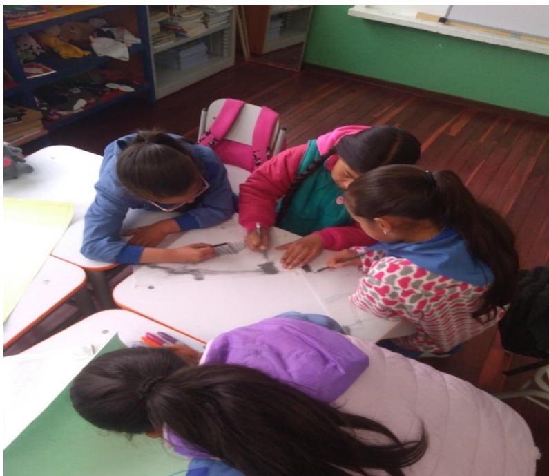
Ilustración 5 Construcción de Mapas

La manera de representación de los diferentes aspectos en los mapas fue acordada con los niños y niñas quienes determinaron que para que se entendiera mejor cada mapa era mejor usar dibujos impresos, porque creen que no son tan habilidosos para dibujar y esto hacia que los mapas no quedaran bien. Por ende,