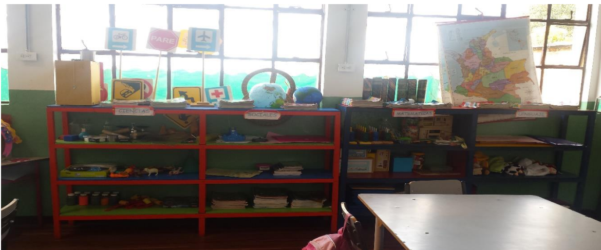
Ilustración 3 Materiales de clases, ciclo 2