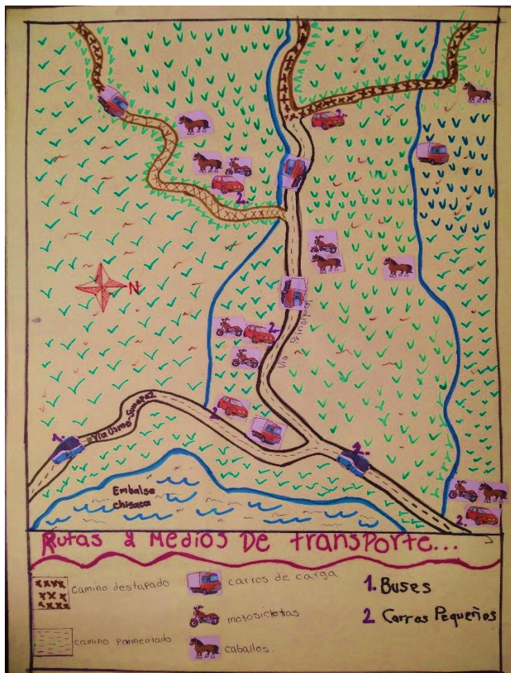
Ilustración 8 Plano Medios de Transporte.

Este taller sirvió para analizar que la adquisición de algún tipo de vehículo por parte de los habitantes de la vereda es muy importante para su status, es decir, el vehículo sea cual sea su función (transporte de carga, movilización entre veredas, salidas a la parte urbana de Usme, etc.) representa una buena racha de negocios o bonanza en la economía familiar. Es motivo de orgullo en los niños decir que sus padres tienen tal o cual vehículo. Los vehículos que se pudieron referenciar fueron: Camiones de carga, carros pequeños, motocicletas, carros cisterna para transportar la leche, tractores, buses, bicicletas.