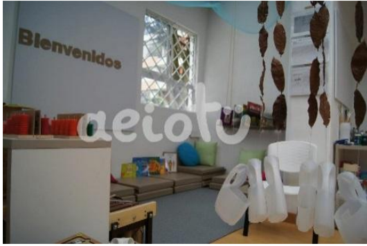
Tomada en Centro AeioTU Nogal (2013) Rincon de arte