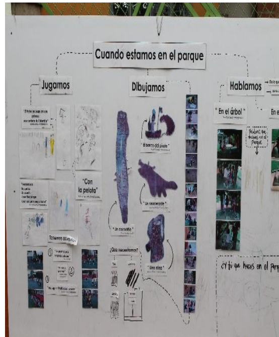
Tomada en: AeiOTU Orquideas de suba (2012)

Así mismo las documentaciones se usan para enriquecer al ambiente de cada uno de los Centros AeiOTU, pues es un medio que posibilita contar y mostrar experiencias o momentos que viven no solo los niños y las niñas, sino también otros actores (maestras, artistas, padres, comunidad) que están inmersos en las dinámicas que se dan diariamente en cada Centro. De esta manera, para nosotras era una herramienta muy útil, ya que pudimos conocer qué se realizaba con los niños y las niñas para considerar qué podríamos proponer en nuestra práctica.