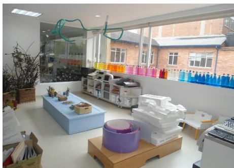
Tomada en el Centro AeioTU Nogal (2013)

Los ambientes de los Centros: estos deben invitar al juego, a la exploración, al asombro y a la investigación. Deben ser estéticamente armoniosos y reflejar las identidades de quienes lo habitan. Los Centros AeioTU cuentan con diversos ambientes y espacios organizados en aulas y áreas construidos por los niños y las maestras. Estos ambientes responden claramente a la idea que tiene los Centros de un niño y una niña protagonistas de sus propios procesos y se establece el ambiente como un tercer maestro. En cada aula hay dos maestras que son las encargadas de mediar las experiencias que los niños y las niñas tienen en los espacios con los diversos elementos que están dispuestos en ellos.