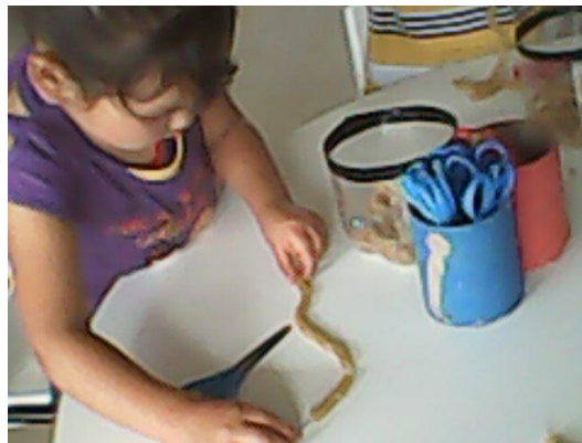
Tomado en Centro AeioTU Orquídeas de suba (2013)

Algunas veces es necesario que la documentación de determinada experiencia que el niño o la niña realizó esté acompañada de una producción, como lo cuenta la artista residente “es importante que una documentación se sustente por ejemplo desde, si está demostrando un proceso de desarrollo de un niño, gráfico, por ejemplo chévere que esté la producción que el niño hizo o el proceso del niño” (E 2, Pregunta 9) Es decir esta producción puede ser un dibujo, una creación en plastilina o en algún otro material, para que así tanto él, como las maestras, como sus familias conozcan y reconozcan ese trabajo que se hizo, que sea algo que pueda verse, tocarse y admirarse dándole valor al mismo y siendo un apoyo para el posterior análisis y reflexión por parte de las maestras y de los mismos niños y niñas.