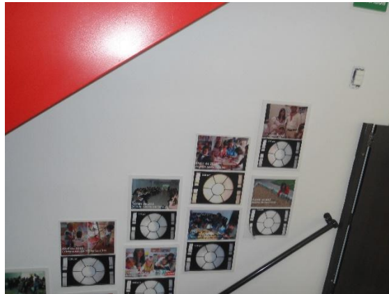
Tomada en: Centro AeioTU Nogal (2013)