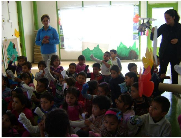
Tomada en Centro AeioTU Orquídeas de Suba (2013)

Algunas veces es necesario que la documentación de determinada experiencia que el niño o la niña realizó esté acompañada de una producción, como lo cuenta la artista residente “es importante que una documentación se sustente por ejemplo desde, si está demostrando un proceso de desarrollo de un niño, gráfico, por ejemplo chévere que esté la producción que el niño hizo o el proceso del niño” (E 2, Pregunta 9) Es decir esta producción puede ser un dibujo, una creación en plastilina o en algún otro material, para que así tanto él, como las maestras, como sus familias conozcan y reconozcan ese trabajo que se hizo, que sea algo que pueda verse, tocarse y admirarse dándole valor al mismo y siendo un apoyo para el posterior análisis y reflexión por parte de las maestras y de los mismos niños y niñas.