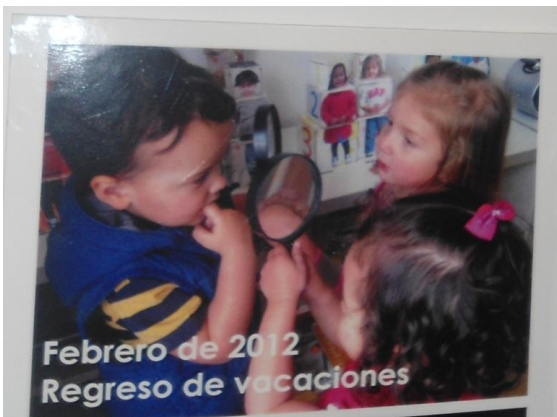
Tomada en: Centro AeioTU Nogal

plantea que “Los niños pueden verse a sí mismos en una nueva luz, revisar y reinterpretar sus propias experiencias de los eventos en los que ellos eran los protagonistas. Este tipo de proceso produce nuevas dinámicas cognitivas” (Pág. 11, proyecto educativo); es decir cuando los niños se acercan y conocen esas documentaciones de las que ellos han hecho parte, y reviven ese momento recordando lo que pasó, ¿cómo pasó?, ¿qué hicieron?, esto les da la posibilidad de repensar las cosas, de analizar y reflexionar acerca de cómo actuaron en ese momento, los lleva a cuestionarse y a evocar recuerdos, sensaciones, emociones que se presentaron ahí.