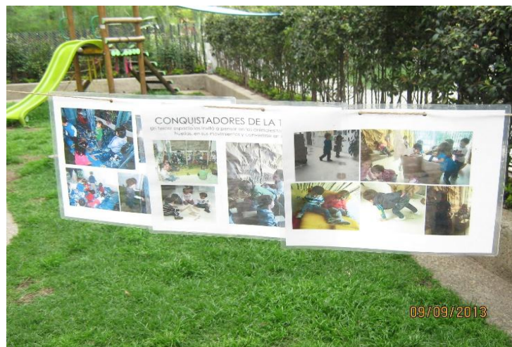
Tomada en el Centro AeiOTU Nogal

Lo importante de la documentación es que no se centra en los productos finales, sino que da prioridad a los procesos de los niños y las niñas, de las maestras y las artistas residentes; es una memoria viva y visible de las experiencias que se dan en la escuela. respecto a esto Hoyuelos (2006) afirma que “La documentación fotográfica hace públicos, y por tanto, confrontables e intercambiables los procesos observados y recogidos” (Hoyuelos, 2006, P. 199).