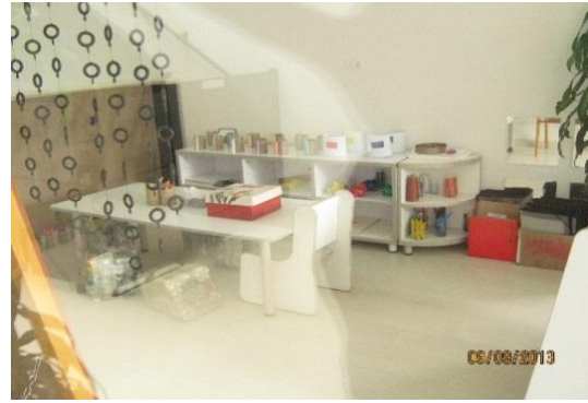
Tomada en Centro AeioTU Nogal (2013) Rincón de lectura