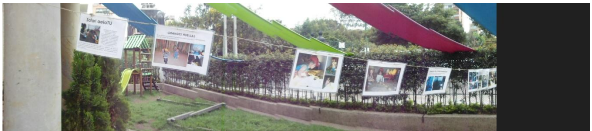
Tomada en: Centro AeioTU Nogal (2013)

Por otro lado vemos la mirada que tiene la artista residente numero 2 frente a la documentación, quien dice,