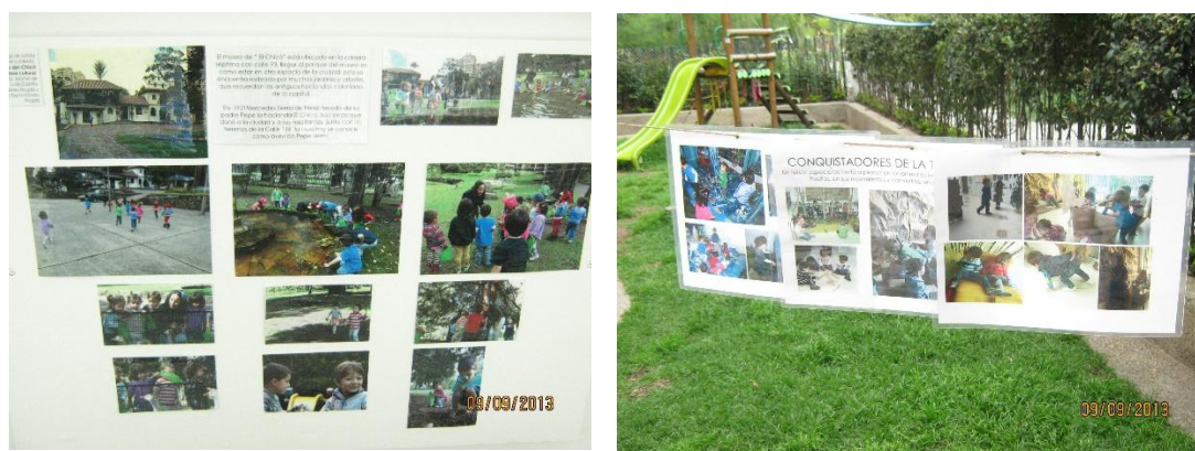
Tomado en: en el centro AeioTU Nogal (2013)