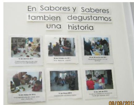
Tomado en: Centro AeioTU Nogal (2013)