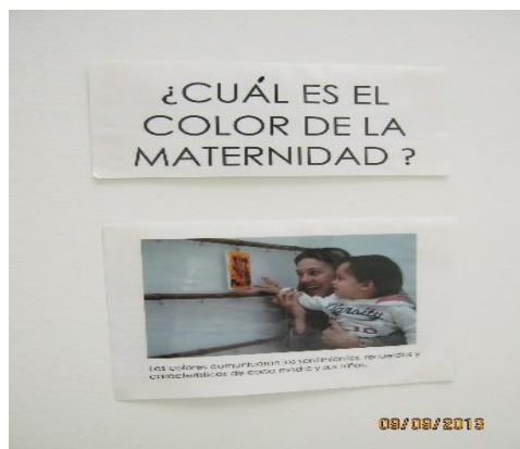
Tomadas en Centro AeioTU Nogal (2013)

“la manera materializarlo, no necesariamente es una fotografía, puede ser una frase, una palabra, un texto, algo de audio, video, lo que sirva para visualizar algo que sucedió” (E 2, Pregunta 2).