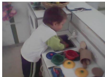
Tomada en el Centro AeioTU Orquídeas de Suba (2012)

Es importante que cada aula esté dividida en rincones en donde los niños y las niñas pueden actuar desde sus intereses; de ahí que cada aula refleje las características propias de los grupos que las habitan. Dichos rincones surgen de los intereses de los niños y las niñas