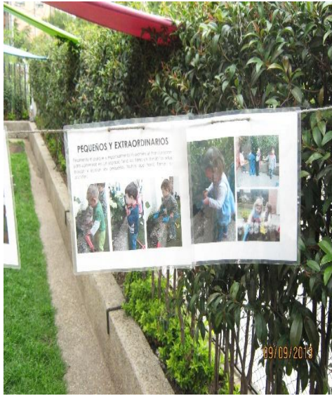
Tomada en el Centro AeioTU Nogal (2013)

Para cualquier documentación el principio básico es la observación, puesto que un