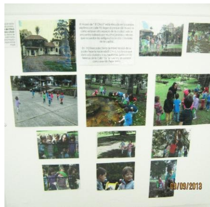
Tomada en: Centro AeiOTU Nogal (2013)