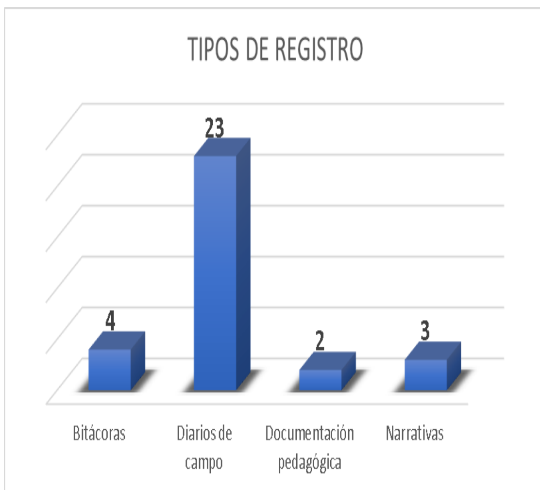
Ilustración 1: tipos de registro

narrativas y documentación pedagógica. A continuación, se presentan dos gráficas; la primera, con la correspondiente cantidad de cada uno de los registros analizados y la segunda, con la distribución del tipo de registro por escenario, de esos escritos recolectados