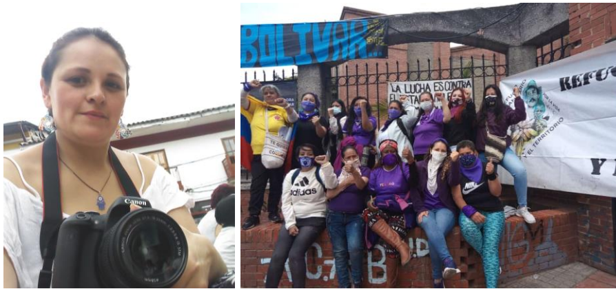
“Participación Levantamiento Social y Popular 2021 mujeres Ciudad Bolívar”