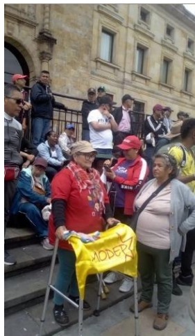
Plaza de Bolívar, Marcha 1ro de mayo