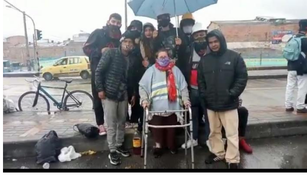
Recibimiento a la minga a Indígena Estallido social, Portal Molinos sur de Bogotá