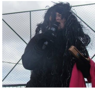
Presentación el Mohán Festival Mujeres, Luz vida y Paz.