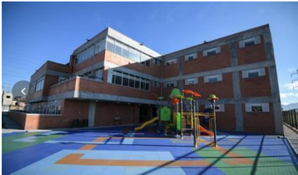
Imagen 1. (Institución Aquileo Parra sede Verbenal)

Vale destacar que la institución también cuenta con todos los servicios públicos (agua, luz, gas natural, teléfono), además de shut de basuras, cuarto de bombas para llevar agua potable y un depósito de aguas lluvias con detector.