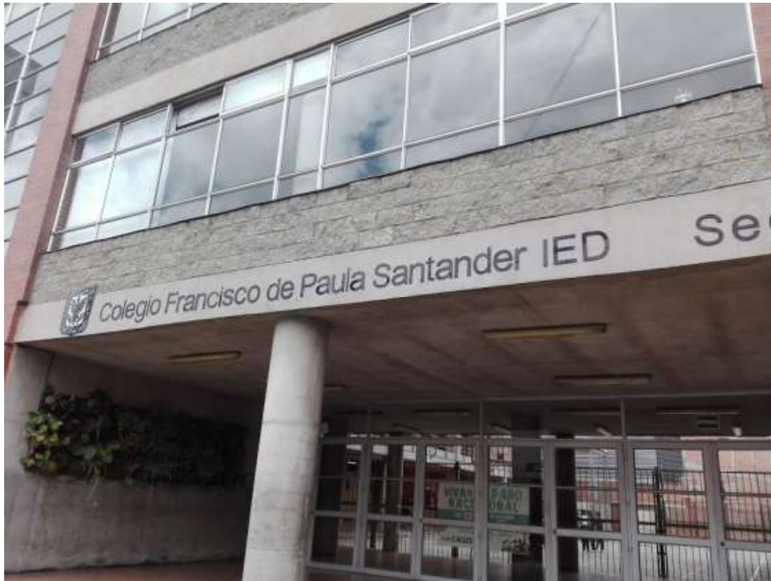
Ilustración 2. Elaboración propia (Imagen Institución Educativa)