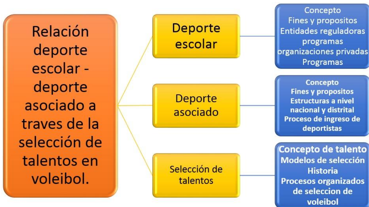
Figura 1. Mapa conceptual