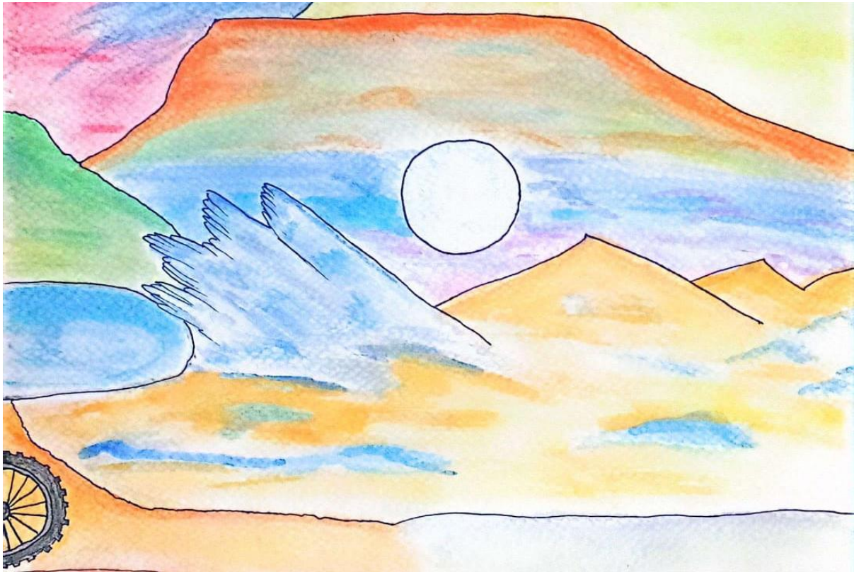
Acuarelafiti 3. Voy y vengo (segmento 3)

lugares y que han tomado un especial significado en mi vida.