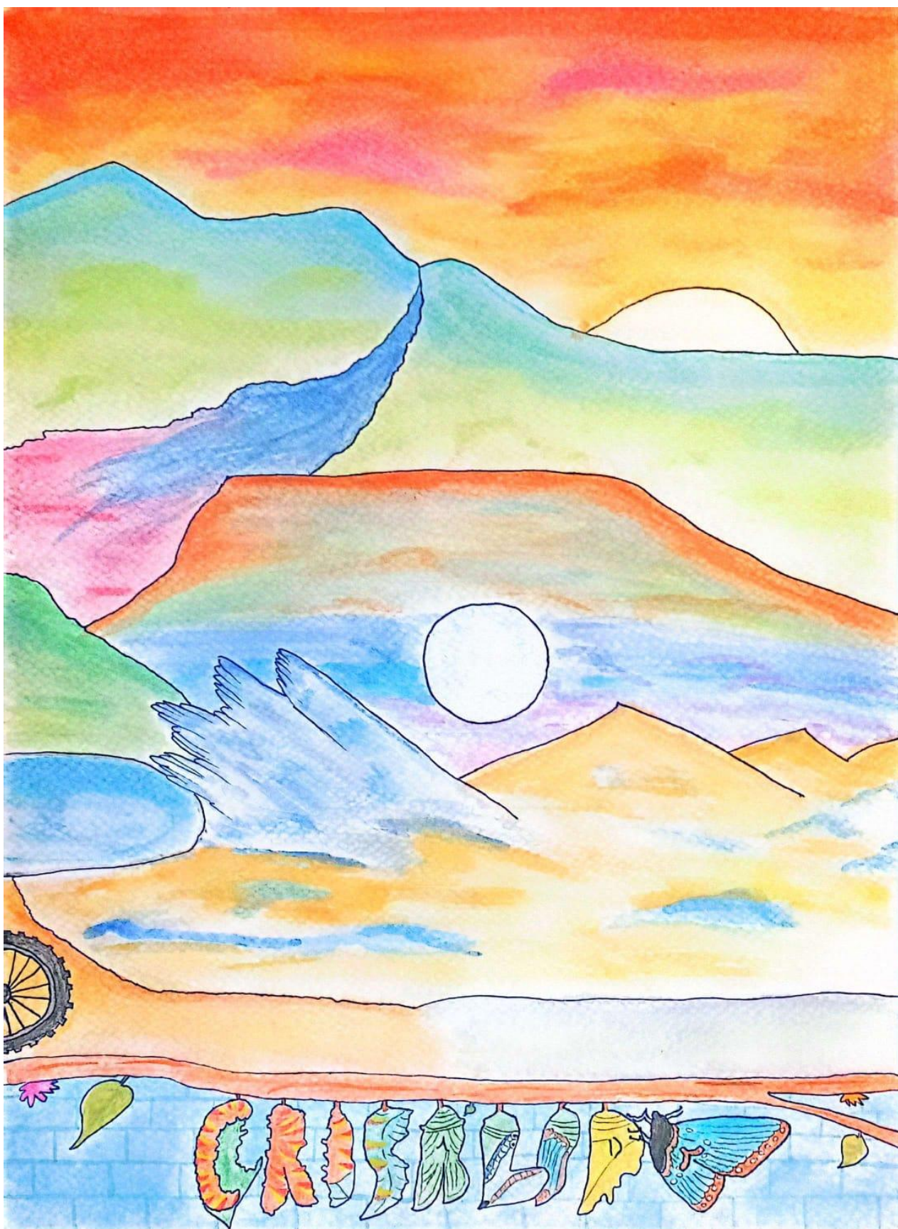
Acuarelafiti 5. Voy y vengo (imagen completa)