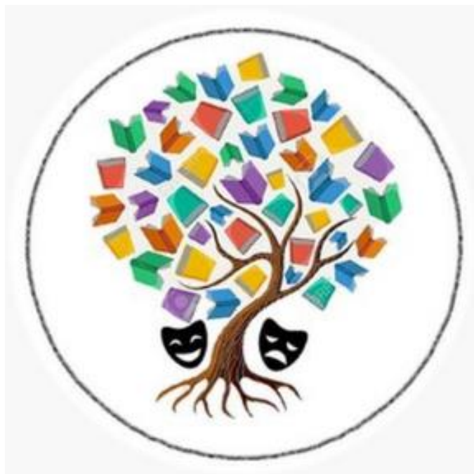
Collage 4. Una personería cultural

pretendía proponer una personería cultural. La clasifico en la técnica de collage, pues es un montaje de tres imágenes: círculo, árbol y las máscaras del teatro. Con esta imagen resumía mis propuestas e intereses y también quién era yo como persona una estudiante que se interesaba por fortalecer la cultura por el desarrollo de las Artes dramáticas y por la lectura.