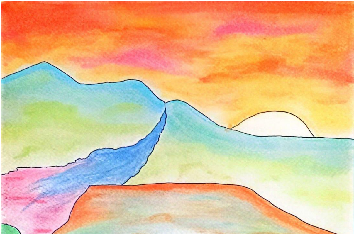
Acuarelafiti 2. Voy y vengo (segmento 2)