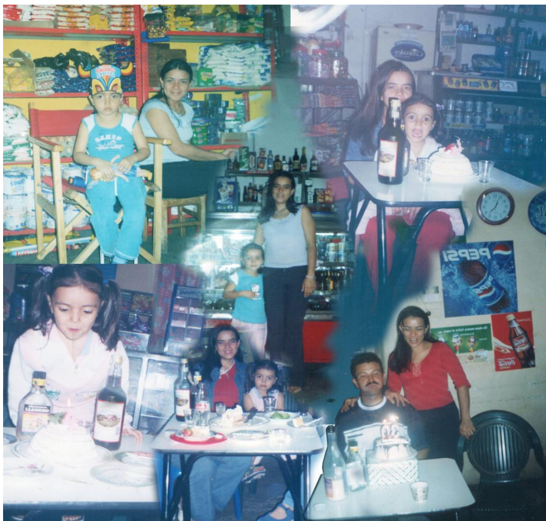
Collage 2. La esquina del Llano

La tienda era nuestra sala y lo ha sido por muchos años, en mi configuración sobre tener una sala y un comedor en casa como muchas familias normalmente han tenido esa posibilidad, para mí ha sido una opción escasa y fugaz, cada vez que visito alguna casa aprecio con especial detalle sus salas y comedores.