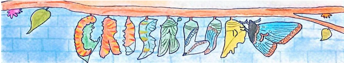
Acuarelafiti 4. Voy y viento (segmento 4)

El nombre Acuarelafiti debe su hibridación a acuarela y grafiti, debido a que la técnica que empleo para crearla es con acuarelas y porque en la parte inferior de la obra, asemejo a pequeña escala un muro en el que diseño en grafiti mi seudónimo. Una palabra con sus letras deformadas o más bien transformadas que representan la metamorfosis de larva, crisálida y mariposa. Crisálida es el seudónimo principal con el que me identifico.