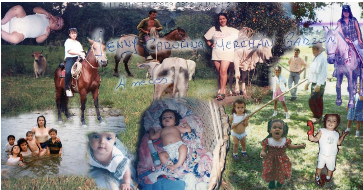
Collage 1. La Esperanza

Con el ánimo de ser coherente con mi propuesta de aterrizar y contextualizar aquello de lo que se habla. A continuación, nos encontraremos con un collage titulado La Esperanza, que hace parte del Poetafolio , el cual es un montaje fotográfico en el que diseño una representación visual compuesta de varias imágenes, para este caso fotografías de la época en la que mi familia vivía en el llano. Principalmente, el contexto de la cotidianidad de mi madre en el campo, transitando lugares como la finca en la que ella se crió y el río Ariari, así como también mis primeros meses y años de vida en la misma finca, su nombre: La Esperanza. Estas fotografías componen el álbum familiar que por años crecí observando y preguntando por las historias allí capturadas, estos fueron los primeros elementos que soportaban las versiones de mis padres alrededor de nuestras raíces llaneras y lo que ahora comparto como parte de mis memorias.