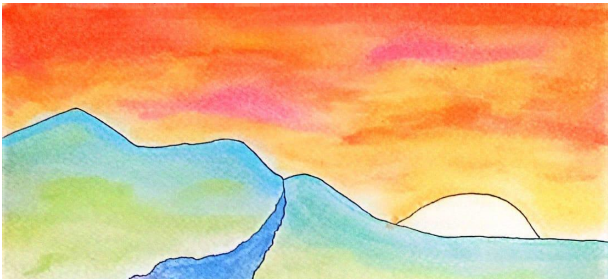
Acuarelafiti 1. Voy y vengo (segmento 1)

Les invito a recorrer uno de los paisajes tomado del fragmento inicial de mi propuesta de Acuarelafiti denominada Voy y Vengo , alojada en el Poetafolio . Con la técnica de pintura en acuarela retrato algunos de mis contextos geográficos. Para este caso, mi imagen del piedemonte llanero con el nacimiento del cauce del río Ariari, arropados bajo el sublime manto del atardecer llanero: