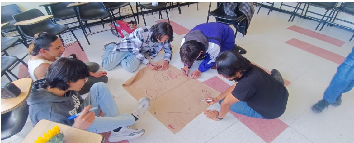
Fotografía 1. El proceso: cartografía filosófico-Contextual

A continuación, comparto el proceso de un taller que resultó en una creación experimental colectiva que construimos entre un docente y algunos estudiantes de la Licenciatura en Filosofía de la UPN para el I Coloquio de Filosofía de la licenciatura en el 2024. Este taller lo propuse desde la mesa de Filosofía en contexto , al que nombré Cartografía Filosófica Contextual . Allí, entre lxs participantes reflexionamos sobre nuestro origen geográfico, nuestras influencias sociales y culturales, luego sobre qué tanto nuestros contextos aportan en las clases de Filosofía. Por último, conseguimos acuerdos para plasmar colectivamente un paisaje en el que cada uno de los integrantes dibujara en papel craft su respuesta a la pregunta: ¿Cómo y de qué manera te gustaría enseñar-aprender Filosofía? Las respuestas fueron: En el barrio, en la montaña, en bicicleta, en el pueblo, con música y en el bosque.