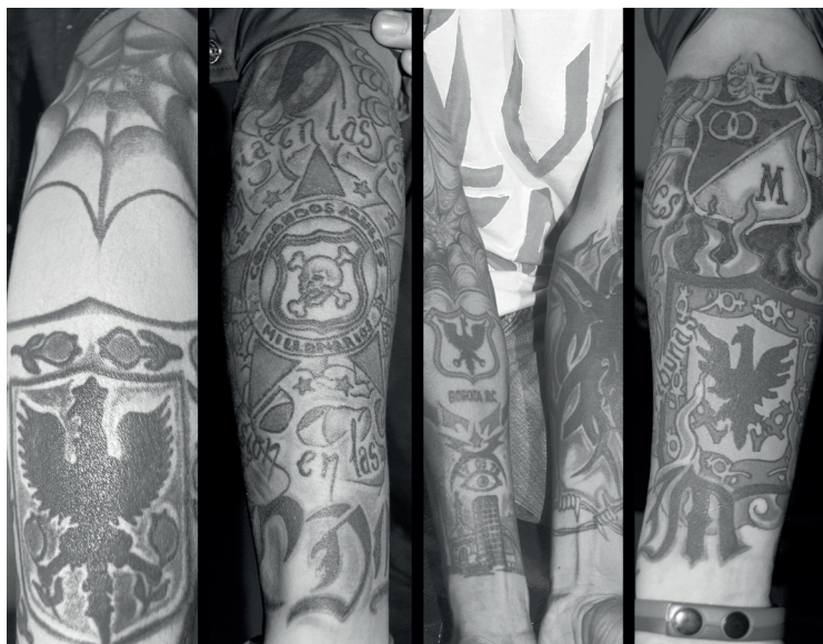
Figura 8. Mi segunda piel