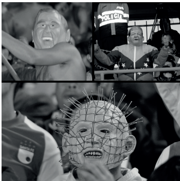
Figura 5. Bush de Millonarios y Chávez de Santa Fe