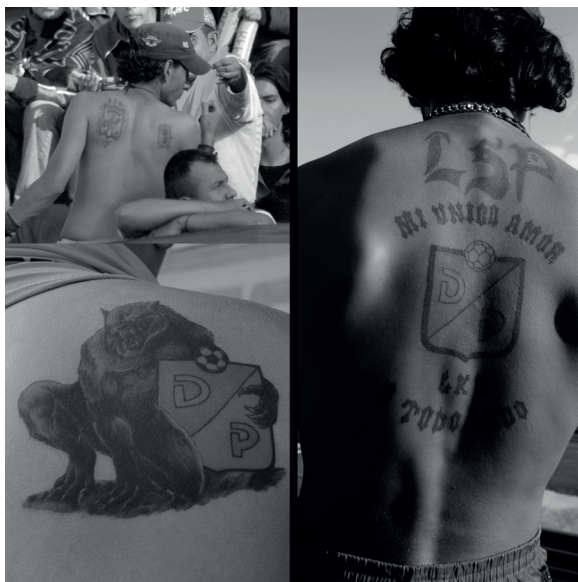
Figura 10. La pasión tatuada