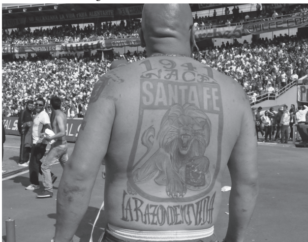
Figura 9. La razón de mi vida