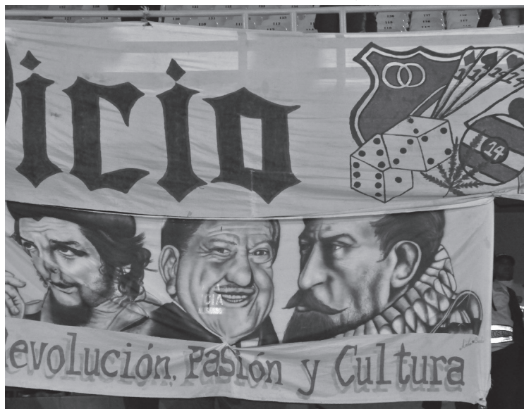
Figura 6. Vicio, revolución, pasión y cultura