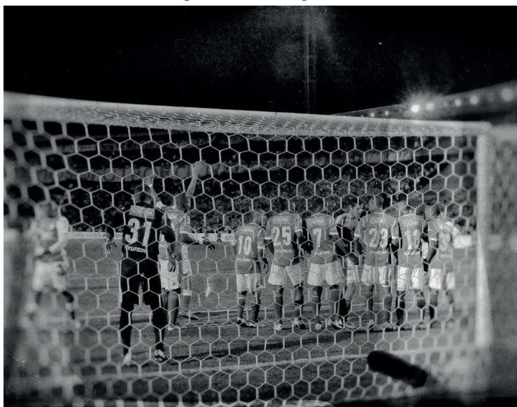
Figura 1. Clásico capitalino