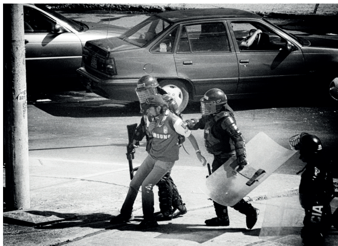
Figura 11. La fuerza de la ley