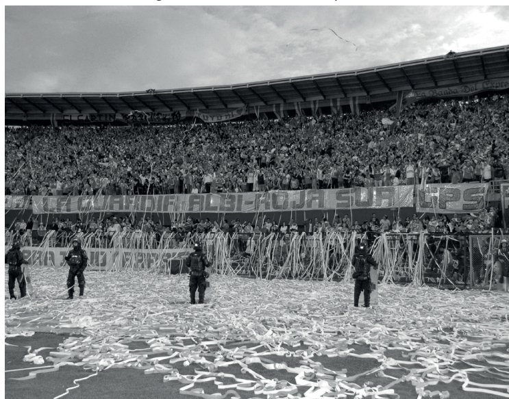
Figura 3. La Guardia Albi-Roja Sur