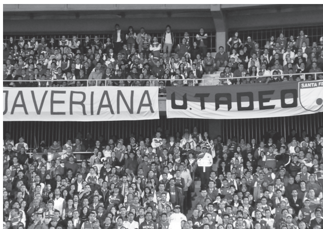
Figura 7. Instituciones