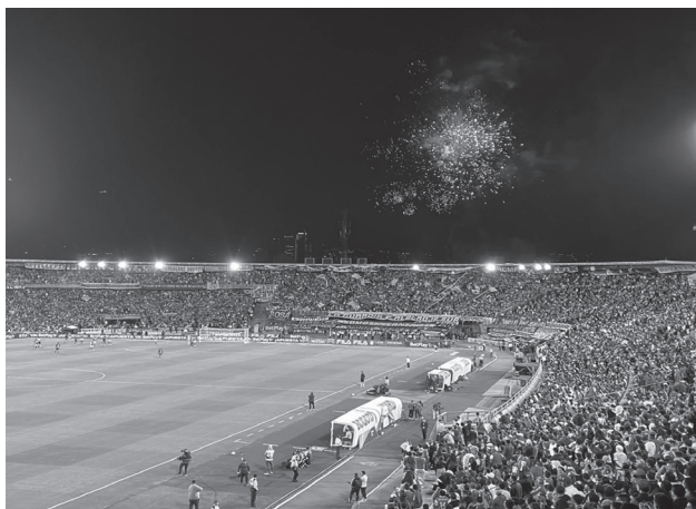
Figura 18. Pirotecnia