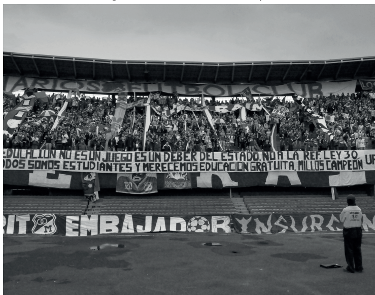
Figura 2. No a la reforma a la Ley 30