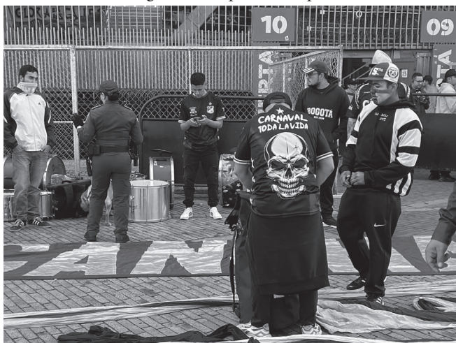
Figura 17. Preparando trapos