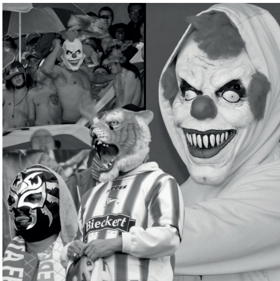
Figura 4. Máscaras