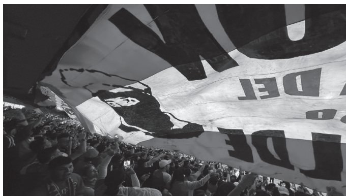
Figura 15. Pasión rebelde