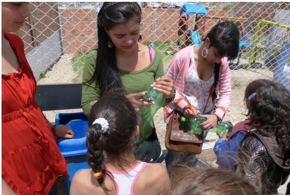
Fotografía 11 Más allá del aula

Debe ser consciente que vivimos en una sociedad dividida en clases y que la educación tradicional hace parte de la estructura que perpetúa ese tipo de relaciones, en ese sentido el futuro maestro debe trascender lo tradicional, con propuestas pedagógicas alternativas e innovadoras que cambien el sentido de la educación actual.