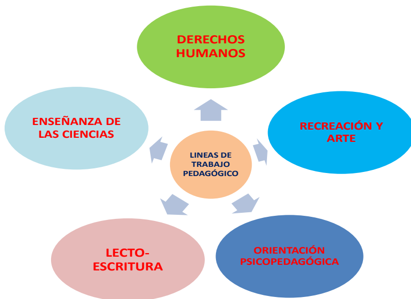
Grafico 42 Líneas de Trabajo