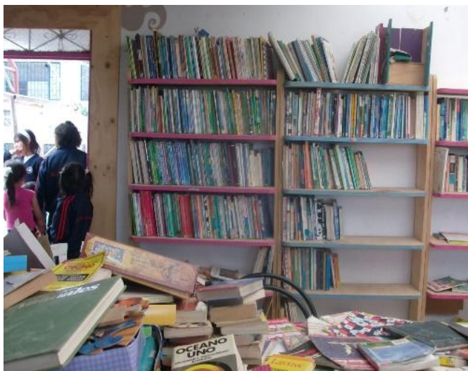
Fotografía 10. Biblioteca Escuela fe y Esperanza

buscando acercar los futuros maestros a experiencia y conocimiento sobre la población popular como posible campo de acción.