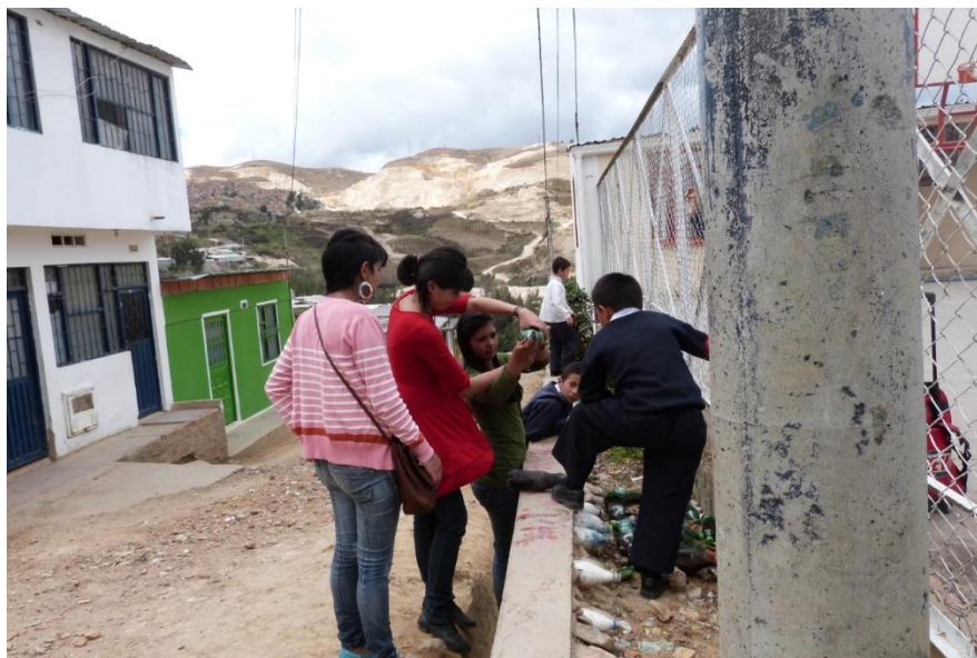
Fotografía 1 Maestras en formación enseñando desde la Biología

De esta manera, se puede entender en la práctica pedagógica, la labor del docente no es una tarea fácil, no se puede desconocer la realidad propia y particulares que tienen las diferentes instituciones educativas, en este sentido es importante que el maestro en formación reconozca esa gran variedad de espacios, sujetos y dinámicas propias e internas, que son los maestros los llamados a asumir y proponer alternativas de transformación de estas relaciones para orientar y potenciar los imaginarios de vida que tienen los diferentes sujetos. Estos sujetos (niños y jóvenes y muchas veces adultos) llegan a las instituciones con sus problemas, esperanzas, sueños, llegan con su contexto, familia y amigos, en donde muchas ocasiones lo menos que quieren es estar dentro de un salón encerrados aprendiendo un conocimiento específico que no le responde sus propias preguntas ellos quieren aprender a vivir ellos quieren aprender a tener otros imaginarios de vida y debemos estar preparados para ello.