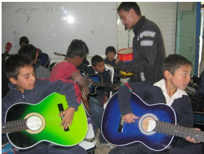
Fotografía 9. Enseñar desde la diversidad

El proceso de formación de los maestros en el trabajo pedagógico en muchos casos termina siendo un espacio que se limita a trabajar dentro del aula de clase, sin vivenciar la realidad que ofrece el contexto donde se desenvuelve, sin entender que los actores que confluyen en estos espacios viven una realidad que reflejan en sus comportamientos y actitudes frente a la clase y que terminan siendo determinantes para avanzar o frenar los procesos educativos. El trabajo pedagógico en contextos vulnerables faculta al maestro en formación fortalece y amplía la mirada sobre su papel dentro de la sociedad reflexionando sobre como las diferencias económicas sociales y culturales y como estas inciden en el comportamientos y actitudes de los niños dentro de una institución educativa, en este sentido es fundamental que el maestro en formación reconozca y entienda el origen de las contradicciones propias de los territorios donde realice su ejercicio práctico, y a su vez que realice propuestas pedagógicas acordes a los intereses y necesidades de la población.