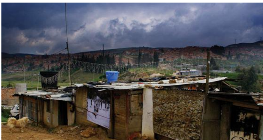
Fotografía 3 Cazuca y sus alrededores

departamentos y en particular las ciudades más grandes como lo son Bogotá, Medellín, Cali, Barranquilla, Cartagena, Tumaco, Turbo en estas ciudades se evidencia un proceso constante de llegada de población desplazada que empiezan a pertenecer a las periferias de las ciudades, en las cuales son más evidentes las condiciones de vida nefastas de sus residentes como lo son el desempleo, la mendicidad, exclusión, discriminación falta de oportunidades educativas acordes a su condición socio cultural, situación que se le impone a los jóvenes, niños, niñas de estas familias desplazadas, quienes tiene que adaptarse a las instituciones educativas que no tiene en cuenta sus saberes tradicionales, y se ven enfrentados a la perdida cultural, la desconfiguración de la identidad e interminables violaciones de derechos humanos entre otras.