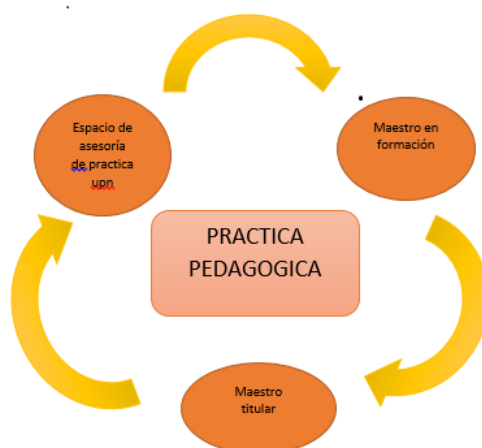
Gráfico 1. Relaciones que interactúan en el proceso de práctica

De acuerdo al gráfico anterior, hay tres actores que cumplen una función muy importante dentro de la práctica pedagógica que no necesariamente deben estar interactuando simultáneamente, ya que en la práctica existen diversos espacios de interacción que fortalecen los procesos pedagógicos que suceden desde la experiencia.