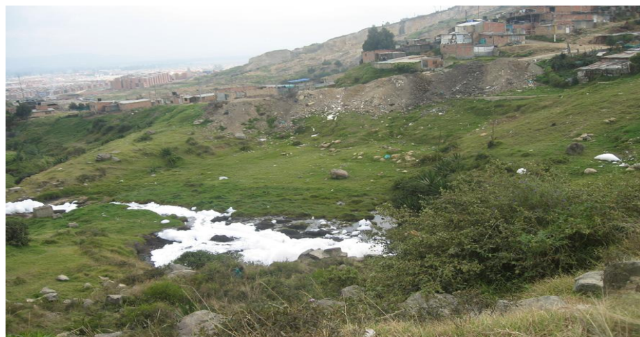
Fotografía 4 Cazuca y los alrededores