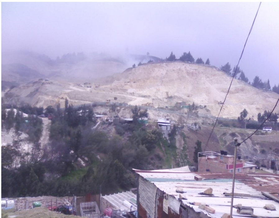
Fotografía 5 Cazuca y sus alrededores

Con respecto a los servicios públicos, el acueducto no es un servicio que se obtenga de manera legal y continua, por lo que los habitantes han diseñado una forma de tener un fácil acceso al agua mediante el “chuce de mangueras” 34 de un tanque de agua cercano recurso que utilizan cada quince días pagando a una persona para que abra el suministro desde el tanque, este proceso dura aproximadamente tres a cuatro horas. Para la recolección de basuras, es común encontrar en las calles unas casetas que sirven de recolector temporal. Sin embargo en la mayoría de ocasiones la basura se encuentra acumulada en las calles y hasta en las mismas casetas, evidenciando una deficiencia en su manejo 35 .