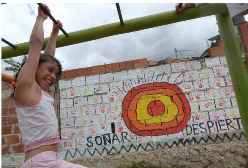
Fotografía 8. Soñar despierto

Los niños de la escuela Popular Fe y Esperanza se caracterizan por sus ganas de aprender algo nuevo, de poder compartir con sus compañeros momento de felicidad, basados en el aprendizaje dado por los diferentes estudiantes de las universidades e instituciones, quienes elaboran estrategias fundadas en las necesidades de los grados asignados, se elabora un trabajo cooperativo entre las necesidades de los niños para aprender y los aportes que puede dar cada estudiante universitario. Como se mencionaba anteriormente los niños que asisten a la escuela, son niños del mismo barrio hijos de padres desplazados y de bajos recursos económicos, ellos se caracterizan por que a diferencia de muchos niños que pueden acceder a escuelas distritales o privadas y que no quisieran estar en ellas, es decir evaden clases sacan cualquier pretexto para no asistir a la escuela o simplemente van por que les toca; estos niños que van a la escuela Popular Fe y Esperanza, son niños que en verdad quieren estar allí y se les nota el querer obtener conocimiento. Se ha observado varios talentos en muchas disciplinas pero por su condición social son invisibles, sin embargo los docentes que asisten a la escuela tratan en lo posible de hacerlos participes de las diferentes actividades que se llevan a cabo en las localidades de Soacha y Bogotá, donde se empieza a reconocer las nuevas estrategias y se reconocen entre sí mismos las capacidades que muchos tienen.