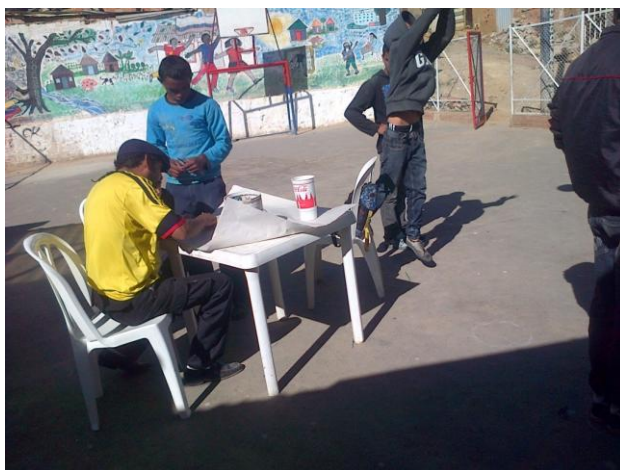
Fotografía 7. El profesor "Don Pájaro"