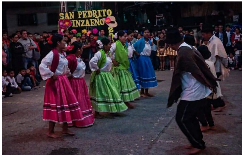
Figura 8 Presentación escuela de danzas.

En el mes de diciembre se organiza la feria comercial agrícola y ganadera, (Figura No.9) donde la comunidad organiza estantes con mercancía perteneciente a la cultura Inzáeña, allí se pueden encontrar artesanías, comidas típicas, remedios caseros, entre otros. Según el plan de desarrollo de Inza.