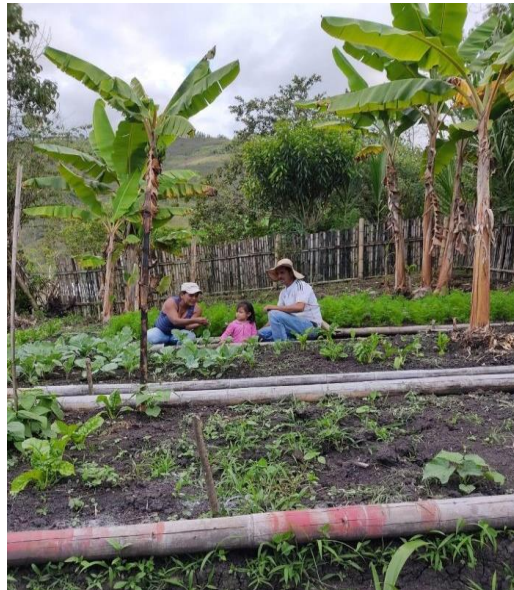
Figura 14 La huerta en familia.

A modo de conclusión, la agricultura de subsistencia desempeña un papel fundamental en la vida de las familias del municipio de Inzá, Cauca, proporcionando no solo alimentos para su consumo diario, sino también una fuente de ingresos complementaria a través de la venta en el mercado de las plazas. A través de pequeñas huertas caseras, las familias cultivan una variedad de productos para garantizar su bienestar y subsistencia, además, la participación activa de los niños y niñas en las labores agrícolas evidencia la transmisión intergeneracional de