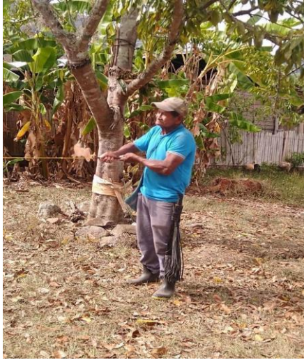
Figura 10 El machete.