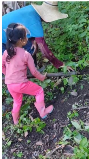
Figura 12 Ayudando a mi familia.