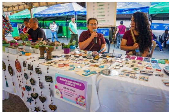
Figura 9 Velada gastronómica y cultural.