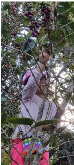
Figura 13 Cogiendo Café.

Para finalizar, los niños y niñas desempeñan un papel fundamental en algunas de las fases del cultivo del café, como se mencionó anteriormente este proceso lleva consigo muchas fases de las cuales se destaca la participación de los infantes en la limpia del café, en la recolección del mismo y en ocasiones en la molida y lavada, aunque su presencia puede ser vista como una contribución al sustento familiar, también se destaca su conexión arraigada con el entorno agrícola. Esta participación no solo fortalece los lazos familiares, sino que también fomenta un sentido de responsabilidad y respeto hacia el trabajo agrícola.