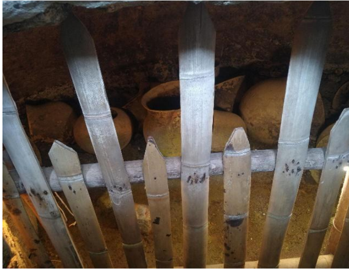
Figura 5 Ollas.