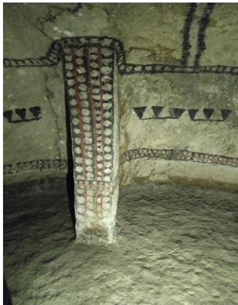
Figura 4 Tumba alto de Segovia. Fuente Medina 2023