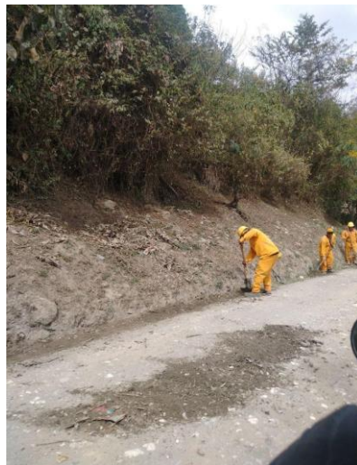
Figura 11 Trabajando la Tierra.

La identidad y cultura campesina en Inzá, Cauca, se nutre de su conexión con la tierra, su diversidad cultural y la preservación de símbolos significativos, lo que crea una identidad sólida