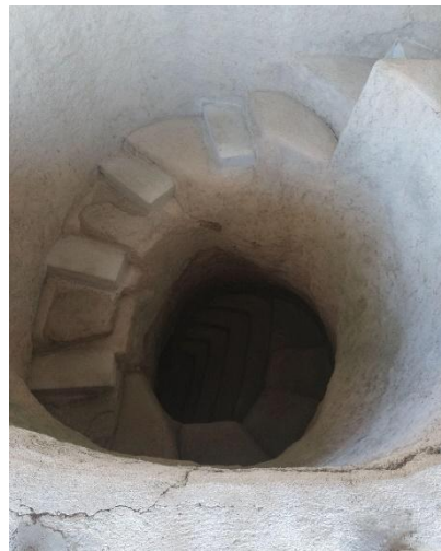
Figura 6 Tumbas subterráneas.

Por otro lado, subiendo la montaña se encuentra con el sitio denominado el Duende, que cuenta con 5 tumbas más, siguiendo la montaña se encuentra el Alto de San Andrés que cuenta con 6 tumbas, más adelante se ubica el Tablón, éste posee 9 estatuas monolíticas, y por último el Alto del aguacate que cuenta con 42 tumbas. Para visitar estos atractivos turísticos se hace por medio