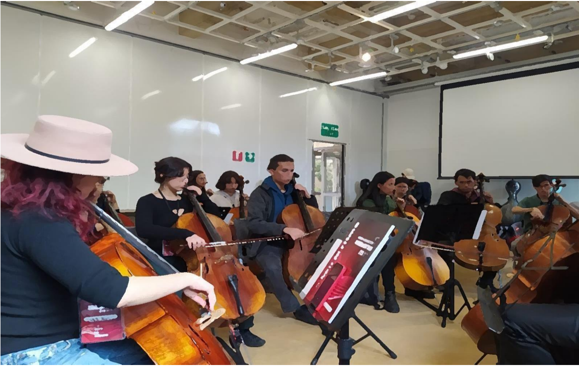
Ilustración 7 Taller de nivel avanzado