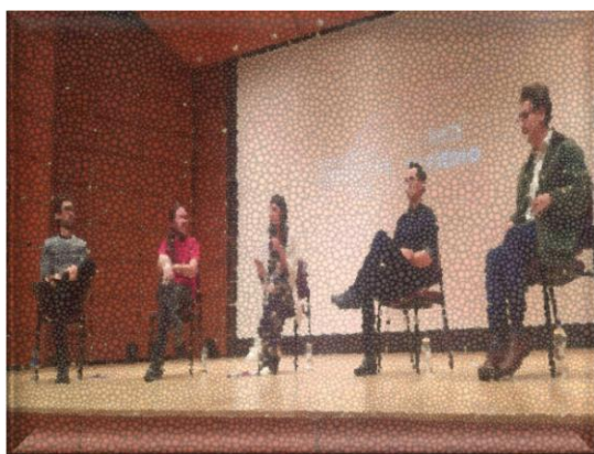
Ilustración 2 charla realizada en encuentro

La idea inicial fue reunir músicos de diferentes rincones del mundo, con diversas trayectorias y experiencias, para crear un espacio donde la música clásica se fusionara con las tradiciones populares. Este enfoque busca redefinir la forma en que la música clásica es experimentada y transmitida, haciendo que sea más accesible y relevante para una audiencia contemporánea, he ir más allá y abarcar otros sectores. El proyecto también tiene como objetivo replantear el papel del músico en la sociedad, no solo como intérprete, sino como un agente de cambio social, capaz de influir en su entorno mediante la creación y difusión de música, así como la formación de educadores. Que se piensen la enseñanza de una forma distinta en la que prima lo emocional, contextual, y social.