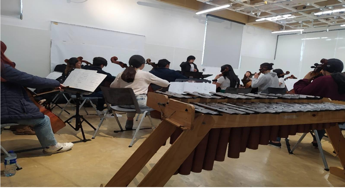
Ilustración 9 ensamble musical, avanzados