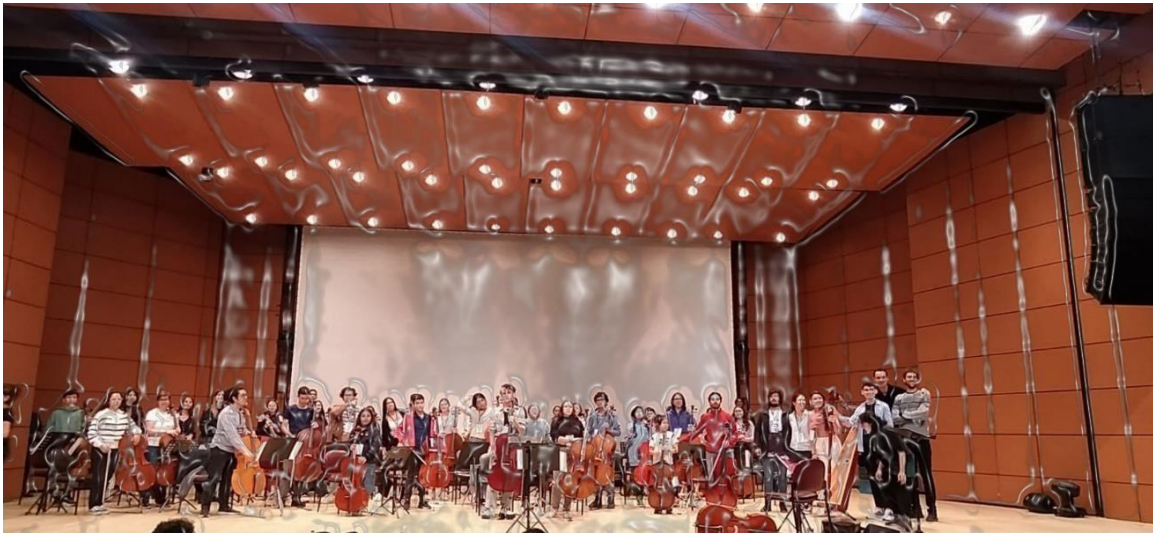
Ilustración 3 Taller de ensamble, nivel intermedios

utiliza como el valioso vehículo para fomentar la reconciliación y el entendimiento entre diferentes culturas y saberes, todos importantes, relevantes, ricos en tradición y significativos. Elemento importante en un mundo cada vez más dividido. La música popular actúa como un lenguaje universal que une.