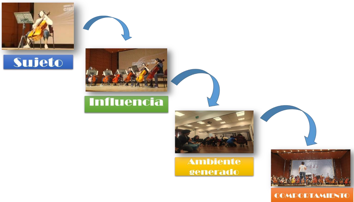
Ilustración 6 La secuencia del aprendizaje social