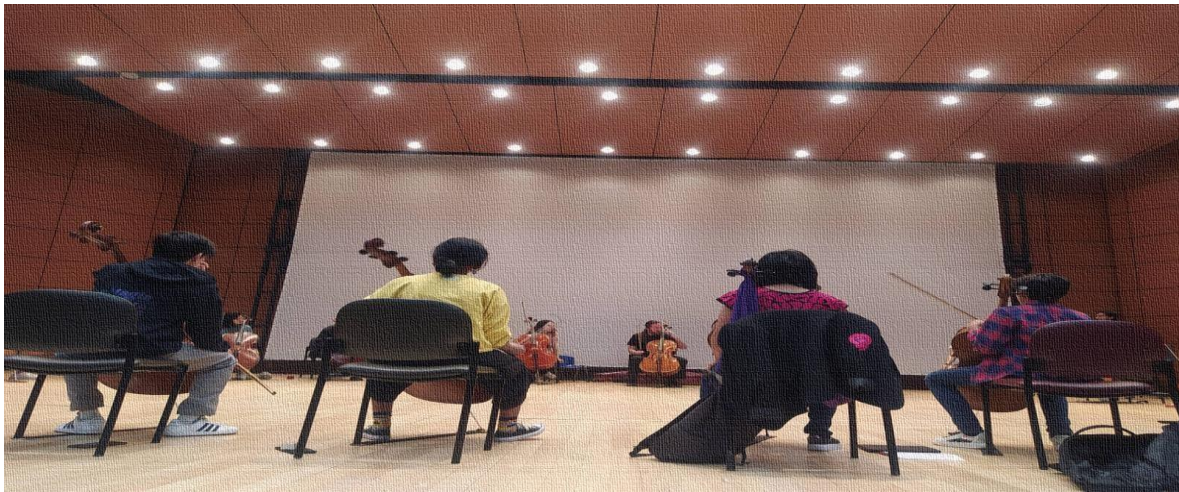
Ilustración 8 taller de improvisación