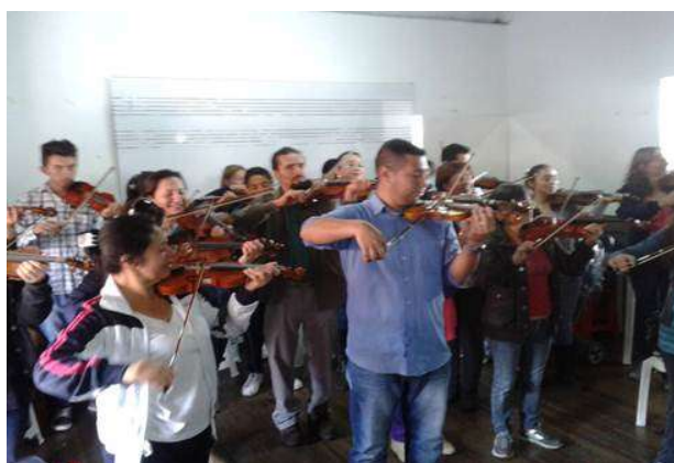
Ilustración: finalización de un taller de padres de manera satisfactoria.

En segundo lugar este aspecto les da calidad moral para exigir en sus hijos la disciplina que requiere la práctica musical. Se sabe que la mejor educación siempre será la que se provee con el ejemplo. Padres e hijos motivados son la base para el éxito en la educación