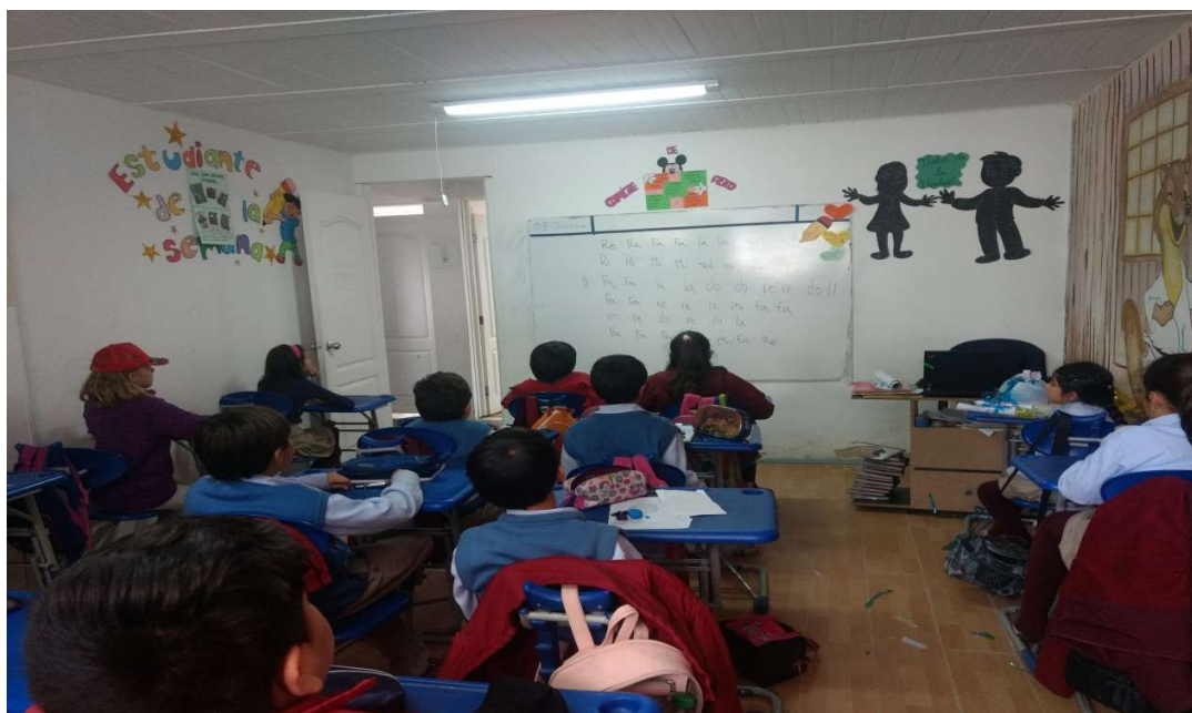
Ilustración: Niños observan el tablero, cantando las notas escritas en el tablero.