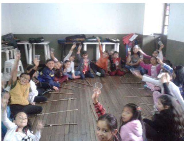
Ilustración: Maestra destacando cualidades de los niños.

El segundo es cuando dentro de la cantidad de presentaciones que gestiona la maestra con su orquesta, trata de que las muestras sean a nivel de orquesta y también con la presentación de solistas, los niños a través de esta oportunidad se preparan con esmero y demuestran su amor a la música.