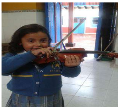
Ilustración: niña con la aprehensión completa en torno al agarre del arco.

Es partir de los conocimientos previos en beneficio del entendimiento fácil de la técnica del agarre del arco. Superar este aspecto con facilidad dentro de la formación musical, permite que el niño se siga motivando por sus avances significativos, acompañados de la forma en que constantemente la maestra destaca sus logros.