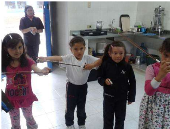
Ilustración: niñas pasando el arco por sus falanges, previo al agarre del perrito.

Copito tiene un huesito, para que se lo pueda comer hay que dejarle un espacio”. Allí empieza la sensibilización de los dedos pasando el arco por las falanges de los niños.