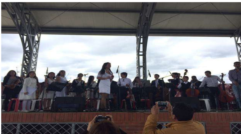
Ilustración: presentación orquesta de Cogua en el festival del Rodamonte.