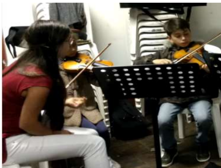
Ilustración: explicación de la maestra sobre el movimiento del arco.

Cada vez que la maestra da una explicación sobre algún requerimiento técnico que desea aplicar en la ejecución musical de la orquesta, lo hace desde una visión de retroceso, es decir, utiliza la empatía para pensar una forma de hacer una explicación fácil de entender y volver a la música fácil. Esto se logra desde un proceso de reflexión interno, que permite verse como espejo de algo que sucedió hace unos años atrás. Es decir observarse reflejado en aquel niño que recibe la instrucción, para entender como a él se le facilitaría entender lo que se le solicita.