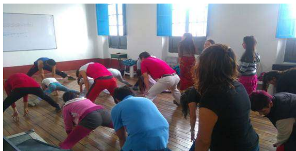
Ilustración: Zumba para padres de los niños de la orquesta.

Se cita a los padres de familia y se les realiza alguna actividad lúdica, en la que ellos se conocen entre sí y logran integrarse y posteriormente se socializa el proceso de sus hijos.