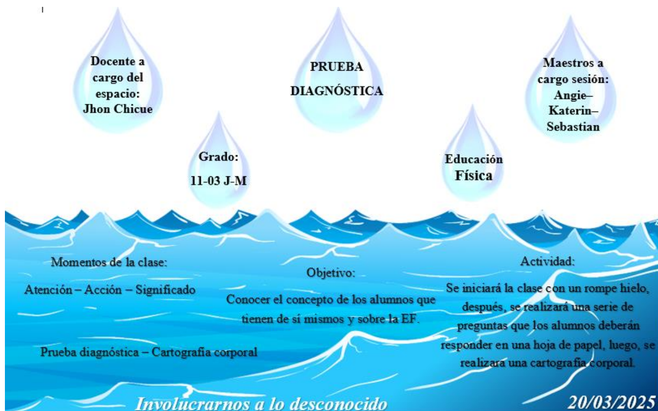
Ilustración 6: Prueba diagnóstica