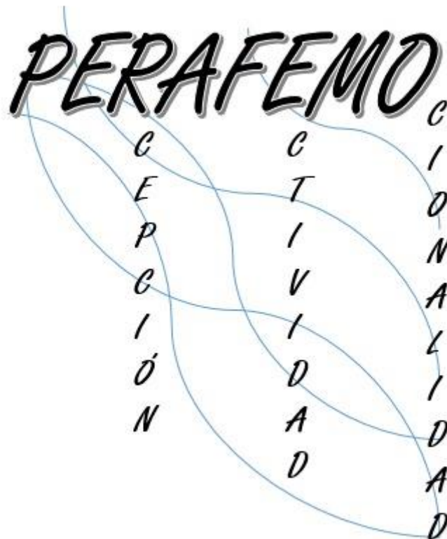
Ilustración 2: PERAFEMO