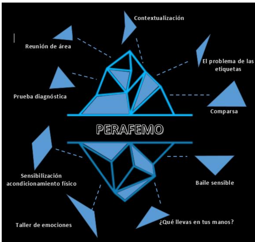
Ilustración 4: Composición de unidades en micro-clases

Nota: Adaptada de imagen original de canva.com https://shorturl.at/07kxA