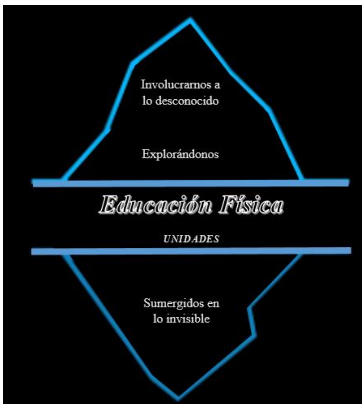
Ilustración 3: Unidades didácticas

Nota: Adaptada de imagen original de canva.com https://shorturl.at/07kxA