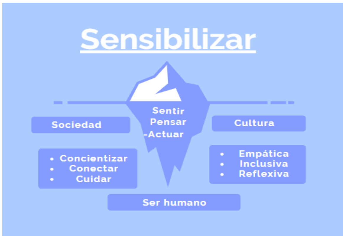
Ilustración 1: Sensibilización desde el iceberg.

sensible tiene la capacidad de generar una sociedad, consciente de su realidad, que conecte y cuiden de sí mismos, el otro y lo otro, lo que promueve una cultura empática, inclusiva y reflexiva.