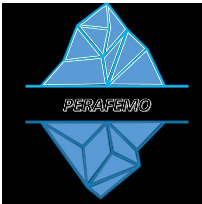
Ilustración 5: La unidad del iceberg