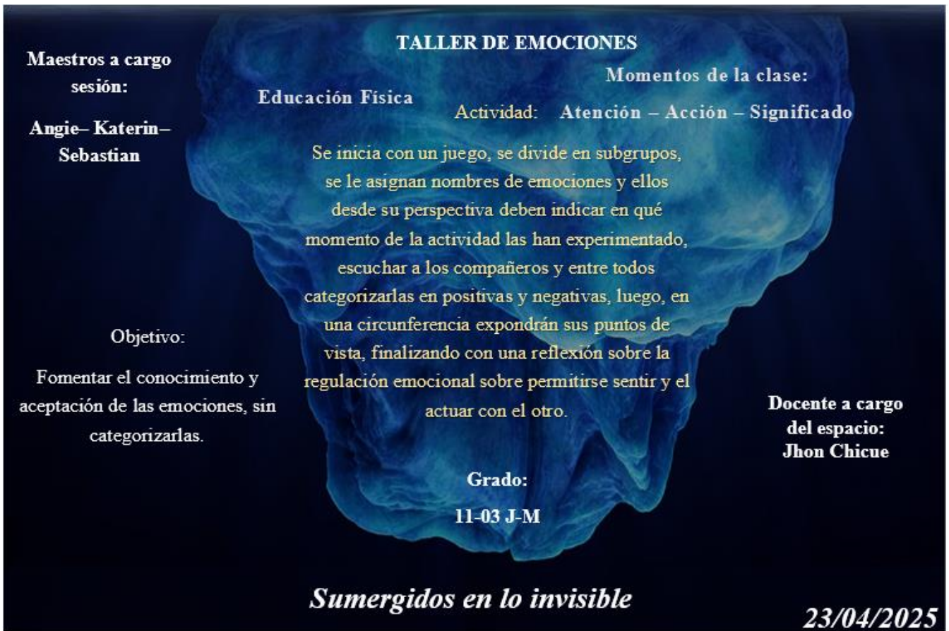
Ilustración 10: Taller emociones