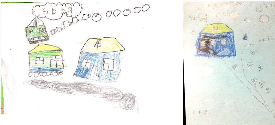
Figura No. 3. Ejemplos de algunos dibujos realizados por niños y niñas de Kínder de la I.E.D. Enrique Pardo Parra

Desde la mirada de los niños y a las niñas, la visión de su escuela en términos físicos es buena, en sus dibujos se ve plasmada una casa sin elementos que puedan indicar algún tipo de peligro, daño o complicación y se resalta el espacio exterior en el que ellos pueden jugar, que en este caso es el parque y la arenera, es el elemento que se resalta en la gran mayoría de los grafos pues permite estar al aire libre.