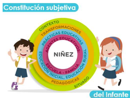
Figura No. 1. Modelo de análisis “La infancia y sus mundos circundantes”.

La estructura se establece en forma de círculo concéntrico dado que, a través de él, se pueden ver reflejados los mundos circundantes del sujeto infante.