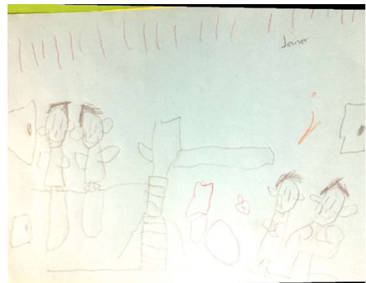
Figura No. 2. Ejemplos de algunos dibujos realizados por niños y niñas de grado Kínder de la I.E.D. Enrique Pardo Parra

Examinando los dibujos de los niños y las niñas, fue posible observar su preferencia por el juego libre y según sus testimonios, éste se encuentra restringido a las horas de