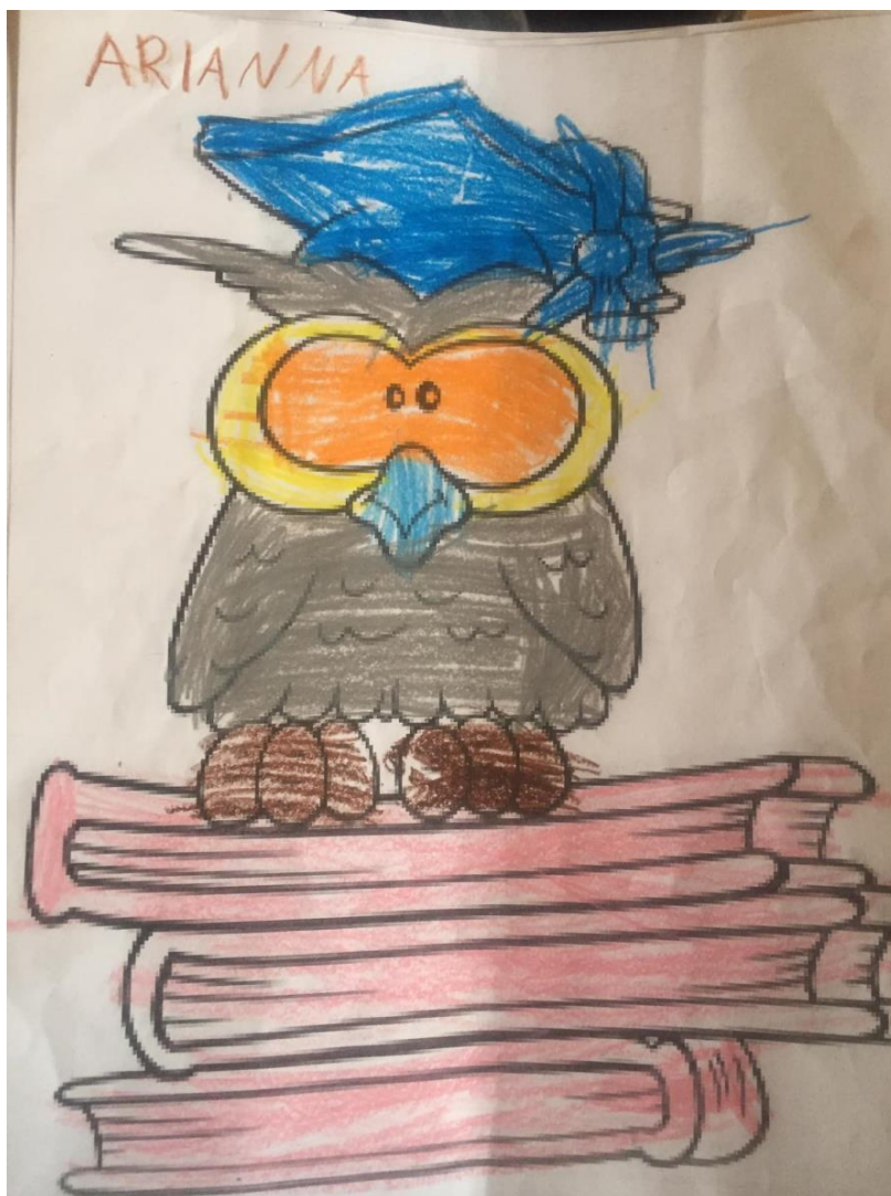
Fotografía #2, (Primer piso Biblioteca Pública Municipal Jorge Enrique Hernández Carrillo, Subachoque, 2023) Niños y niñas dándole color a la lechuza.

Que en primera instancia abordaron los niños al indagar por su interacción e inserción en el mundo y la autoafirmación del YO. En su contexto inmediato para finalizar la sesión con la colaboración de las funcionarias de la biblioteca se les ofreció un pequeño refrigerio. (consistente en galletas y una bebida refrescante.)