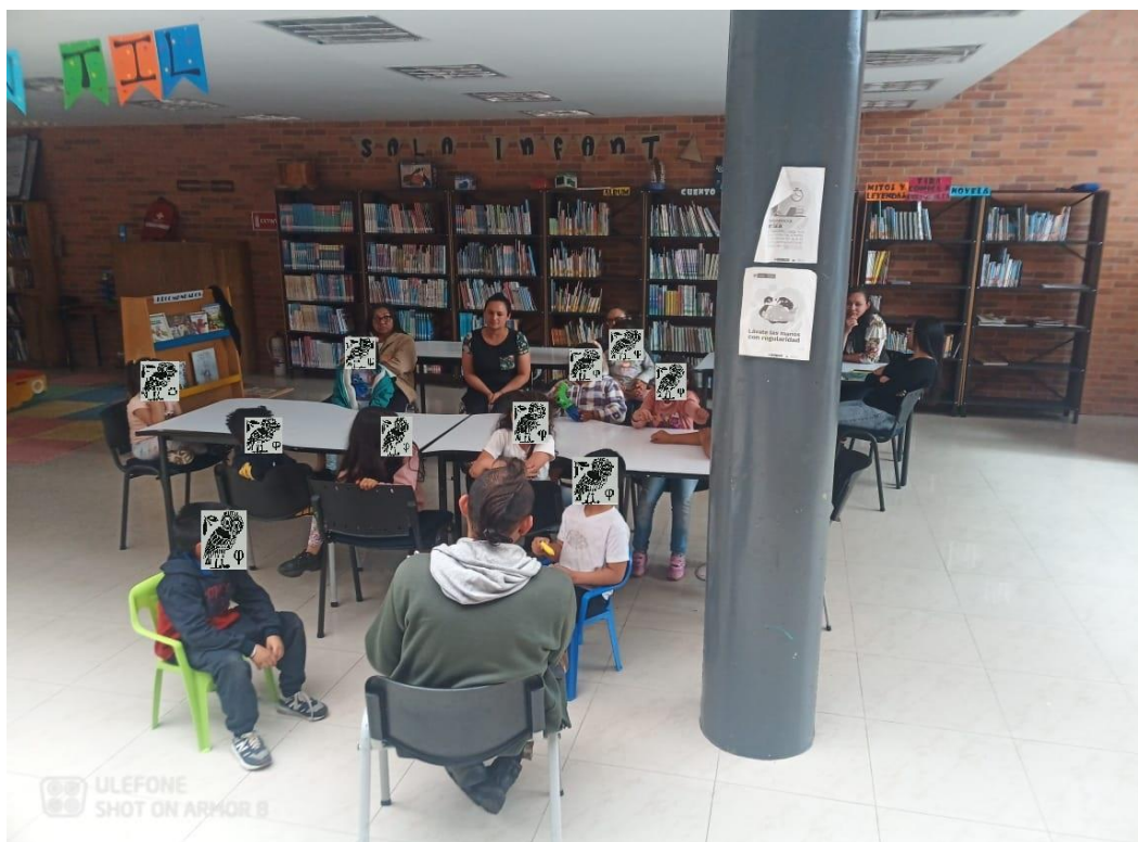
Fotografía #1, (Primer piso Biblioteca Pública Municipal Jorge Enrique Hernández Carrillo, Subachoque, 2023) Niños y niñas realizando intervenciones junto a los padres de familia.

Aquí se plantearon una serie de reflexiones sobre el ejercicio aportando algunas conclusiones que pueden cerrar la sesión del taller y finalmente se cerró la sesión del Café Literario al colorear a la lechuza que siendo el símbolo del amor a la sabiduría, podía darse la libertad a los lectores infantiles de que le dieran el coloreado que desearan a partir de los múltiples horizontes de sentido que fue despertando en que los niños y niñas fueron manifestando y sintiendo algunas emociones (sorpresa, alegría, entusiasmo nostalgia) a lo largo de la sesión, aportando diversos puntos de vista y reflexiones individuales sobre la parte constitutiva de la naturaleza humana llamada identidad y el territorio.