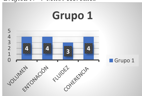
Gráfica N° 7 Mito: Hércules