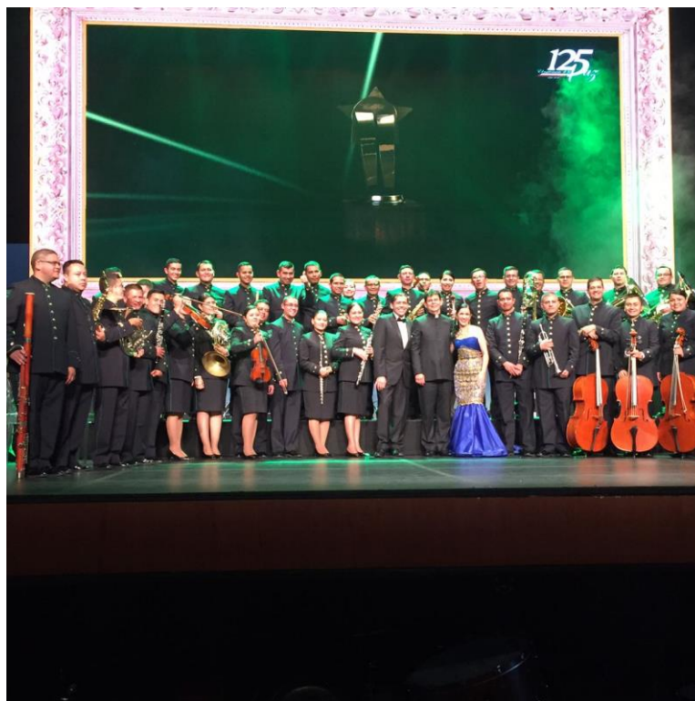
Fotografía tomada de la celebración de los 125 años de la Policía Nacional, Teatro Colon.

Para el logro de este propósito se adquieren cincuenta y cinco instrumentos entre violines, violas, violonchelos, contrabajos, oboes y trompetas, entre otros, necesarios para la conformación de la Orquesta Sinfónica. De otra parte, la convocatoria especial llevada a cabo permitió seleccionar e incorporar hombres y mujeres, todos ellos músicos profesionales, intérpretes de instrumentos de cuerda frotada como violín, violonchelos, viola y contrabajo; otros instrumentos como oboe, fagot y contrafagot, flauta travesa; percusión, piano; corno francés. Para tal efecto acudieron a las audiciones, que se llevaron a cabo dentro del territorio nacional, con el apoyo de las diferentes escuelas de formación de la Policía Nacional.