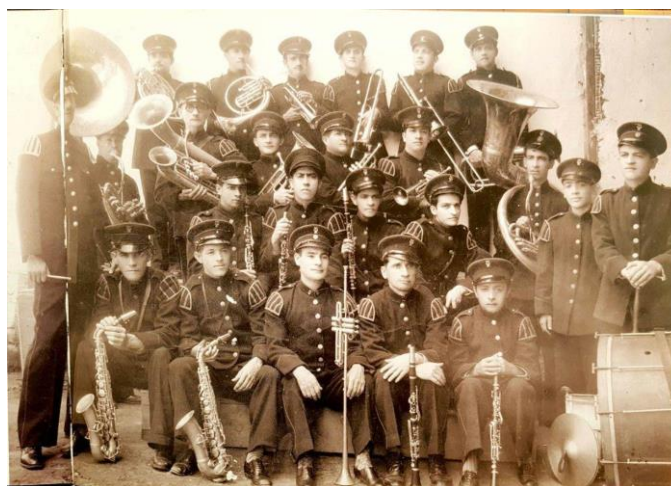
Figura N° 1 Banda de músicos de la Ponal 1912.