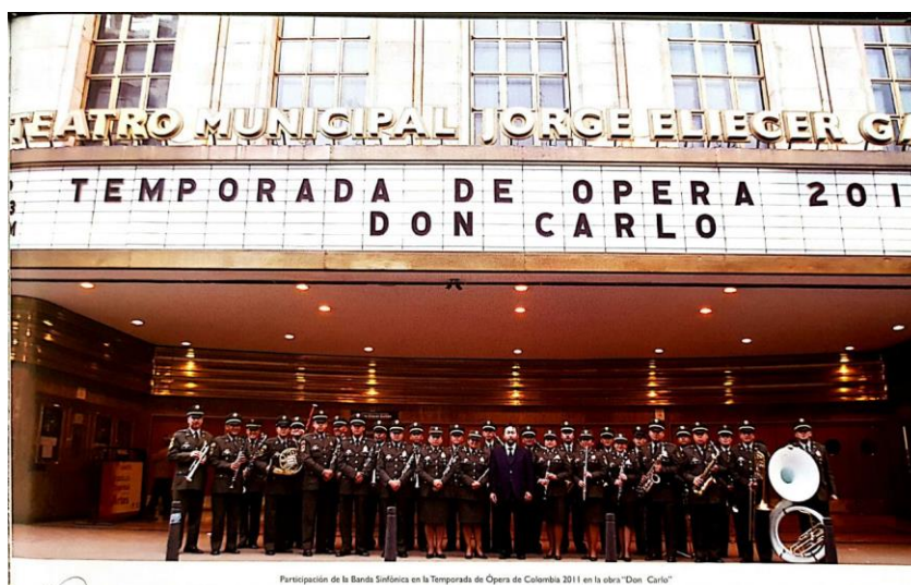
Imagen N° 2. Banda sinfónica Ponal.