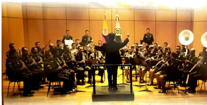
Imagen N° 3. Banda Sinfónica de la Policía Nacional. 2011.