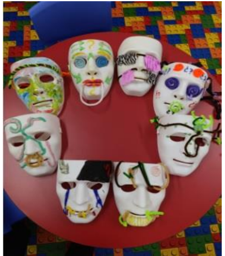
Mascaras realizadas en el momento 3 del taller.