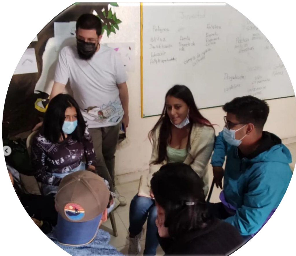
Imagen 16 Articulación de saberes