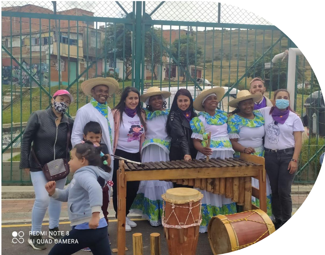
Imagen 9 Carnavalito por la Vida y el Amor

Esta sistematización se planea desde el paradigma sociocrítico, ya que se construyen muchas experiencias y se orientan en los relatos de los actores sociales donde se refleja la perspectiva, incluyendo las voces, mostrando hasta donde la realidad del contexto es manifestada por el investigador, es por eso, que la sistematización pretende comprometer la participación del actor social para resaltar la experiencia y como se han emancipado en su colectivo desde la comunidad para llegar a nuevas comunidades.