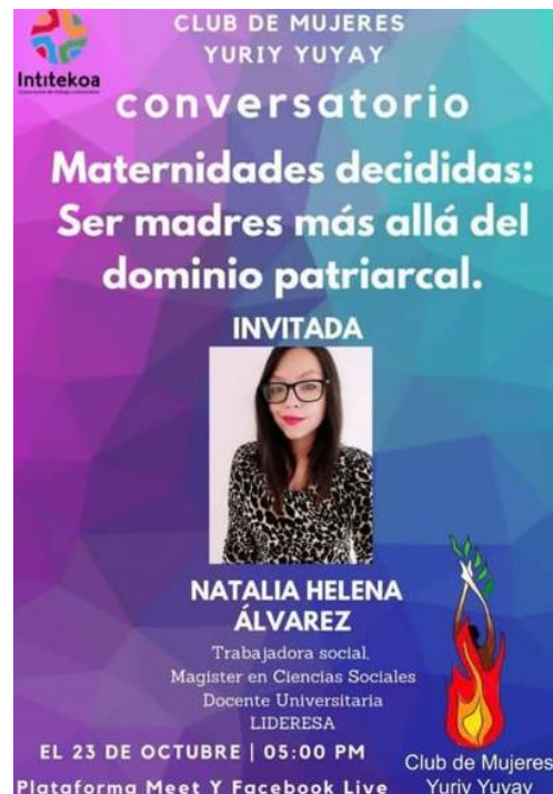
Imagen 22 Convocatoria conversatorio Maternidades decididas

Conversatorio “Maternidades decididas: ser madres más allá del dominio patriarcal”