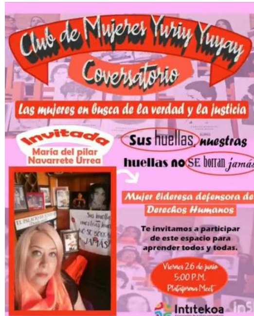
Imagen 20 Las mujeres en búsqueda de la verdad y la justicia”

Conversatorio “Las mujeres en búsqueda de la verdad y la justicia”