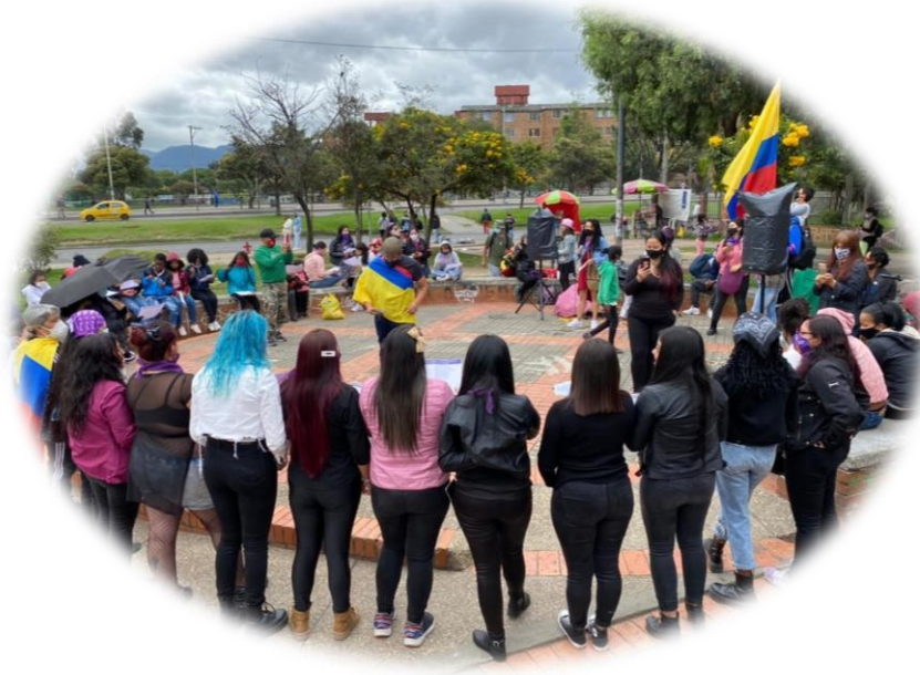
Imagen 24 Encuentro cultural contra las violencias de género

En los momentos de crisis e incertidumbre producida por la pandemia del covid-19, los espacios virtuales, redes sociales, foros y demás plataformas cumplieron un rol determinante para conectarse con seres queridos o continuar el flujo de la vida, sin embargo, también se convierte en el campo de disputa de la información, restricciones sobre las publicaciones o la censura del filtro sobre temas controversiales siendo este el pan de cada día, lo que algunos expertos llamarían infodemia.