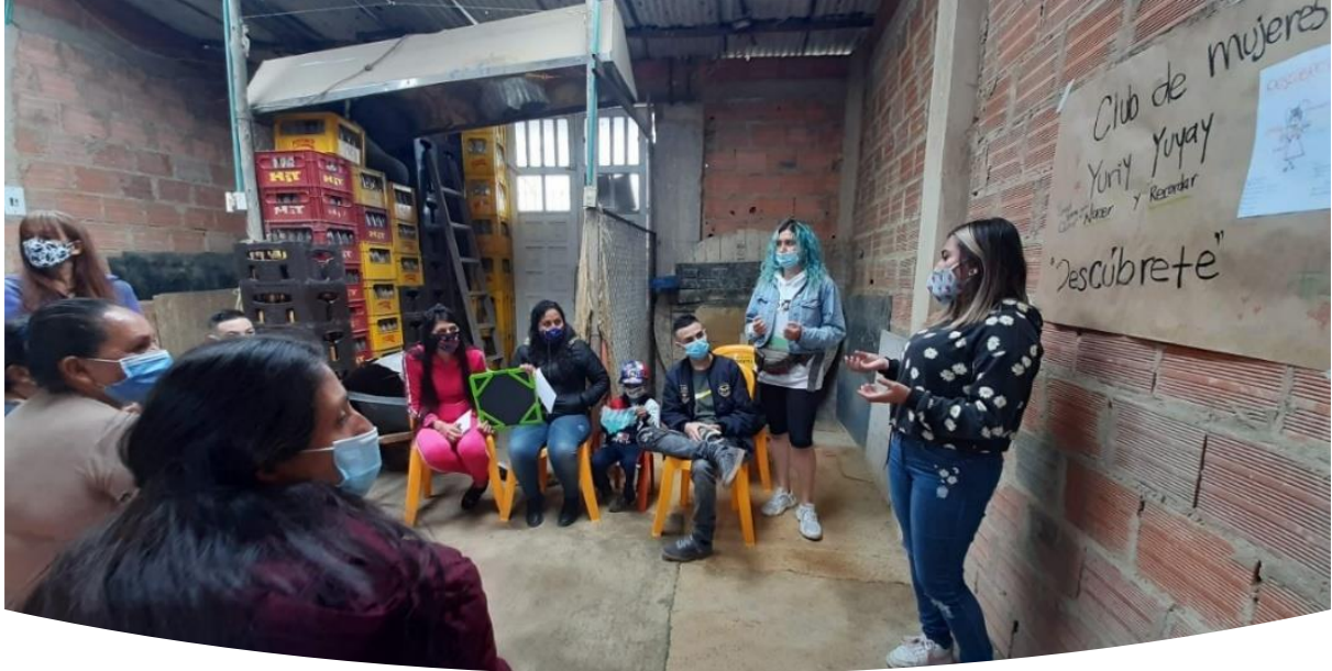
Imagen 8 Acciones Territoriales

Bajo la intencionalidad política de la sistematización de experiencias, la cual, busca reflexionar sobre la práctica para volver a ella, lograr analizar el devenir histórico del Club Yury Yuyay en clave de educación popular, diálogo de saberes y género, nos permite reconocer en su integridad el espacio de interrelación de saberes basados en las experiencias de las mujeres y hombres participantes, quienes desde sus diferentes contextos y posicionamientos políticos han logrado identificar las múltiples formas de relacionamiento desde los roles y costumbres impuestos por el sistema cultural hegemónico dominante. Configurando no solo como un espacio de denuncia sino de reflexión crítica en clave de transformación de formas de vivir y convivir.