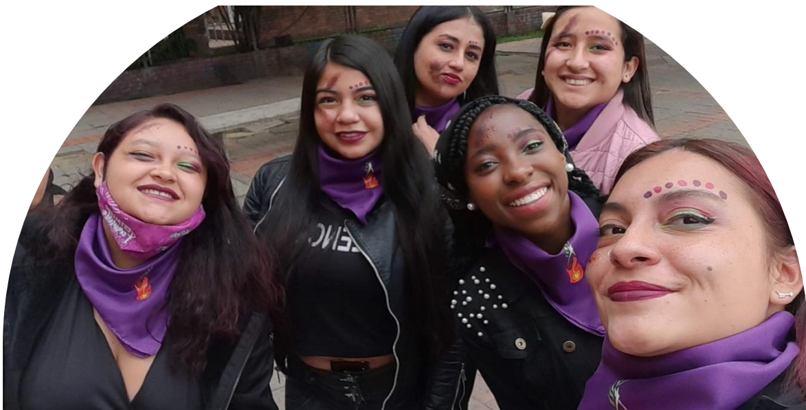
Imagen 1 Grupo base club de Mujeres

Por tanto, contribuye a la producción académica y técnica, partiendo de miradas interdisciplinarias de los estudios de género y feministas, con interés particular por la realidad colombiana y latinoamericana. Esta línea emplea metodologías de investigación