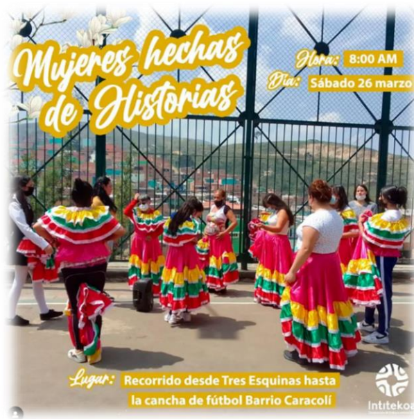
Carnavalito por la vida y el amor versión No. 16

En la corporación de trabajo comunitario Inti Tekoa hace 16 años se realiza un carnavalito por la vida y el amor, en el que participan diferentes actores sociales, madres comunitarias, niños y niñas de colegios, adolescentes, fundaciones y organizaciones sin ánimo de lucro de la localidad de Ciudad Bolívar.