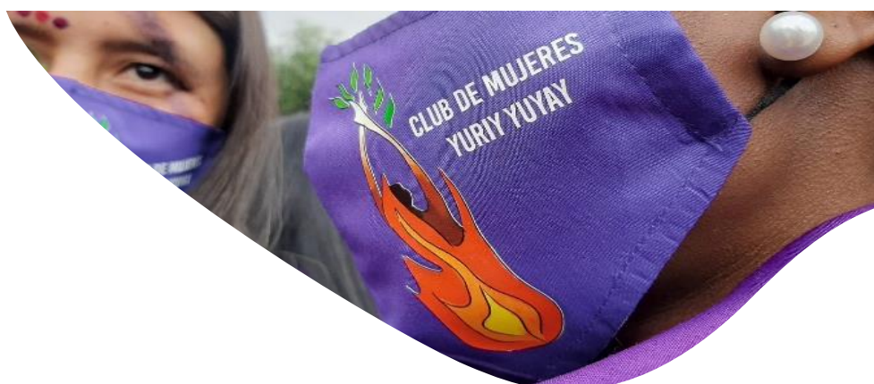
Imagen 14 Clun Yuriy Yuyay

Toma cultural 22M, en el marco de las movilizaciones del estallido social del año 2021, las organizaciones sociales, corporaciones de mujeres de la localidad Ciudad Bolívar convocaron a participar en la plazoleta de la sede la Universidad Distrital del espacio denominado toma cultural realizado el 22 de mayo de 2021, con el fin de alzar nuestras voces y decir no a la violencia de género. En las fotografías se encuentran las compañeras que desde que de manera virtual estaban participando en el Club Yuriy Yuyay.