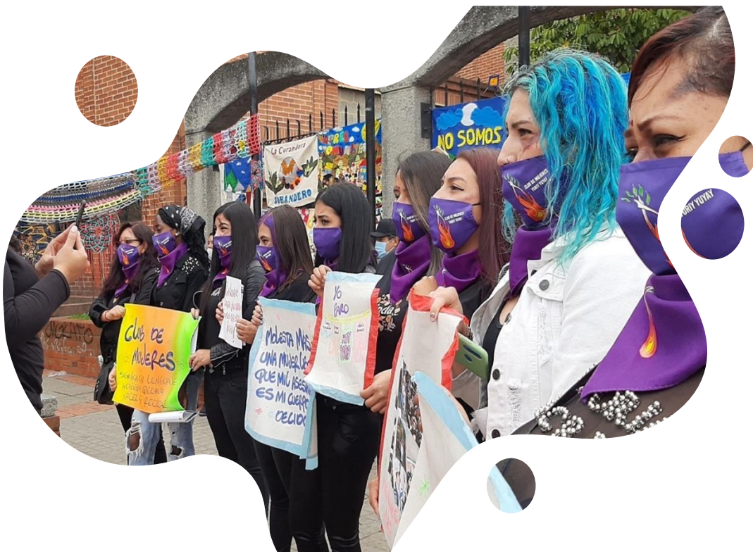
Imagen 3 Toma cultural Ciudad Bolívar

En el club Yuriy Yuyay se pueden evidenciar diferentes experiencias relacionadas