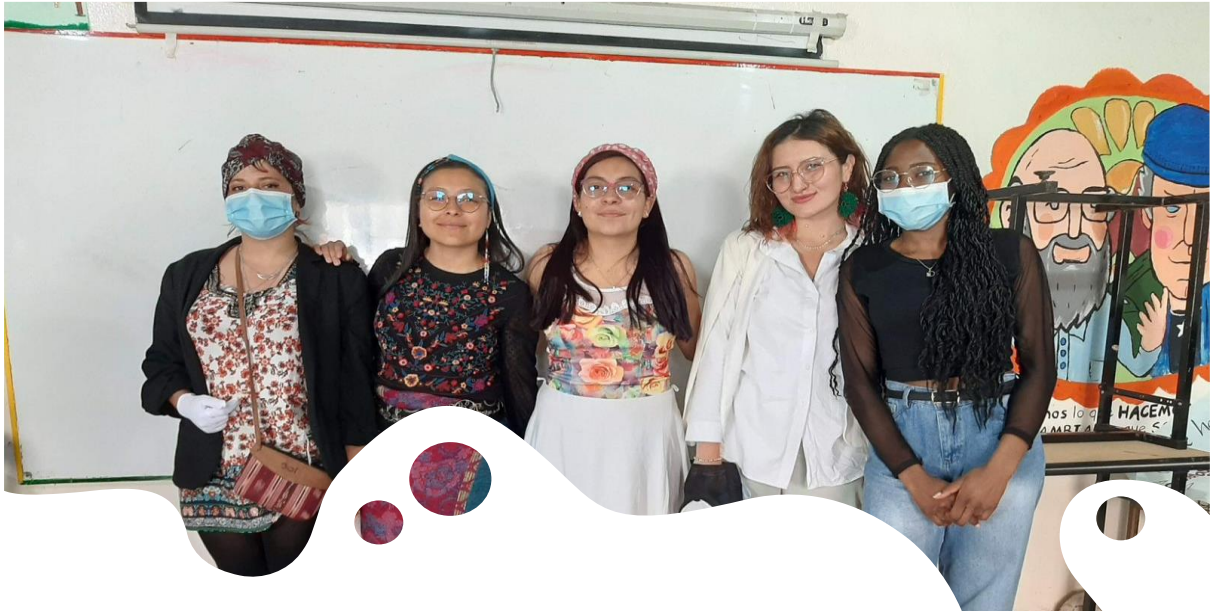
Imagen 4 Escuela de paz, Memorias en Reexistencia

En el siguiente apartado titulado “una mirada desde otras experiencias” se realiza la búsqueda de otras sistematizaciones de experiencias realizadas en temáticas de género, la primera experiencia es un centro de estudios y publicaciones de alforja de un programa de género desarrollado en Costa Rica publicado en el año 2003, en este se tiene en cuenta la práctica de algunas mujeres y su habilidad para hacer análisis de las relaciones sociales de género.