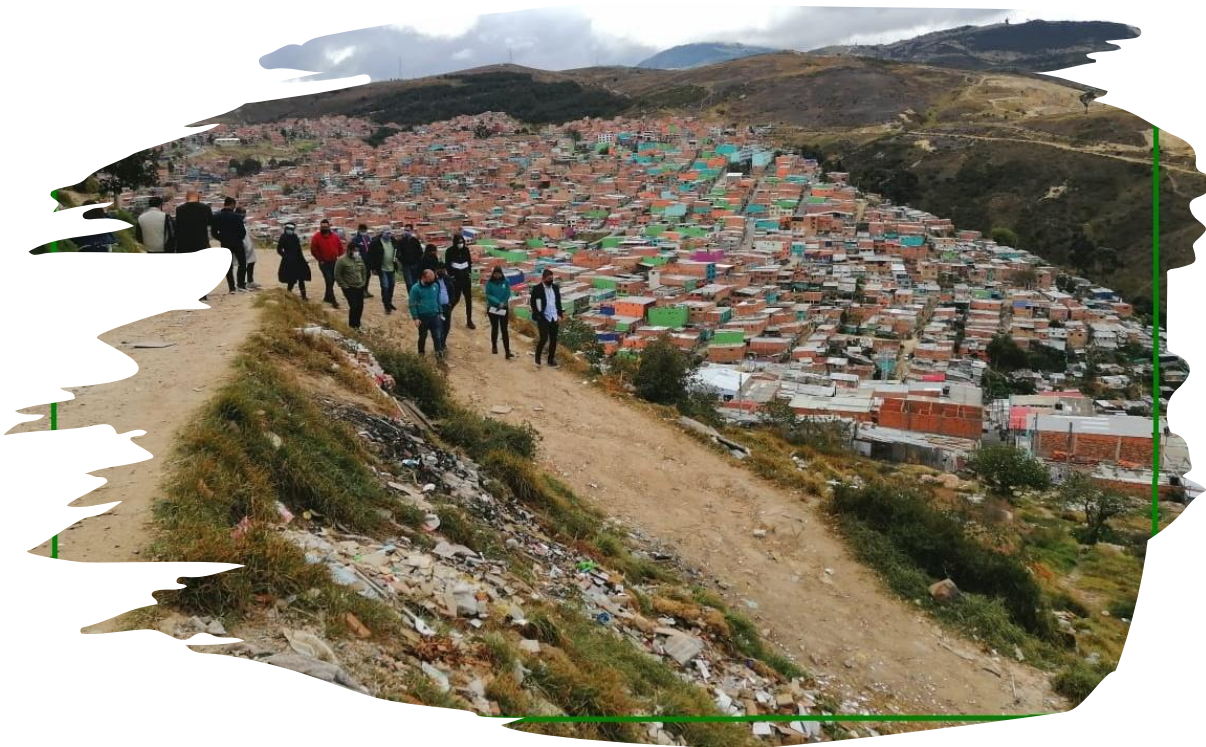
Imagen 6 Ciudad Bolívar, Caracolí y Potosí

Sus apuestas y proyectos comunitarios, como es el P.L.A. (participar, liderar, apoyar) han logrado que los jóvenes empiecen a generar espacios impulsados por ellos mismos, estableciendo mecanismos de diálogo de saberes con la comunidad y otras organizaciones. Algunos de los espacios, actividades y talleres trabajan en los siguientes temas: contabilidad Básica, robótica, inglés, danzas, escuela de fútbol y cuidado ambiental entre otras. (Tekoa, 2020).