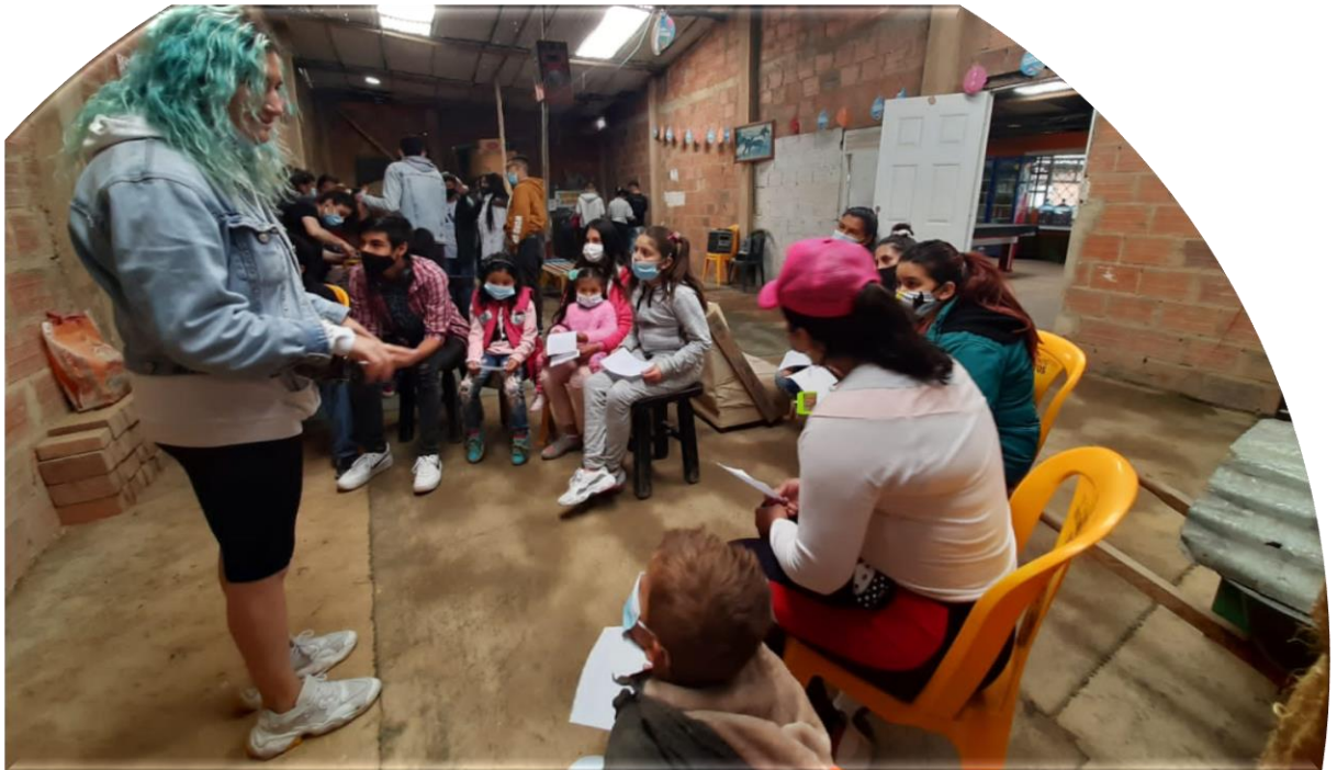
Imagen 15 Barrio Santa Marta - Ciudad Bolívar

En el espacio presencial en la localidad de Ciudad Bolívar Santa Marta que se realizó el sábado 10 de julio del año 2021, este espacio se implementó para dialogar temas importantes que permitieron compartir en familia y comunidad, aportando a la construcción de educación y trabajo comunitario desde estas mujeres, quienes asumen un doble rol de madres y trabajadoras, a la luz de esta situación las abordadas con relación a lograr pensar en el amor propio y el autocuidado como un espacio necesario y de libertad