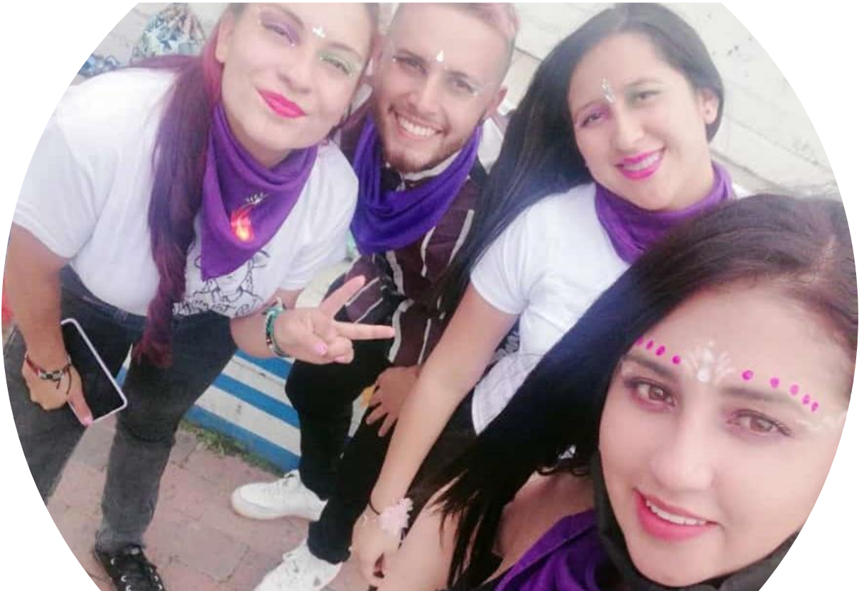
Imagen 5 Juntando sueños