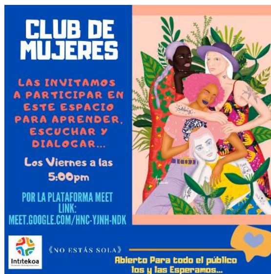
Imagen 19 Convocatoria primer encuentro del club de mujeres

Primer conversatorio presentación de los espacios e iniciativa del club de mujeres