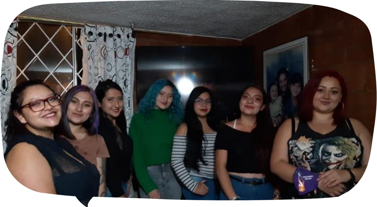
Imagen 7 Iniciando el camino

Es un grupo de trabajadoras sociales, estudiantes y practicantes de trabajo social, líderes y lideresas de la corporación Inti Tekoa, madres, amigas del barrio popular, que por medio de estos espacios buscaban descubrirse como otras formas de ser mujer, explorar los conocimientos de la línea de género con el fin de que cada mujer considere su perspectiva feminista.