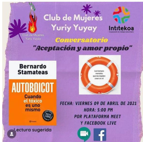
Imagen 23 Convocatoria conversatorio Aceptación y amor propio