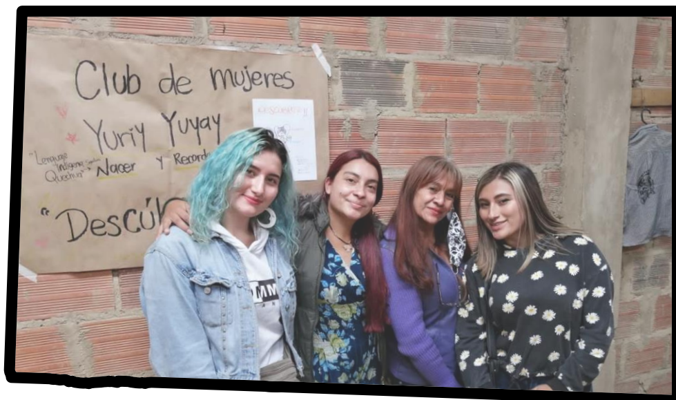
Imagen 18 Compartiendo Historias de Vida