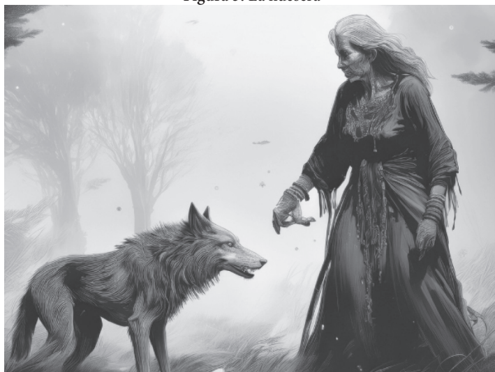
Figura 3. La huesera