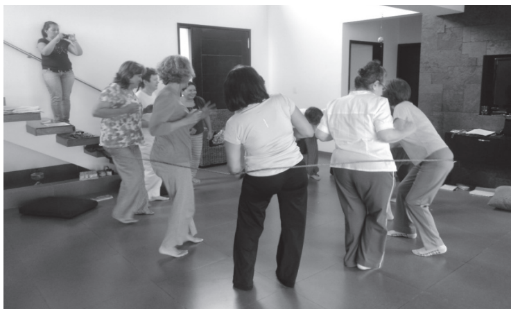
Figura 17. Taller de cocuidado en Bucaramanga (Santander, Colombia)