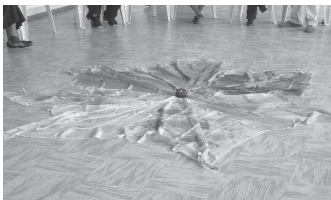
Figura 11. Disposición de salón para taller corporal

A veces uso la expresión “moralismo cero” para recordarme a mí misma y a mis compañerxs de trabajo corporal salir de los preconceptos bueno o malo, y renunciar a las expectativas de comportamientos ideales o esperados; cosa que no resulta sencilla e implica una continua revisión de nuestra forma de estar ante un grupo. Se trata de “colocarse en el límite del remolino” (Briggs y Peat, 1999, p. 187), entregarse a la cadencia caórdica 3 —caótica y coherente— y mágica de la vida. Y desde ese movimiento interior trasladar dicha experiencia a la creación de un espacio, útero , zona fronteriza-transicional para que acontezca el milagro.