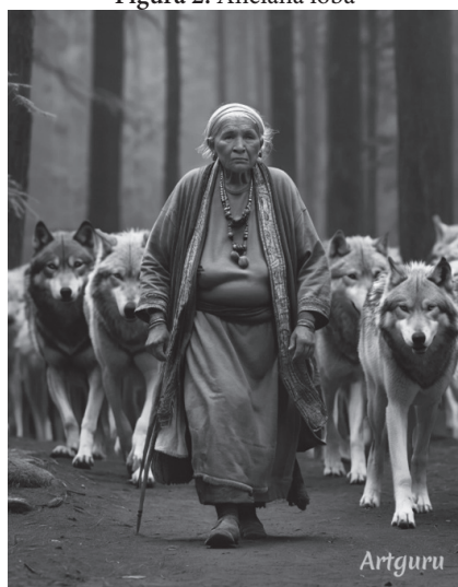
Figura 2. Anciana loba