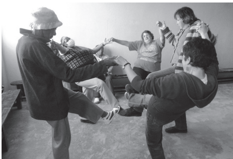
Figura 18. Taller de autocuidado con el grupo Mujeres Dejando Huella, en Bogotá

cionalidad y la vincularidad. La Corposíntesis, así, invita a transitar desde la corporalidad, las ondas de la dinámica espiral del cuidado, a experimentar desde nuevas sintaxis creadoras y cuidadoras de vida el cuerpo propio, lxs cuerpxs otrxs, la corporalidad colectiva, el cuerpo social y el cuerpo global de la casa común en una danza que despierta las múltiples posibilidades del cuerpo como territorio vital de aprendiencias.