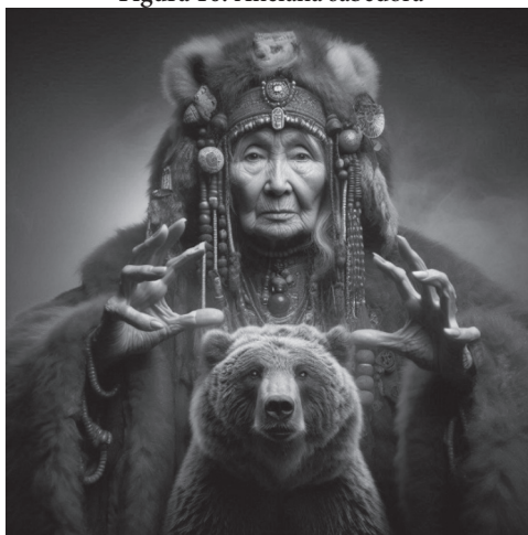
Figura 10. Anciana sabedora