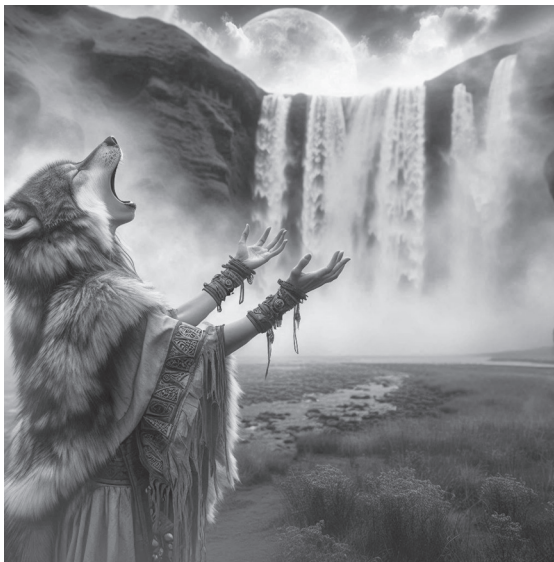
Figura 9. Mujer salvaje

CLARISSA PINKOLA ESTÉS, MUJERES QUE CORREN CON LOS LOBOS (2004, p. 46)