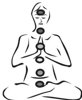
Figura 6. Centros energéticos