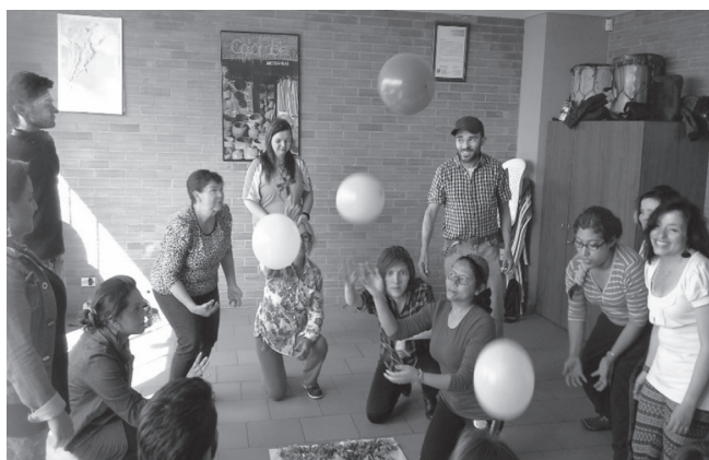
Figura 14. Encuentro de Semillero de Investigación y Grupo de Autocuidado en Casitas Bíblicas

Cuando hay una fuerte desconexión, lo más probable es que no sea una buena idea proponer movimiento libre al comenzar la experiencia. Lo fui aprendiendo en mi trabajo corporal con comunidades afectadas hondamente por pobreza, desplazamiento, violencia y abusos de todo tipo. En algunos casos es sabio comenzar por algunos movimientos simples, mediante juegos de imitación.