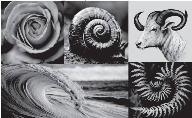
Figura 4. Espirales en la naturaleza

producen los agujeros negros marinos que succionan el agua u objetos desde la superficie hacia las profundidades.