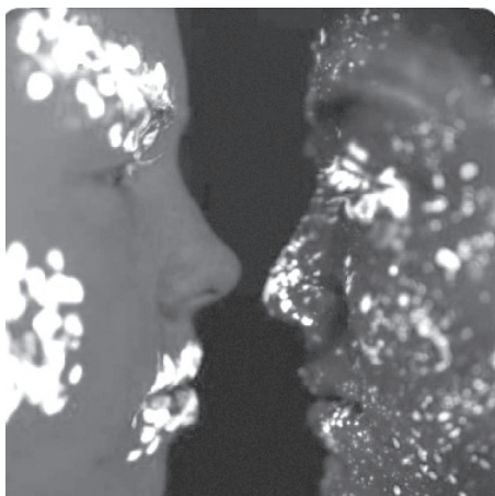
Figura 15. Polaridades

sanación y realización a partir de dicha integración. Esta síntesis refiere no a un proceso de disolución de las polaridades, sino a un reconocimiento de la existencia de estas. No consiste en una búsqueda moralista del punto medio, tan posicionado por corrientes espirituales y normativas sociales que terminan reforzando la restricción que intentamos superar. Nos proponemos, por el contrario, la integración de la contradicción y sus riquezas en la experiencia humana: el reconocimiento del camino que va de un extremo a otro de la polaridad, que incluye la diversidad de los estadios intermedios. La integración parte, así, del reconocimiento de la polaridad como riqueza y busca que, a la par de establecer puentes de tránsito o comunicación entre los contrarios, la persona adquiera la flexibilidad para moverse entre ellos y reconocer los recursos vitales que cada uno le ofrece en diferentes momentos de la vida.