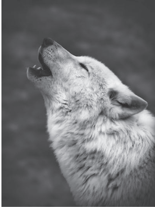
Figura 19. Loba aullando