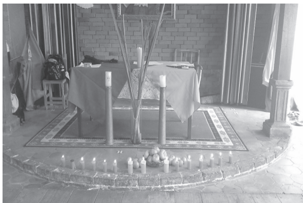
Figura 12. Disposición de salón para taller corporal

vela, colocar telas de colores hermosamente dispuestas, jugar con aromas de flores, inciensos o aceites esenciales; sacar las sillas del salón y disponer cojines y colchonetas que inviten a sentarse en el suelo; colocar música suave u oscurecer un poco el espacio para darle calidez.