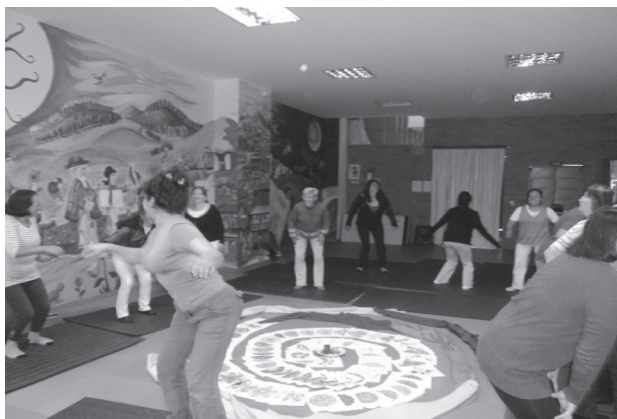
Figura 13. Taller Grupo de Autocuidado en Casitas Bíblicas (Bogotá, Colombia)