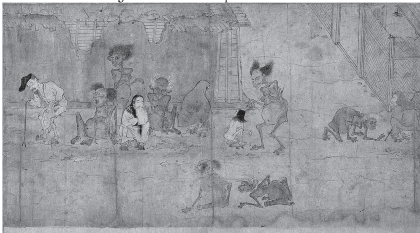
Figura 8. Reino de los espíritus hambrientos

Fuente: Museo Nacional de Kyoto (s. f.).