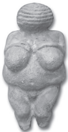
Figura 7. Estatuilla paleolítica