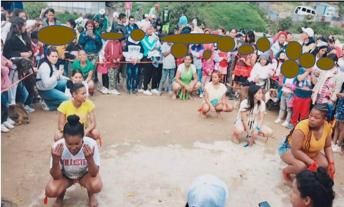
Ilustración 11- danza viva- Fuente: archivo del autor

Se anexan enlaces de muestras artísticas música danzarias: