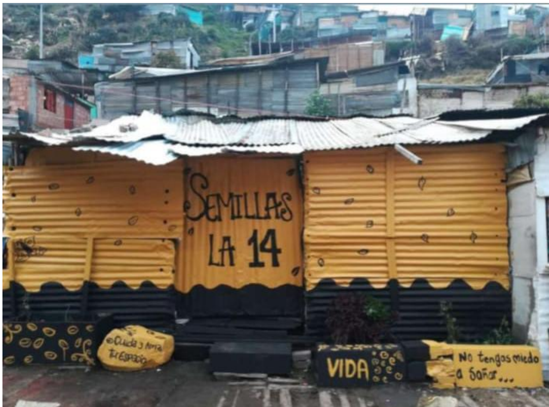
Ilustración 1- Casa y sede del Proyecto SL14