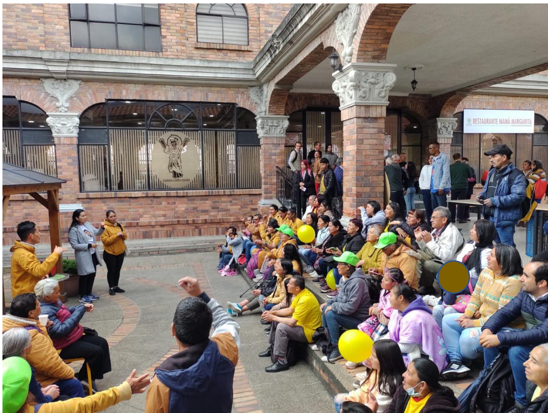
Ilustración 13- parroquia 20 de Julio- Fuente: archivo del autor

Por otra parte, se deja evidencia fotográfica de un convenio social según el cual SL14, participará por tres años, partiendo desde el 4 de marzo de 2023 a diciembre de 2026, con la obra salesiana del Niño Jesús. Todo esto gracias al trabajo artístico que se desarrolla en los barrios de asentamiento informal: La Quebrada y El Pescadero.