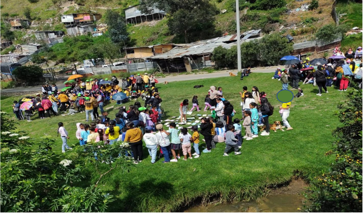
Ilustración 9. entornos que nutren y tejen dialogo musical