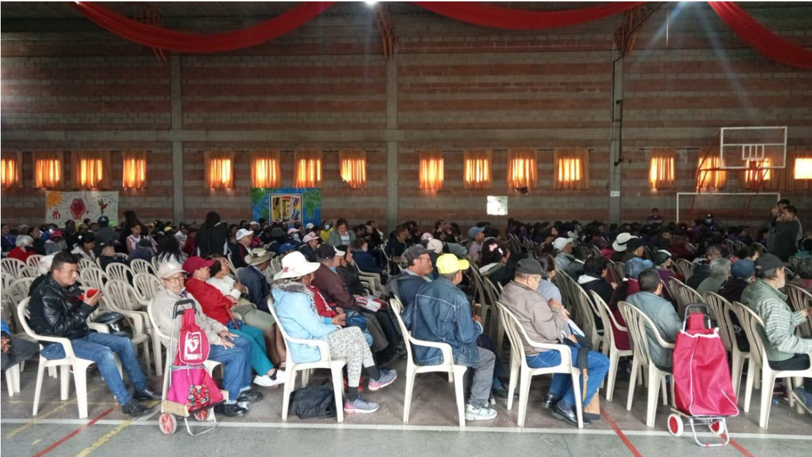
Ilustración 14- centro de formación Juan Bosco Obrero