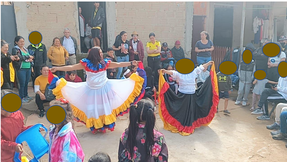
Ilustración 8. conexión del ser-

Por ende, es indispensable hablar de experiencias culturales, sociales y pedagógicas desarrolladas por el proyecto SL14, para ello nos referimos conceptos claves para esta investigación tales como: el artista animador y experiencias sonoras: