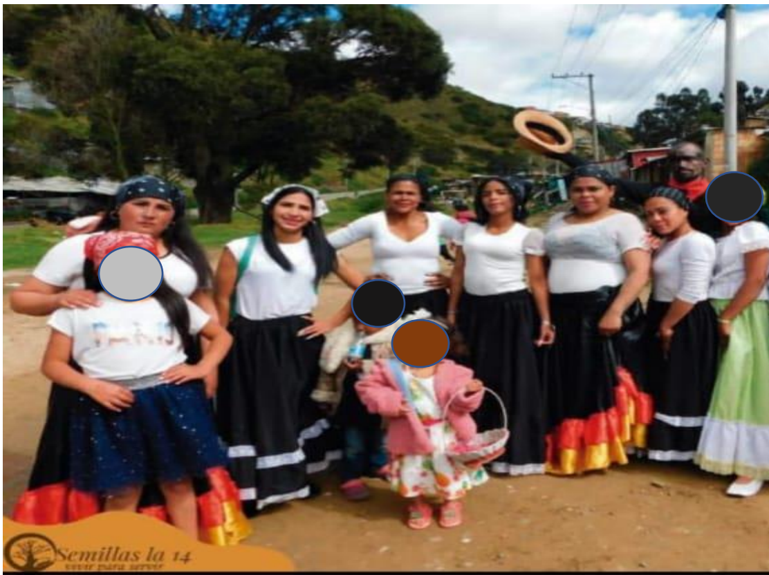
Ilustración 7. conocimiento heredado