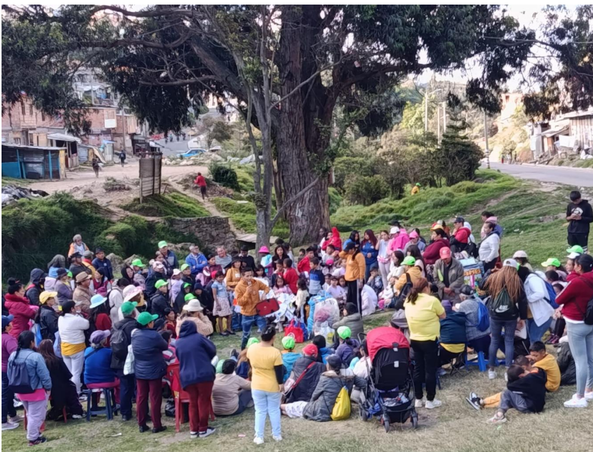
Ilustración 10- Socialización de la propuesta de sistematización- Fuente: archivo del autor.

En la segunda sección, se muestran los datos recopilados con relación a la cantidad y cualidades que enmarcaron la conformación, la selección del repertorio, la propuesta escénica y el lugar de la muestra final, ya que para lograr dicha sistematización se requirió de mucho diálogo, persuasión, alimentación y recursos pedagógicos por parte de las y los dinamizadores. En primera instancia se convocó al grupo general que participa en el proyecto SL14, un promedio de 250 personas, a las cuales se les socializó sobre la posibilidad de sistematizar un acto o propuesta artística, ya que era recurrente el interés de visibilizar el proyecto por parte del equipo dinamizador de SL14 y esta era un opción viable, posible y ejecutable.