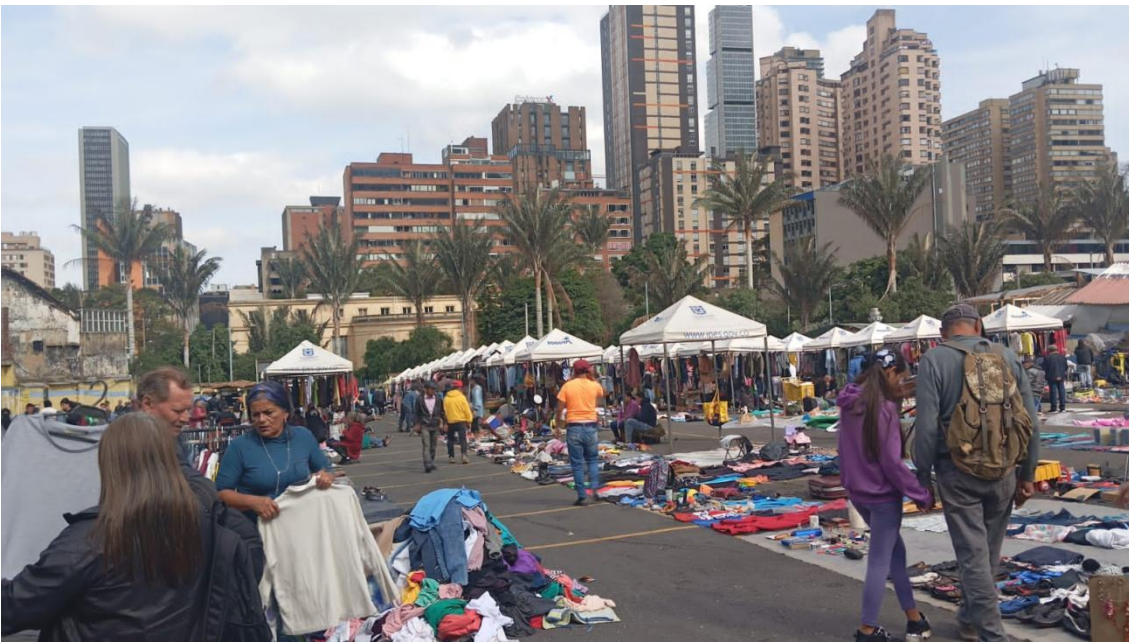
Ilustración 15- instituto para la Economía social- IPES