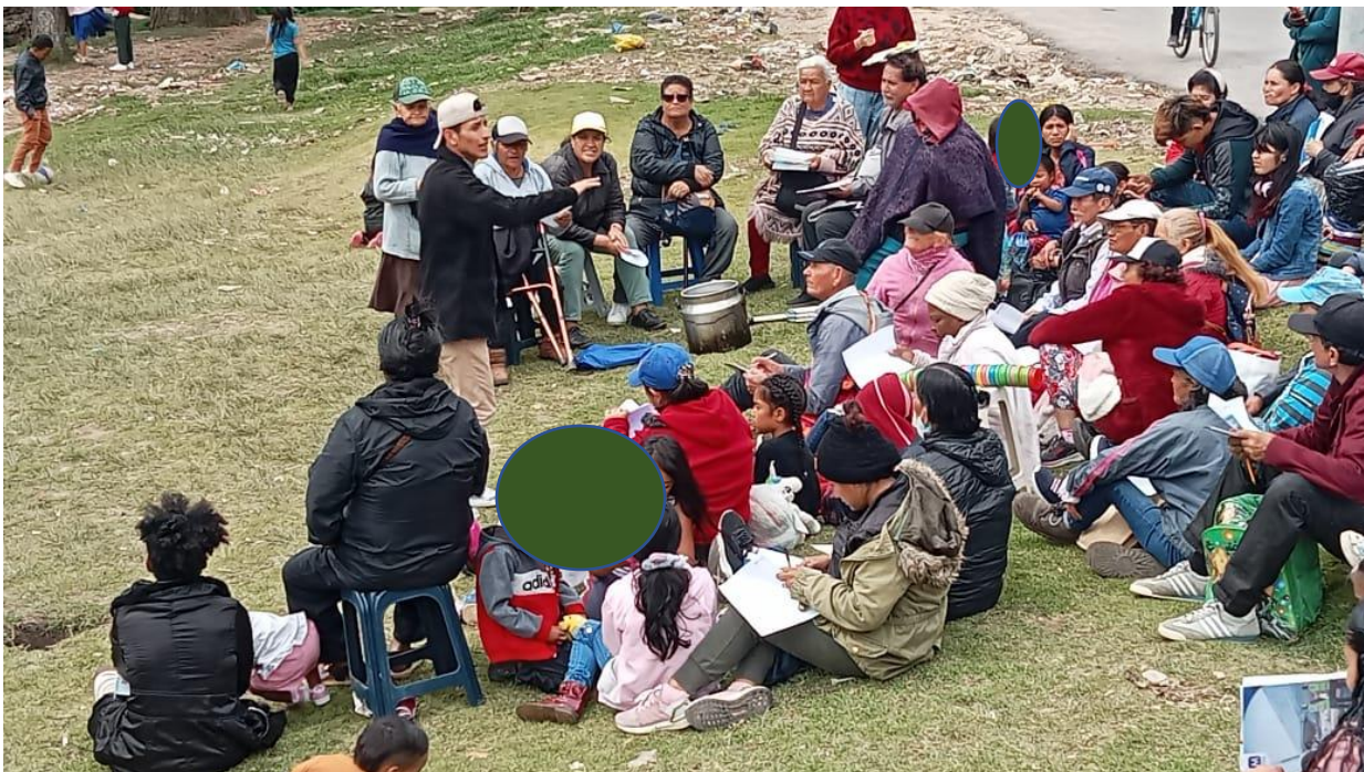
Ilustración 4. grupo de adultos-experiencias y saberes-