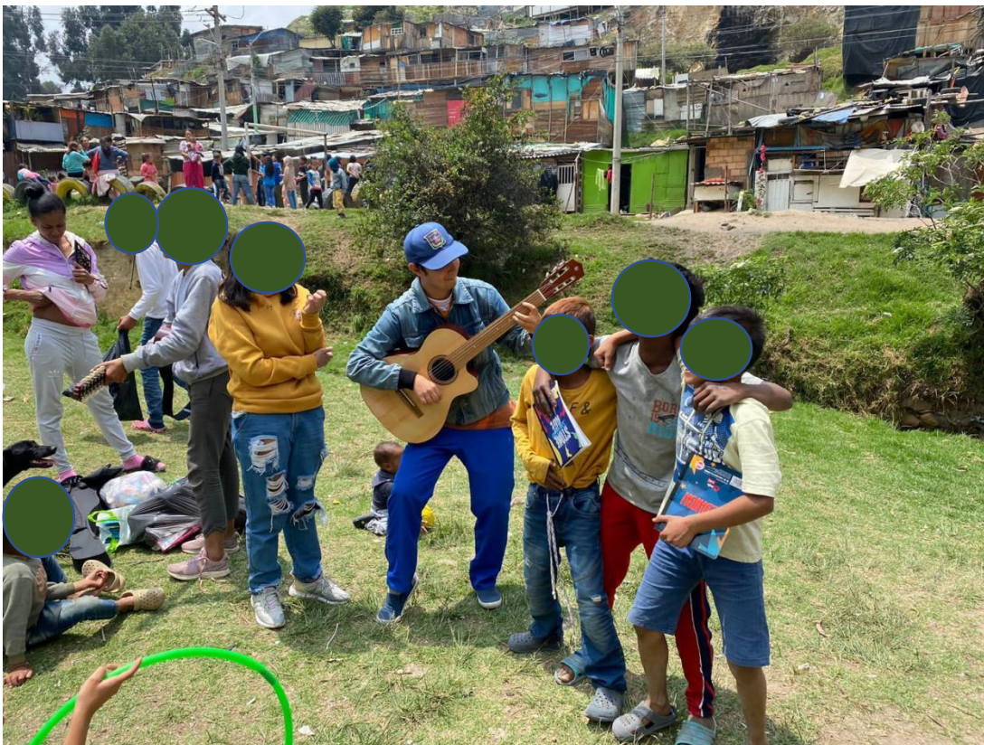
Ilustración 2 iniciación musical