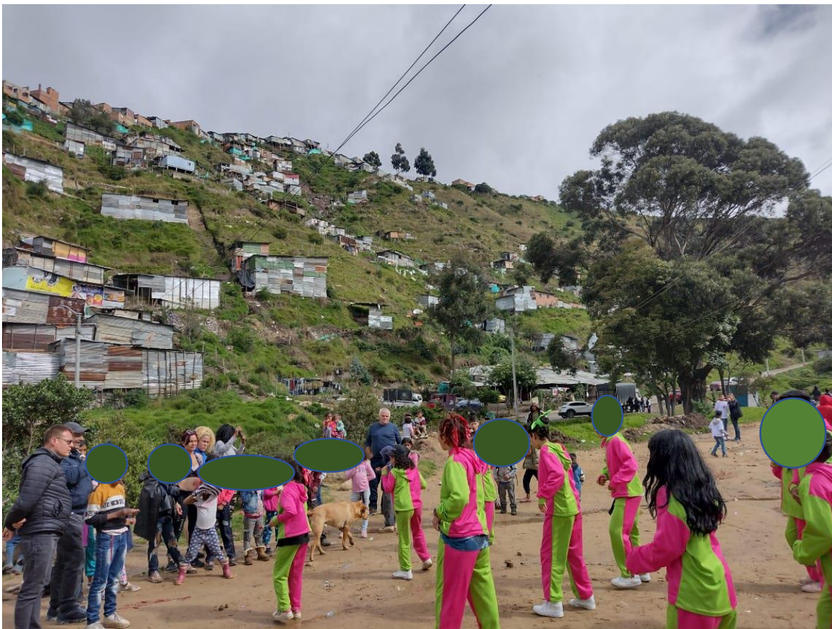
Ilustración 5. danza y vida