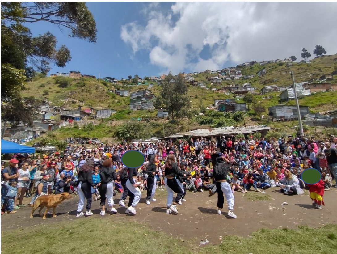
Ilustración 3. Desde los tik toks y la pandemia

Para este espacio fue fundamental analizar y reconocer a las lideresas y su alto sentido de apropiación por su comunidad, en donde se implementaron ensayos en los patios de sus casas, con pequeñas radios e incluso proyectando la música escogida desde sus celulares y como si fuera poco el diseño y elaboración de sus vestuarios en sus propias casas, con máquinas en mal estado, pero fue más las ganas y el ver cómo eran parte de algo tan bonito y dignificante que fueron más las soluciones que las excusas. Como aporte final los voluntarios del proyecto realizaron una recolecta entre ellos para comprar los materiales para que las madres lideresas lograran ese aporte de tejido para la comunidad.