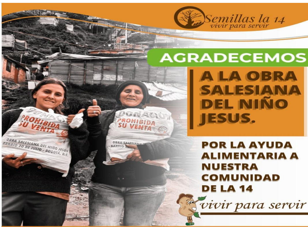
Ilustración 16- convenio social