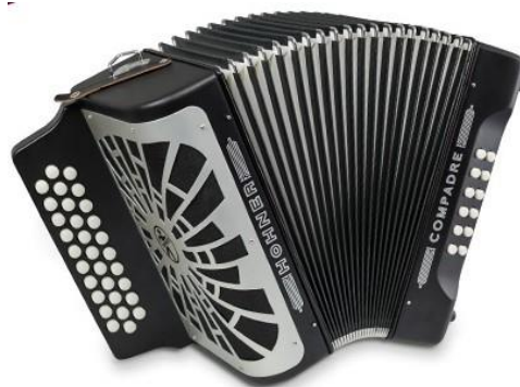
Ilustración 3. Acordeón Diatónico Hohner

El acordeón originario de Austria, llegó como migrante... o quizás fugitivo... o casualmente un aventurero en busca de nuevas tierras donde impregnar con su nostálgico sonido, llegó en un barco cargado de mercancía europea quien descargaría en uno de los puertos de las costas Latinoamericanas. (Viloria, 2017)