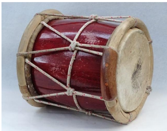
Ilustración 4. Tambora Dominicana