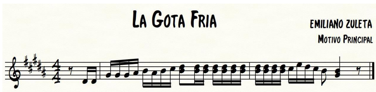
Ilustración 15. Fragmento Musical, obra La Gota Fría.

Ambos géneros, utilizan el acordeón como el alma melódica de su lenguaje musical. Este instrumento, con su capacidad para generar emoción a través de sus cambios de intensidad y articulación, ha sido clave en definir la identidad de ambos estilos. En el merengue, el acordeón juega un papel más explosivo y rítmico, mientras que, en el vallenato, se convierte en el camino para la expresión lírica y melancólica. A continuación, se presenta otro ejemplo de la canción La Gota Fría del autor Emiliano Zuleta, donde se aprecia la ejecución del motivo principal del tema transcrito en partitura.