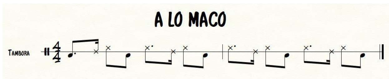
Ilustración 10. Merengue Maco en Tambora Dominicana

A lo Maco, este patrón es más moderno y nació con la llegada del grupo “Los Hermanos Rosario” a pesar de que tradicionalmente el perico ripiao no se interpreta con este estilo de merengue, en este proyecto se utilizara de manera muy sutil en secciones donde la misma hibridación de ambos géneros lo requiera, puesto que tiene la particularidad de afinar el ritmo en las secciones de mambo. Este ritmo se interpreta en la tambora y a continuación se ejemplifica en partitura su principal célula rítmica.