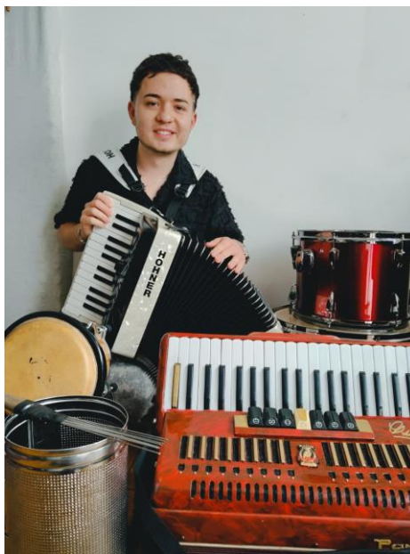
Ilustración 34. Acordeones y Tambores.

Para terminar, se puede dar por satisfecha la necesidad creativa de resaltar ambos instrumentos (acordeón y percusión) en una composición que muestre y enriquezca el que hacer investigativo, musical y compositivo del investigador y futuros intérpretes.