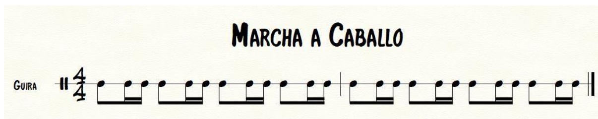
Ilustración 11. Merengue a caballo en Güira

pero brinda otro color a la marcha y permite una variación tímbrica en ella. A continuación, dos ejemplos de las dos formas de interpretar la marcha en el merengue.