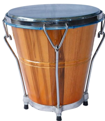
Ilustración 5. Caja Vallenata

Tomado de: (Diccionario colombiano, 2025, p. 1)