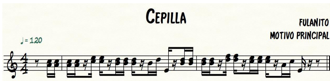
Ilustración 7. “El Cepillo” del autor Fulanito

Tomado de: Transcripción propia de la obra original de Fulanito.