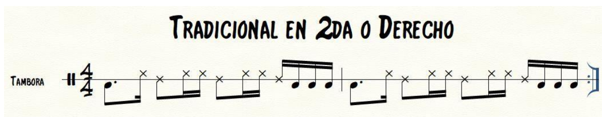
Ilustración 9. Merengue tradicional en Tambora Dominicana.

Tradicional en segunda, es el patrón anunciado por la tambora y se ejecuta en el desarrollo del tema, aquí la tambora añade más golpes de manera que enriquece y rellena la base rítmica de la canción. A continuación, un ejemplo transcrito de cómo se ejecuta la tambora en el Merengue tradicional en segunda. (García Martínez, 2021)