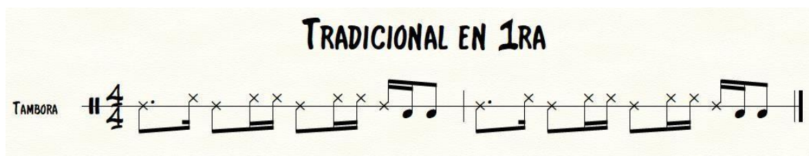
Ilustración 8. Merengue tradicional en Tambora Dominicana

el inicio del tema y prever el cambio animado y bailable del tema. A continuación, un ejemplo transcrito de cómo se ejecuta la tambora en el Merengue tradicional en primera.