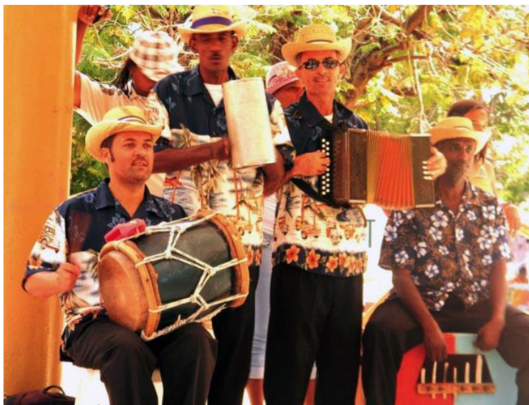
Ilustración 2. Formato de perico ripiao.