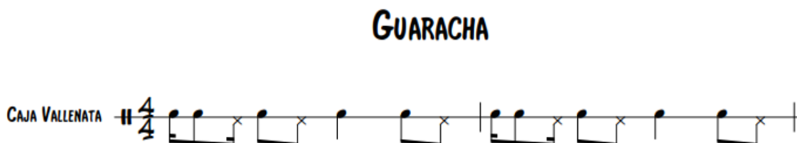
Ilustración. Ritmo de Guaracha en Caja Vallenata.