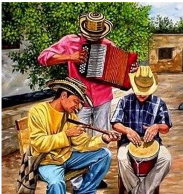
Ilustración 1. El origen del vallenato