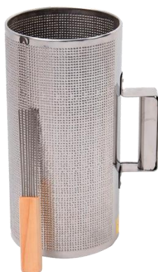
Ilustración 6. Guira