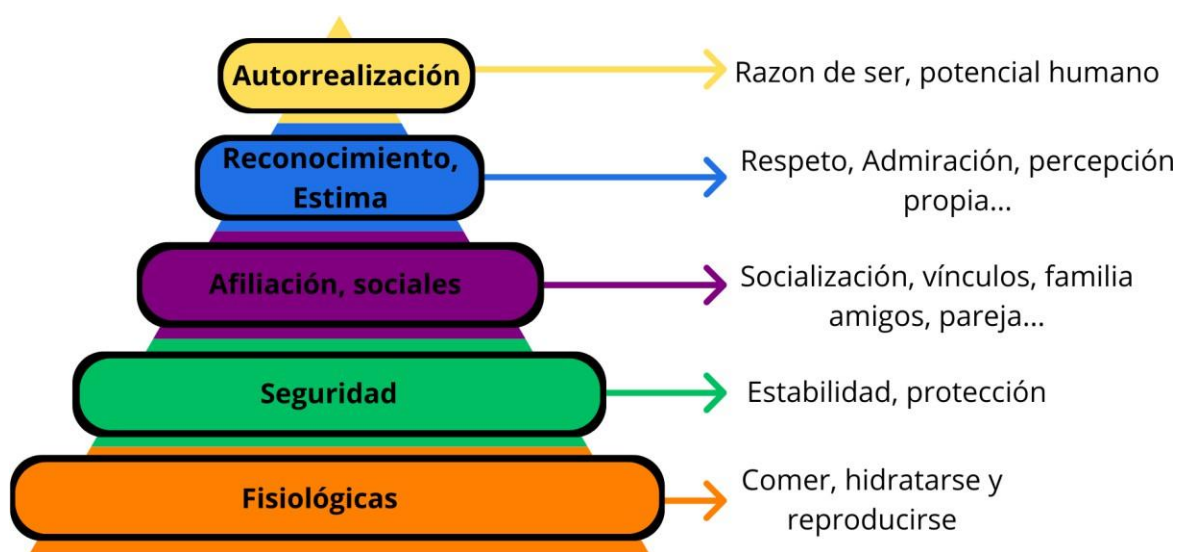
Figura 1 Necesidades humanas Abraham Maslow (1954).

Desde esta teoría se enfoca principalmente a las necesidades de afiliación y reconocimiento o estima, las cuales presentan una formación dentro de lo social, donde lo cooperativo de la formación toma un papel fundamental, ya que el querer ser parte de, se aborda en la construcción de un videojuego cooperativo, se piensa en conjunto y se realiza en conjunto llegando a metas establecidas, la afiliación es una herramienta indispensable la cual busca fomentar la participación dentro de un grupo en específico, y a partir del reconocimiento se generan la participación (activa) en todo momento del estudiante buscando superar los límites, llegando a reflexionar sobre la forma de realizar el ejercicio, el cual estando dirigido a los objetivos de transformación de realidad de individualismo a cooperación se genera un reconocimiento basado en consciencia social.