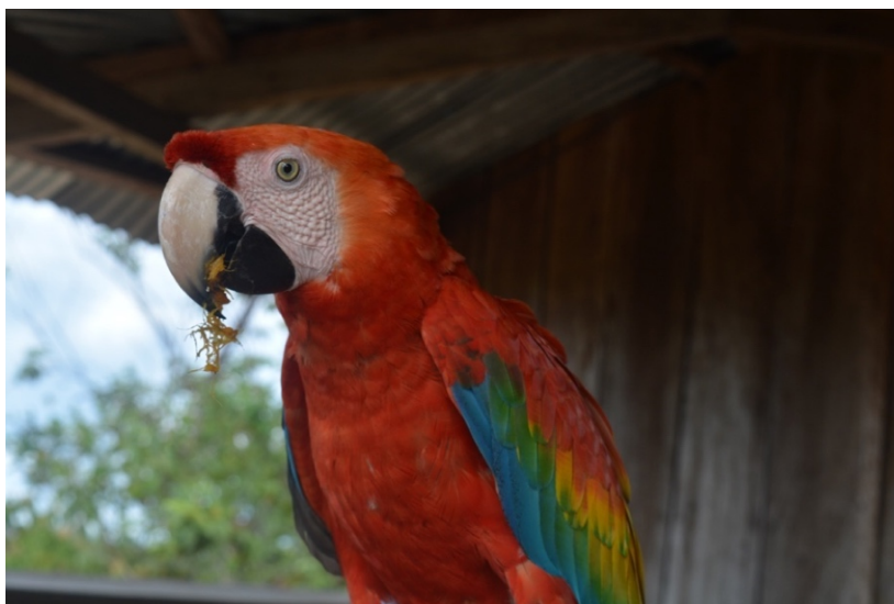
Fotografía 28. Ara Macao (Cárdenas, 2023)

En el departamento del Meta, el aviturismo se ha convertido en una actividad de gran importancia debido a la riqueza de su fauna y flora, y a la presencia de áreas naturales protegidas como son los Parques Nacionales Naturales Tinigua y Serranía de La Macarena, que tienen conectividad con la Serranía del Chiribiquete a través de las Sabanas del Yará. Este tipo de turismo fomenta la conservación de la biodiversidad y al mismo tiempo genera una visión hacia nuevos modos de vida, lo que significa que, es una alternativa económica para las comunidades (párr.5)