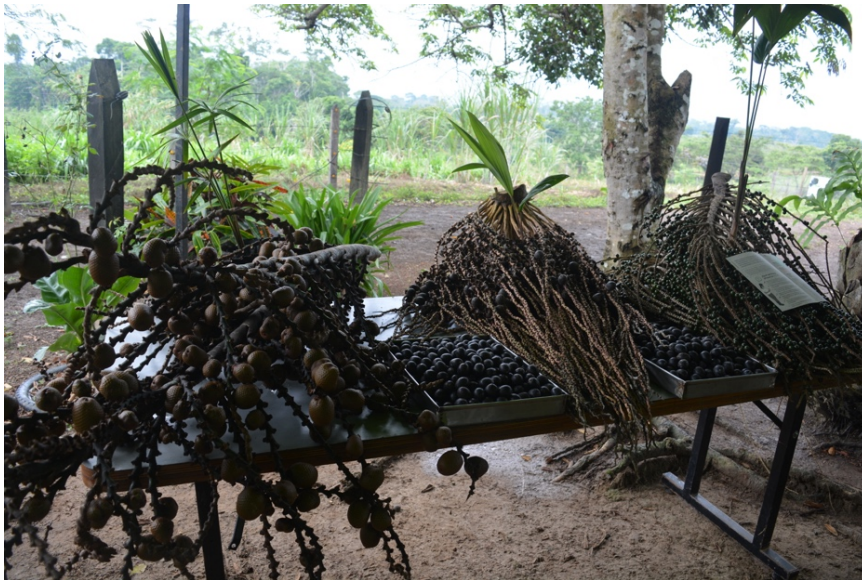
Fotografía 9. Fruto de la palma de Asaí (Cárdenas, 2023)

Visitando algunas fincas productivas en el Yará me encontré con una gran variedad de cultivos, había cocos, plátanos, yuca, batatas, piñas, mangos, naranjas, toronjas, tomates, cebollas, asaí, arazá y ajís, esto solo representa una parte de los que se produce en gran parte de las fincas, ya que en su mayoría se dedican a la producción y comercialización de queso, leche, yogurt y mantequilla elaborados por familias campesinas de la región.