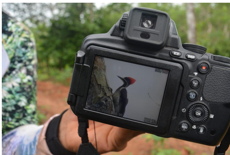
Fotografía 29. Carpintero común (Cárdenas,2023)

A través del proyecto Amazonía Sostenible para la Paz, se ha logrado potenciar el conocimiento biológico de diferentes niños, niñas, jóvenes y adultos de la región mediante el aviturismo, los cuales les ha apasionado el aprendizaje de las aves y poder contribuir al cuidado y conservación de sus hábitats; a través de la fotografía de la flora y fauna, los habitantes del Yari han tenido la oportunidad de participar como exponentes y guías en eventos de gran importancia, como el Global Big Day 7 .