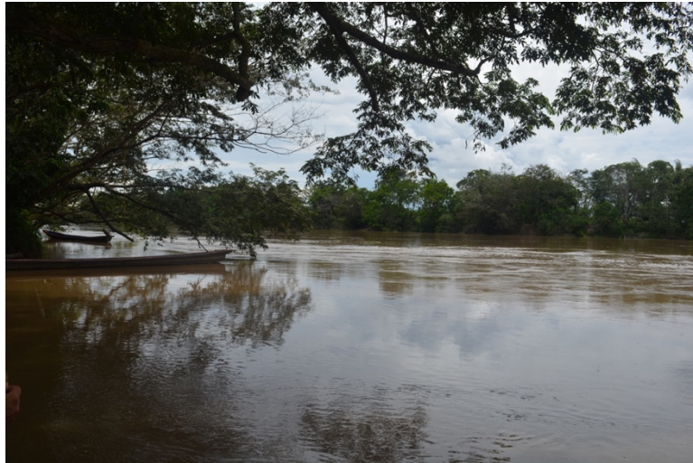
Fotografía 15. Río Guayabero (Cárdenas, 2023)

En la vereda Alto Morrocoy la comunidad en el marco del proyecto Amazonía Sostenible para la Paz implementado por el PNUD, se construyó un sendero ecológico de 3 kilómetros aproximadamente, el cual “permite a turistas conocer y valorar las culturas locales y las prácticas comunitarias de cuidado ambiental, aportando a los procesos de formación y de desarrollo económico y social para las nuevas generaciones, el futuro de la Amazonía y el planeta” (PNUD,2023. párr.10)