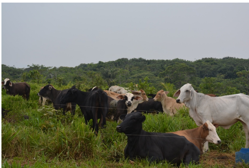
Fotografía 8. Finca ganadera- Sabanas del Yará (Cárdenas, 2023)

este hermoso país y dedican su vida a las labores en el campo. Todos los días muy temprano se levantan a tomarse un tinto oscuro y a iniciar su jornada de trabajo; los oficios pueden variar, a veces se encargan de ordeñar, alimentar a las vacas, cerdos y pollos, regar los cultivos, labrar la tierra, recoger las cosechas y seguir sembrando. Sin duda este trabajo implica un gran esfuerzo físico para los campesinos, son largas horas al día expuestos al sol o la lluvia, sin embargo, hace parte de una de las principales fuentes de sustento para sus familias.