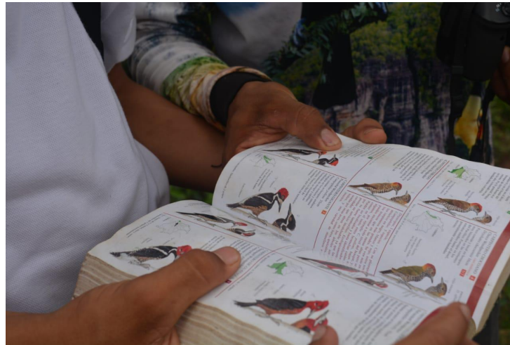
Fotografía 30. Avistamiento de aves Sendero Alto Morrocoy (Cárdenas, 2023)

“El departamento del Meta reportó 685 especies de aves y logró quedarse con el primer puesto del Global Big Day 2024. Cormacarena se sumó a esta iniciativa que se realiza en varios países del mundo con motivo de proteger las aves migratorias y sus hábitats, participando en 9 puntos de diferentes municipios junto a avistadores expertos y aficionados que realizaron este ejercicio” (Prensa, 2024).