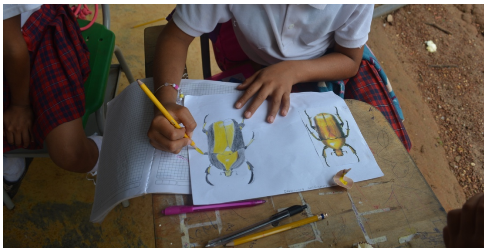
Fotografía 6. Intervención de clases ciencias naturales (Cárdenas,2023)

El análisis de la imagen permite dar cuenta de distintos significados que le otorga el observador y el sujeto observado, tanto desde el lugar de productor como de receptor de las imágenes. En efecto, el valor que tiene la imagen para la investigación en ciencias sociales se caracteriza por permitirnos descubrir y describir la realidad de cierto modo, funcionando como representación del fenómeno observado en un determinado contexto y profundizando sobre la actividad reflexiva (Bonetto, 2016, p.80).