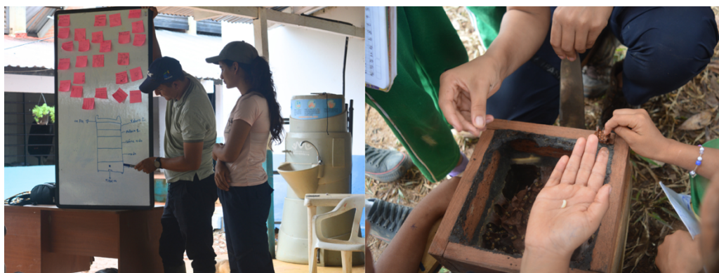
Fotografía 22. Talleres promotoría campesina del Yará (Cárdenas, 2023)

de la miel, polen, cera y propóleo en Casa Yará, que es una tienda comunitaria donde las y los campesinos pueden ofrecer sus productos “Por ejemplo, en la finca de nosotros, cuando llegó la iniciativa de trabajar con abejas, nosotros fuimos como la primera familia que comenzamos a trabajar con abejas, y entonces ahí los demás vieron que era algo productivo, que las abejas no maltrataban, no hacían daño, entonces los fincarios se interesaron en trabajar con ellas y además protegerlas no deforestando y por el contrario sembrando más” (Ayala, 2023).