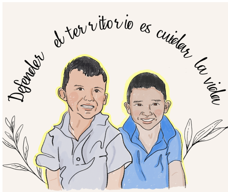
Fotografía 17. Ilustración Memorias vivas “El territorio narrado por niñas y niños del Yari” (Cárdenas, 2024)

“En Colombia salvar la Amazonía se convirtió también en un propósito de la cooperación internacional, que además también estuvo muy comprometido con territorios de paz, porque en Colombia el cuidado de la naturaleza y los ecosistemas estratégicos está absolutamente unido a la consolidación de la paz” (Muhamad, 2023, intervención pública)