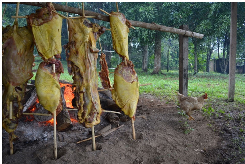
Fotografía 1. Carne a la llanera, plato típico de la región (Cárdenas, 2023)

el paisaje cambio totalmente, estábamos entrando a la Amazonía, a la selva, al monte, allí supe que habíamos llegado (Cárdenas, 2023).