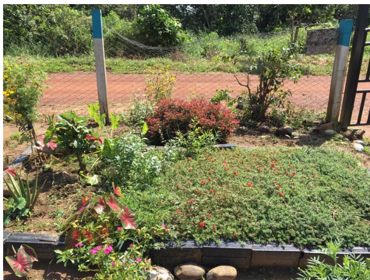
Fotografía 20. Jardín de los polinizadores (Cárdenas, 2024)

podieran alimentarse del néctar y dispersar el polen entre las flores; esta propuesta se concluyó en el transcurso del 2024 por iniciativa de los actuales docentes, en donde buscan seguir promoviendo escenarios de protección en torno a los polinizadores.