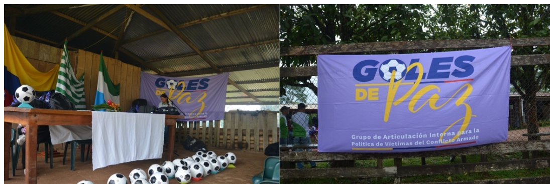
Fotografías 14. Iniciativa Goles de paz Ministerio del Interior y de Justicia (Cárdenas, 2023)

minutos en la cancha terminaba sudando y cansada más que nunca, sin duda jugar en el territorio requiere un esfuerzo físico que ellos han sabido adquirir con el tiempo.