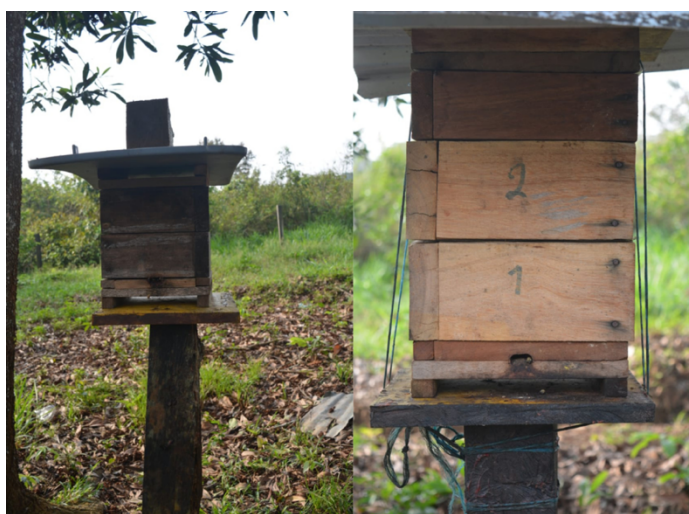
Fotografía 21. Meliponarios Centro Educativo Las Brisas (Cárdenas, 2023)

La promotoría realizó diferentes monitoreos, visitas y talleres durante la práctica en las clases de ciencias naturales con los niños y niñas, para que ellos pudieran aprender y encargarse del manejo de los meliponarios, además esta iniciativa logró involucrar a maestros, estudiantes y padres de familia, permitiendo ser un eje de articulación e integración de toda la comunidad educativa.