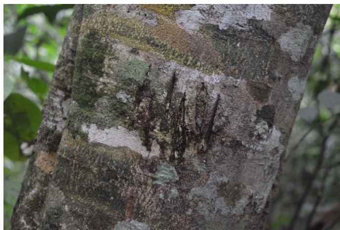
Fotografía 26. Rastro de felino no identificado Sendero Alto Morrocoy (Cárdenas, 2023)

La deforestación que disminuye de manera considerable los bosques donde habita el jaguar es la principal amenaza para esta especie. La pérdida de bosques se debe a la expansión de la frontera agraria, la ganadería y el establecimiento de asentamientos humanos que reducen el área natural del jaguar. A esto se suma también la presencia de grupos ilegales como los narcotraficantes que deforestan para abrir paso a pistas de aterrizaje clandestinas y vías ilegales (párr. 3).