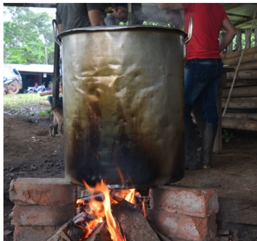
Fotografía 11. El fogón (Cárdenas, 2023)

Este ejercicio requiere de un gran compromiso y preparación, a la hora de montar la olla se encuentran hombres, mujeres, jóvenes e incluso niños que, con mucho amor y sazón, buscan compartir por medio del alimento. Inicialmente hay que ponerse de acuerdo con lo que se va a preparar, allí surgen preparaciones muy típicas de las familias colombianas, luego se consigue el menaje y los ingredientes, se prepara el fogón de leña, se prepara el alimento y finalmente se sirve su buen plato de comida.