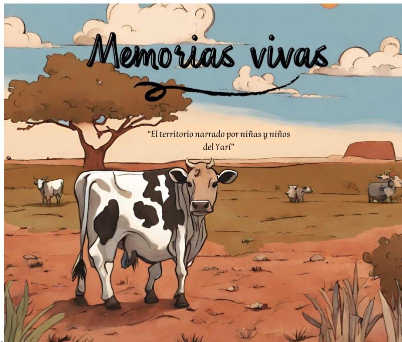
Fotografía 7. Portada Memorias Vivas “El territorio narrado por niñas y niños del Yari” (Cárdenas, 2024)

Finalmente se crea el material pedagógico “Memorias vivas: el territorio narrado por niñas y niños del Yari” a modo de cartilla ilustrada la cual está en formato digital y física para su uso, esta es producto de las intervenciones de la clase de Ciencias Naturales y recoge la interpretación que tienen los estudiantes de primaria sobre su territorio y también hace parte de la caracterización de las dinámicas educativas.