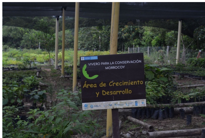
Fotografía 23. Vivero comunitario (Cárdenas, 2023)

Estas comunidades organizadas recuperan con el Paisaje Productivo Sostenible la conectividad de bosques en 62 mil hectáreas, realizan restauración ecológica en sus fincas con la producción material vegetal en viveros comunitarios de más de 160 especies de árboles nativos amazónicos, hacen sostenible la ganadería. (párr.11)