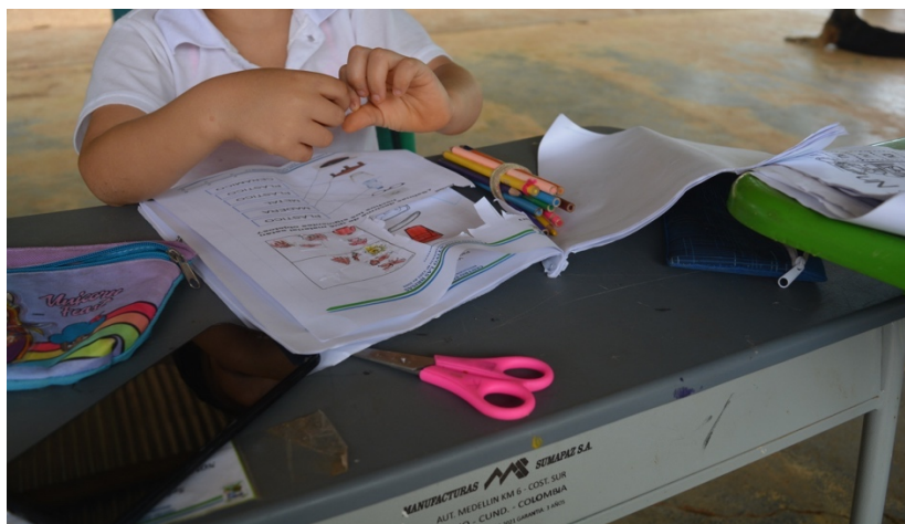
Fotografía 34. Acompañamiento a clases de primaria (Cárdenas, 2023)

diferentes lugares para que nos puedan colaborar los diferentes entes y muchas veces no tenemos ese aporte para poder mejorar un poco nuestra educación. Sin embargo, cada uno de nuestros compañeros damos lo mejor para que esta educación no quede tan a lo antiguo, o sea, tan lento, y buscamos diferentes estrategias y metodologías para que los estudiantes puedan adquirir un buen conocimiento y su nivel educativo pueda mejorar. En muchas ocasiones nosotros hemos ganado diferentes proyectos. ¿Por qué? Porque acá en la zona rural le ponemos más empeño y más cuidado a las falencias que tiene cada estudiante” (Entrevista semiestructurada, 2023)