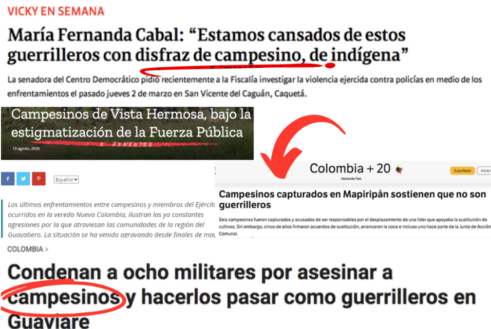
Fotografía 10. Collages enunciados de medios de comunicación (Cárdenas, 2024)

“Los campesinos no somos generadores de violencia, los campesinos reclamamos derechos y hacemos exigencias, lo que si somos es responsables y cuando exigimos lo hacemos con contundencia, pero no lo hacemos ni para generar vandalismo, ni para generar violencia, ni para masacrar al pueblo, lo hacemos siempre en defensa de los territorios, lo hacemos siempre en búsqueda de las soluciones y de las garantías que hay desde los territorios, entonces para que no escuchemos ese mal mensaje que muchas veces hacen los medios de comunicación, donde nos presentan como los vándalos, nos presentan como los guerrilleros” (comunicación personal, abril, 2023)