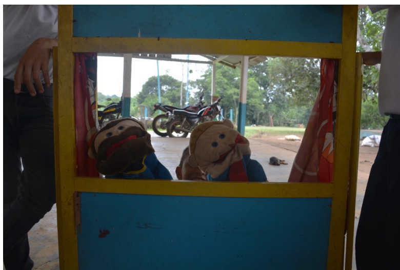
Fotografía 35. Titereteando (Cárdenas, 2023)

estudiante prácticamente que la resuelva sin necesidad del docente, en este caso, pues hablamos de que el docente en el aula es solamente un orientador, es como el puente que hay entre el estudiante y el conocimiento; otra ventaja y a la vez es una desventaja, lo veo yo, es la flexibilización que hay para en estos casos, ya que en el modelo de Escuela Nueva se supone que el estudiante va un propio ritmo, entonces en muchos casos no se le puede exigir con tanta intensidad” (Entrevista semiestructurada, 2023)