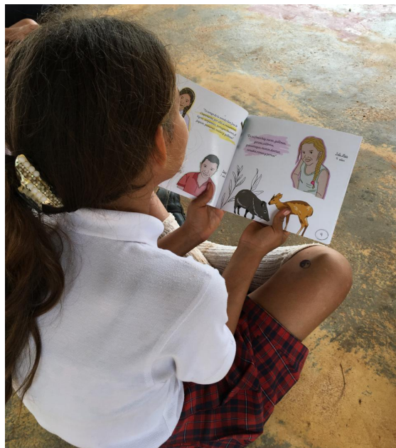
Fotografía 36. Lectura compartida de “Memorias vivas: El territorio narrado por niñas y niños del Yari” (Cárdenas, 2024)

Además como se mencionó en la metodología en julio del 2024 se viaja nuevamente al territorio para socializar el producto y recibir retroalimentaciones por parte de la comunidad educativa, este fue un momento de reencuentro muy emotivo, ya que los estudiantes no se lo esperaban, además la cartilla genera un gran impacto y se convierte en un ejercicio de memoria viva, puesto que permite recordar nuevamente la experiencia y quienes fueron parte de ella.