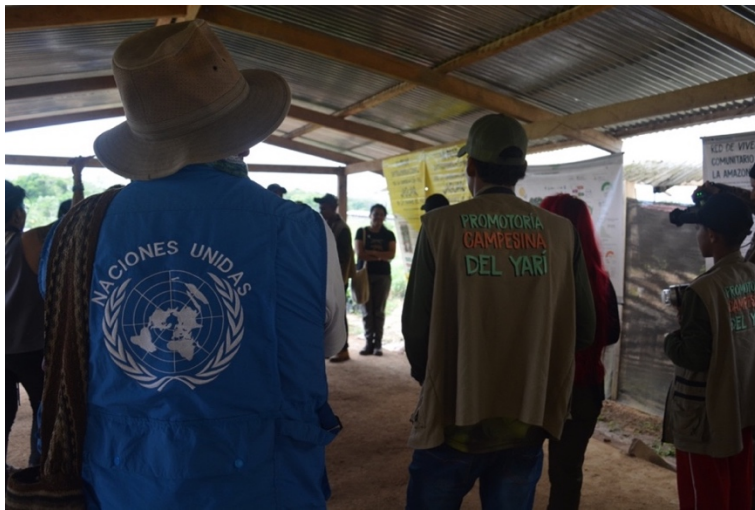
Fotografía 3. Encuentro territorial de líderes sociales y entidades ambientales (Cárdenas, 2023)

Pese al contexto de violencia y deforestación producto de la ganadería y cultivos ilícitos que tienen Las Sabanas del Yará, las comunidades campesinas se han visto en la necesidad de organizarse y juntarse para transformar desde lo comunitario esta realidad, lo cual surge como una posibilidad de construir nuevos caminos que dignifiquen sus vidas, pero también como una forma de defender el territorio y cuidar la vida. En la vereda Alto Morrocoy pude conocer diferentes campesinos que se han convertido en líderes sociales y ambientales, hombres y mujeres que por medio de acciones colectivas han creado iniciativas y propuestas para la paz y el cuidado de la naturaleza. A propósito, Vargas (2023) menciona: