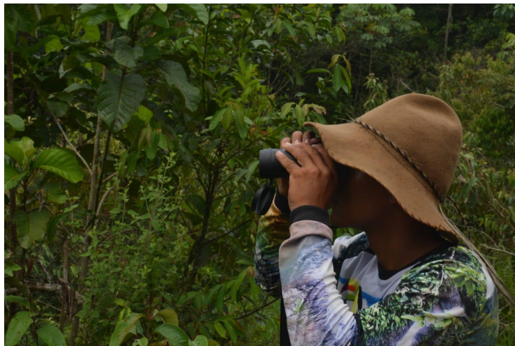
Fotografía 31. Avistamiento de aves Sendero Alto Morrocoy (Cárdenas, 2023)

El PDT de La Macarena busca, entre otros objetivos, la apropiación del territorio a través del conocimiento, la investigación y la interpretación de la biodiversidad única de la zona, que incluye una amplia variedad de especies de fauna y flora. Este enfoque contribuirá a la creación de un producto turístico diversificado que vincula a los habitantes locales en la ciencia participativa, permitiéndoles ser coinvestigadores y desempeñar un papel activo en el monitoreo de la región.