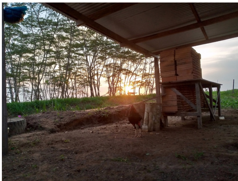
Fotografía 2. Vereda Alto Morrocoy (Cárdenas, 2023)

alrededor de diez pequeñas casas, el centro educativo Las Brisas, El Sendero Ecológico Alto Morrocoy y un vivero comunitario; la distancia entre cada finca puede variar, hay algunas que tienen mayor cantidad de hectáreas.