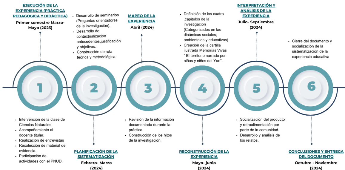
Esquema 1. diseño metodológico (Cárdenas, 2024)

Se diseña una ruta de sistematización que permite dar cuenta de los objetivos, para ello se toman en cuenta las fases que propone Oscar Jara (2013), las cuales se ajustan a la experiencia de la práctica pedagógica y didáctica.