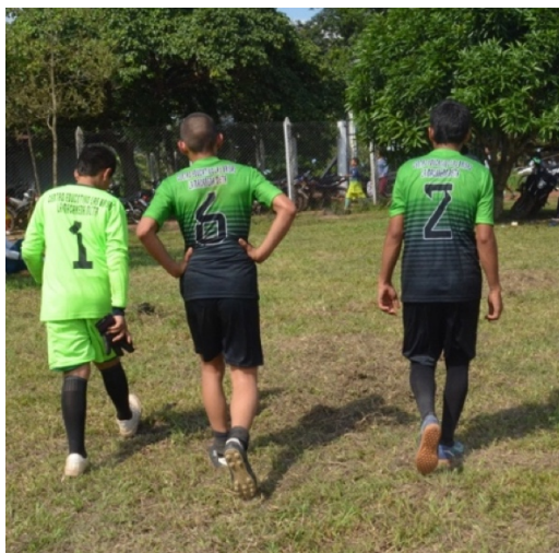
Fotografía 13. Inter colegiados del Yará (Cárdenas, 2023)

En las zonas rurales es normal encontrar canchas de fútbol improvisadas con algunos palos y piedras en los potreros llenos de tierra o pasto, a veces el terreno puede tener desniveles y obstáculos como piedras y charcos de agua; no siempre se cuenta con un balón para jugar, sin embargo, este no es un impedimento para poder hacerlo, porque el ingenio permite que se creen balones de fútbol de forma casera con cualquier objeto que asemeje algo redondo.